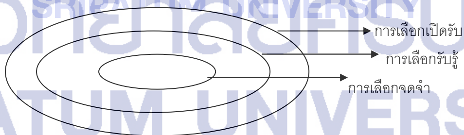
ภาพประกอบ 2 แสดงกระบวนการเลือกสรรในการรับสาร 3 ชั้น

ปัจจัยการสื่อสารที่มีการกล่าวถึงบ่อยๆ ว่าเป็นตัวกำหนดความสำเร็จหรือความล้มเหลวของการส่งสารไปยังผู้รับสาร ก็คือกระบวนการเลือกสรร (Selective Process) ของผู้รับสาร ซึ่งเปรียบเหมือนเครื่องกรอง (Filters) ขำสารในการรับรู้ของมนุษย์ ประกอบไปด้วยการกลั่นกรอง 3 ชั้น ดังนี้ (พีระ จีระโสภณ 2529: 639-640)