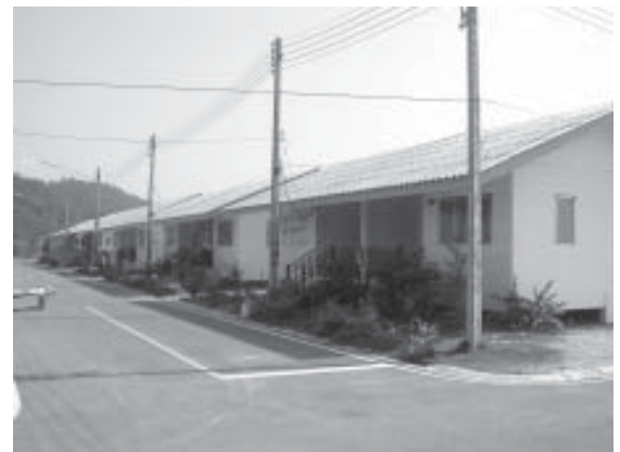
รูปที่ 5 แสดงรูปแบบบ้านพักอาศัย ที่ก่อสร้างโดยความช่วยเหลือจากหน่วยงานต่าง ๆ