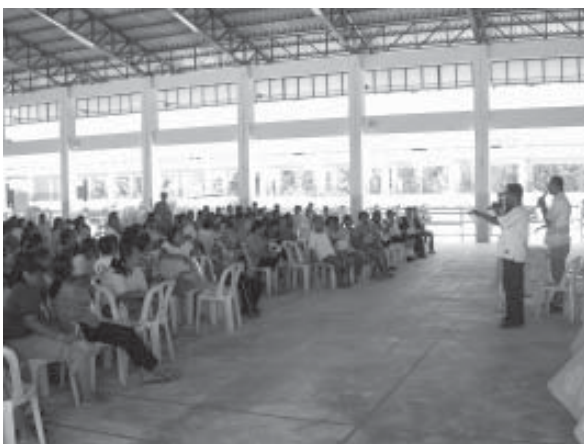
รูปที่ 10 การจัดเวทีประชาคมและการประชุมแกนนำชุมชนเพื่อกรอบแนวทางแผนพัฒนาชุมชนบ้านน้ำเค็ม