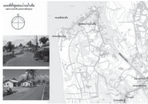
รูปที่ 1 แผนที่แสดงที่ตั้งของชุมชนผู้ประสบภัยสึนามิ ชุมชนบ้านน้ำเค็ม จังหวัดพังงา

ส่วนที่เป็นชุมชนจัดตั้งใหม่ และพื้นที่ที่ห่างไกลจากชุมชน ยังใช้ถนนลูกรังตามธรรมชาติอยู่ ระบบส่งไฟฟ้าเป็นแบบตั้งเสาพาดสายโดยเดินสายไฟหลักบริเวณริมถนนใหญ่ แยกย่อยเข้าสู่ถนนซอยเพื่อแจกจ่ายเข้าสู่บ้านเรือน โดยมีการติดตั้งระบบส่งไฟฟ้าเกือบทั่วทั้งพื้นที่ มีเฉพาะในที่อยู่ห่างไกลจากชุมชนที่ไฟฟ้ายังไม่ถึง ระบบจ่ายน้ำประปามีศูนย์กลางอยู่บริเวณริมถนนน้ำเค็มใกล้กับสถานีอนามัย ซึ่งเป็นพื้นที่ใจกลางของชุมชนมีการจ่ายน้ำประปาสู่บ้านพักอาศัยเกือบทั้งหมดในชุมชน ขาดแต่เพียงพื้นที่บางส่วนของชุมชนจัดตั้งใหม่ และพื้นที่ที่อยู่ห่างไกลจากชุมชนที่น้ำประปายังไม่ถึง ระบบระบายน้ำผิวดินยังขาดการก่อสร้างทางระบายน้ำถาวรทั้งบริเวณถนนสายหลัก และถนนสายรอง อาศัยการระบายน้ำตามธรรมชาติจากผิวถนนลงสู่พื้นที่สองข้างถนน และระบายลงสู่ทะเล ซึ่งส่วนมากจะเป็นชุมชนเมืองคลอง และชายหาดลงสู่ทะเล และระบบบำบัดน้ำเสียในชุมชนน้ำเสียจากครัวเรือนที่เป็นน้ำโสโครกจากส้วม ซึ่งโดยมากใช้ระบบบ่อเกราะ-บ่อซึม ในการบำบัด ส่วนน้ำทิ้งจากครัว ส่วนมากปล่อยลงทางระบายน้ำสาธารณะโดยปราศจากการบำบัด