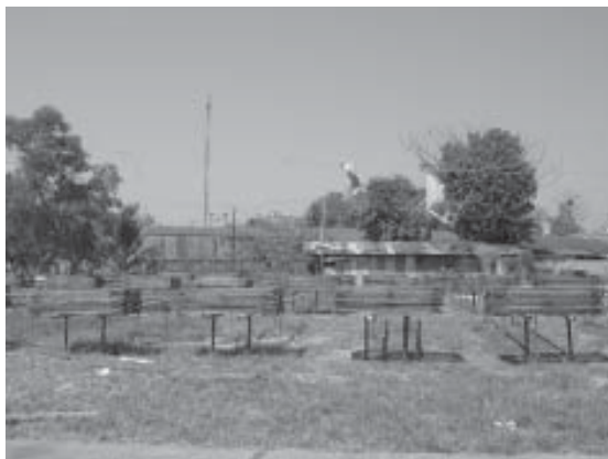
รูปที่ 4 แสดงลักษณะเฉพาะของกิจกรรมทางเศรษฐกิจขนาดเล็ก เช่น การแปรรูปสินค้าทางการประมง

• เห็นผลกระทบจากเหตุการณ์พิบัติภัยสึนามิ ทั้งการเปลี่ยนแปลงทางกายภาพ ได้แก่ อาคารบ้านเรือน องค์ประกอบชุมชน (รูปที่ 5) ทางสังคม-เศรษฐกิจ ได้แก่ อาชีพ และการรวมกลุ่มใหม่ ๆ ซึ่งได้ถูกส่งเสริม เช่น กลุ่มต่อเรือ (รูปที่ 6) กลุ่มซ่อมจักรยานยนต์ กลุ่มผ้ามัดติก ทางสภาพแวดล้อม อาทิ ทางน้ำ และแนวสันทรายที่เปลี่ยนไป รวมไปถึงสภาพป่าชายเลน อีกทั้งองค์ประกอบอื่น ๆ เช่น เรือสีส้ม (รูปที่ 7) และ เรือสีฟ้า ซึ่งเป็นสัญลักษณ์ตัวแทน