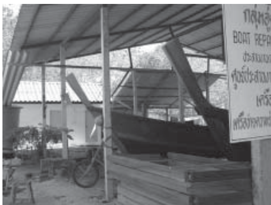
รูปที่ 6 กลุ่มต่อเรือ-กลุ่มกิจกรรมอาชีพที่ได้รับการส่งเสริมขึ้นใหม่