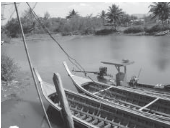
รูปที่ 8 แสดงสภาพชุมชนเมืองเก่าทั้งที่สามารถเชื่อมกับคลองธรรมชาติได้และลักษณะชุมชนเมืองที่เป็นหนองน้ำขนาดใหญ่

การจัดเตรียมเวทีสาธารณะเพื่อการระดมความคิดเห็นและแลกเปลี่ยนความคิดเห็น เพื่อให้ความเห็นของสมาชิกแต่ละคนในชุมชนมีส่วนร่วม ในการออกแบบพัฒนาพื้นที่นั้นเป็นขั้นตอนสำคัญขั้นตอนหนึ่ง คณะผู้เขียนได้เลือกใช้เครื่องมือสองประการ ในการระดมความคิดเห็นของชาวชุมชน ได้แก่ ประการแรก คือการจัดเวทีประชาคมชุมชนบ้านน้ำเค็ม และประการที่สอง คือ การจัดประชุมแกนนำชุมชน เพื่อหาหรือถึงการกรอบแนวทางของแผน ในส่วนของการจัดเวทีประชาคมระดับชุมชนขึ้นในพื้นที่ (รูปที่ 10) ก็เพื่อชี้แจงถึงการจัดทำแผนพัฒนาชุมชนบ้านน้ำเค็ม จากความต้องการของชุมชน โดยระดมความคิดเห็นและเรียกร้องข้อเสนอแนะและความคิดเห็นของชาวชุมชน ซึ่งข้อเสนอแนะและข้อคิดเห็นเหล่านี้จะถูกควมรวมในแผนพัฒนาพื้นที่ชุมชนบ้านน้ำเค็มวิธีการที่ใช้ ได้แก่ การอธิบายบอกเล่าในรูปแบบการระดมความคิดเห็น โดยให้ผู้เข้าร่วมประชาคมเสนอความคิดเห็นทั้งแบบเปิดเผย(โดยการเสนอความเห็นกลางเวทีสาธารณะ)