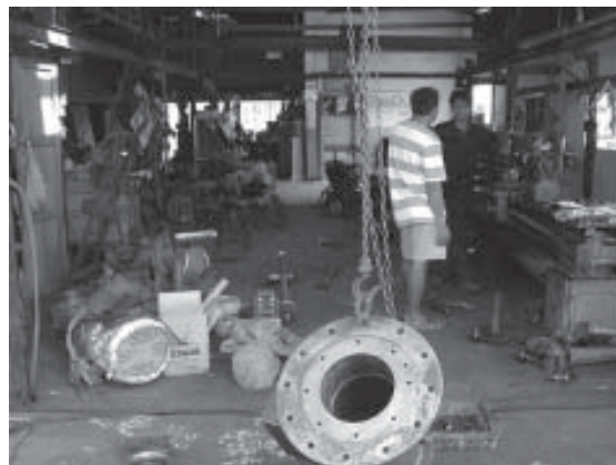
รูปที่ 9 กิจกรรมโรงกลึงอุปกรณ์เรือและใบพัดตักแร่ ก็สามารถบอกถึงที่มาที่ไปของชุมชนได้