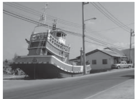
รูปที่ 7 เรือสีส้ม สัญลักษณ์ของเหตุการณ์พิบัติภัยสึนามิ