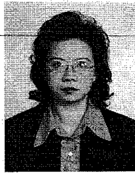
ประวัติย่อ