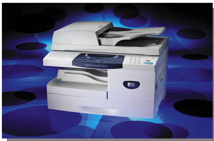
ภาพที่ 3 แสดงอุปกรณ์ต่อพ่วงจากคอมพิวเตอร์ที่รวมเอาหลายชนิดมาไว้ในที่เดียวกัน (Multifunction) คือ เครื่องพิมพ์สี, สแกนเนอร์, เครื่องถ่ายสำเนาเอกสาร, เครื่องโทรสาร (Gary B. Shelly : 2007 : 323)

ได้เร็วมาก เป็นสิ่งจำเป็นของทุกสำนักงาน ปัจจุบันเทคโนโลยีของเครื่องถ่ายเอกสารก้าวล้ำหน้าไปมาก สามารถถ่ายเอกสารสีได้ หรือเมื่อทำต้นฉบับจากเครื่องคอมพิวเตอร์เสร็จแล้ว สามารถส่งออกมาพิมพ์สำเนาในเครื่องถ่ายเอกสารได้ ซึ่งทำได้รวดเร็วมาก และมีการรวมเอาอุปกรณ์หลายชนิดมารวมไว้ที่เดียวกันเรียกว่า Multifunction