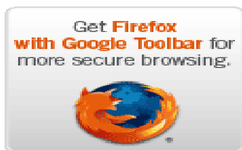
ภาพที่ 1 แสดงซอฟต์แวร์เว็บเบราว์เซอร์ Firefox ที่มีระบบรักษาความปลอดภัยที่ดีมากบนเครือข่ายคอมพิวเตอร์ ( http://bangkoktravel-bangkoksmile.blogspot.com )

นอกจากนี้ ยังมีซอฟต์แวร์ประเภท Web Browser คือ ซอฟต์แวร์ที่ใช้ในการติดต่อสื่อสารบนเครือข่ายอินเทอร์เน็ต เช่น Internet Explorer (IE) ของไมโครซอฟต์ ส่วนในค่ายของ Mozilla ซึ่งเป็นเจ้าตำรับของ Netscape Navigator ก็ไม่ยอมน้อยหน้าได้เปิดตัวซอฟต์แวร์ใหม่ชื่อ Firefox ซึ่งเป็นซอฟต์แวร์ประเภทเว็บเบราว์เซอร์ (Browser) เช่นเดียวกับ Internet Explorer (IE) ของค่ายไมโครซอฟต์ นัยว่ามีประสิทธิภาพในการค้นหาข้อมูลได้รวดเร็ว กอปรกับมีระบบรักษาความปลอดภัยอย่างดี โปรแกรม Firefox สามารถทำงานได้บนระบบปฏิบัติการของ Microsoft Windows, Mac OS X, และ Linux โปรแกรม Firefox ที่ออกมาให้อยู่ในปัจจุบันเป็นเวอร์ชัน 2.0.0.11 ซึ่งเปิดตัวเมื่อวันที่ 30 พฤศจิกายน พ.ศ. 2550 ส่วนเงื่อนไขของรหัสโปรแกรมของ Firefox ส่วนเป็นระบบเปิดเผย (Open Source) และให้บริการฟรี ผู้สนใจสามารถดาวน์โหลดซอฟต์แวร์ Firefox นี้ได้ฟรีที่เว็บไซต์ http://bangkoktravel-bangkoksmile.blogspot.com รวมถึงซอฟต์แวร์ประเภทอื่นๆ อีกมากกว่า 35,000 ชนิด (สุพล พรหมมาพันธุ์ : 2551 : 088)