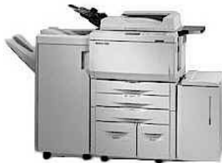
ภาพที่ 4 เครื่องพิมพ์ (Printer) ของ Konica 7060 ซึ่งเป็นระบบ Digital Printer/Copier ใช้สำหรับผู้ร่วมทำงานด้วยกันหลายคนสามารถพิมพ์เอกสารของกลุ่ม (Workgroup Document System : TM) สามารถพิมพ์งานมาออกที่เครื่องเดียวกัน พิมพ์ 7,100 แผ่นโดยไม่ต้องหยุด

เครื่องพิมพ์เลเซอร์ (Laser Printer) เครื่องพิมพ์ที่ใช้แสงเลเซอร์ ลักษณะคล้ายเครื่องถ่ายเอกสาร เป็นเครื่องพิมพ์ที่มีความคมชัดมาก มีทั้งเครื่องพิมพ์หมึกดำ และเครื่องพิมพ์สี มีราคาค่อนข้างแพง การทำงานมีวงจรไฟฟ้าเป็นตัวควบคุมเครื่อง และเครื่องพิมพ์จะรับคำสั่งในการพิมพ์จากคอมพิวเตอร์และสร้างแผนที่บิต (Bit Map) ของทุกจุดบนกระดาษ แสงเลเซอร์ที่ถูกควบคุมจากตัวควบคุมให้ถ่ายโอนทุกแผนที่บิตไปสู่ลูกกลิ้งทรงกระบอกที่มีประจุไฟฟ้าสถิต แสงเลเซอร์จะมีการปิดและเปิดสลับกันอย่างรวดเร็วและกระทบไปยังลูกกลิ้งที่จะดูดผงหมึกจากกอล่งผงหมึกในส่วนที่มีแสงผ่าน ความร้อนจากประจุไฟฟ้าทำให้ผงหมึกที่ติดมาจากลูกกลิ้งละลายติดบนกระดาษ ซึ่งทำให้เครื่องพิมพ์นี้ ทำงานได้เงียบและรวดเร็วมาก สามารถพิมพ์ได้ 8-12 หน้าต่อนาที ในปัจจุบันเครื่องพิมพ์เลเซอร์มีความสามารถในการพิมพ์ได้ไม่น้อยกว่า 600 DPI (Dots Per Inch) ซึ่งให้ผลลัพธ์ที่มีคุณภาพสูง เหมาะที่จะใช้งานในสำนักงานที่ต้องการคุณภาพงานที่ดี