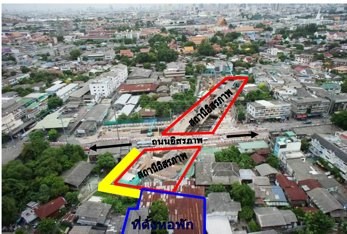
ภาพประกอบที่ 1.1 ที่ตั้ง หอพัก รถไฟฟ้ามหานคร สถานีอโศก

งานวิจัยนี้จึงมีวัตถุประสงค์ เพื่อศึกษาปัจจัยที่มีผลต่อการทำธุรกิจในพื้นที่ที่ทำการศึกษา พร้อมทั้งศึกษาพฤติกรรมผู้บริโภคในการตัดสินใจเช่าหอพัก และ จัดทำแผนธุรกิจของหอพักเพื่อนำไปขอสินเชื่อกับสถาบันการเงิน เพื่อการลงทุนประกอบธุรกิจดังกล่าว