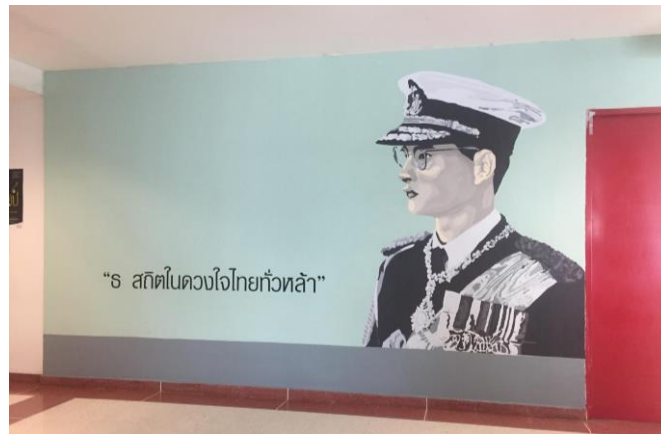
ภาพที่ 4 ภาพวาดพระบรมฉายาลักษณ์ที่เสร็จสมบูรณ์แล้ว

แต่อย่างไรก็ตาม ปัญหาที่เกิดจากการทำงานร่วมกันระหว่างเทคโนโลยียุคดิจิทัลกับวิธีการสร้างผลงานศิลปะบนสื่อแบบดั้งเดิมคือ การผสมสีสำหรับวาดภาพจากแม่สีให้ได้เฉดสีที่ตรงกันหรือใกล้เคียงกับเฉดสีดิจิทัลจากคอมพิวเตอร์ที่อยู่ในระบบ RGB ซึ่งสีทั้ง 2 แบบนี้มีวิธีการผสมสีแตกต่างกัน ต้องอาศัยความรู้เรื่องทฤษฎีสีและทักษะทางด้านศิลปะของผู้ผสมสีเพื่อให้ได้ผลลัพธ์ที่ใกล้เคียงกันที่สุด ซึ่งบางครั้งไม่สามารถผสมสีให้ได้เฉดเดียวกันเหมือนเดิมทุกครั้ง จึงต้องผสมสีแต่ละสีให้มีปริมาณเพียงพอต่อการทำงานภายในครั้งเดียวกันทั้งหมดให้ครบทุกเฉดสีตามที่ระบุไว้ในไฟล์ภาพต้นฉบับ