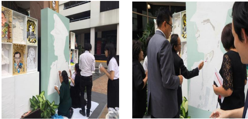
ภาพที่ 3 นักศึกษา อาจารย์ และบุคลากรภายในมหาวิทยาลัยเข้าร่วมกิจกรรม น้อมรำลึก “วาดภาพเพื่อส่งต่อความดีสู่ผู้ประสบภัยภาคใต้”

เมื่อนำเทคนิคนี้ไปใช้ร่วมกับไฟล์ดิจิทัลของภาพระบายสีตามตัวเลขที่สร้างขึ้นจากภาพพระบรมฉายาลักษณ์ ทำให้สามารถจัดกิจกรรมวาดภาพพระบรมฉายาลักษณ์ขึ้นเมื่อใดก็ได้ที่ต้องการ ใ้บุคคลทั่วไปได้มีส่วนร่วมในการสร้างสรรค์ผลงานภาพวาดพระบรมฉายาลักษณ์ที่มีความสวยงามใกล้เคียงกับภาพต้นฉบับ ซึ่งต่อมามีการนำไฟล์ภาพนี้ไปใช้ในการจัดกิจกรรมน้อมรำลึก “วาดภาพเพื่อส่งต่อความดีสู่ผู้ประสบภัยภาคใต้” ที่มหาวิทยาลัยศรีปทุม (บางเขน) ระหว่างวันที่ 25-26 มกราคม 2560 เพื่อสมทบทุนช่วยเหลือผู้ประสบภัยทางภาคใต้อีกด้วย