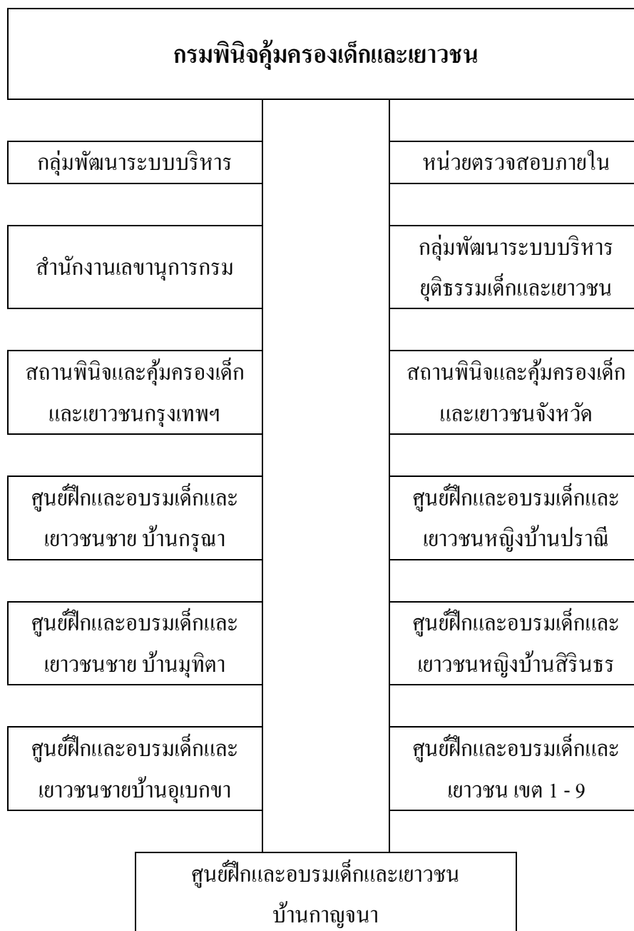
รูปภาพที่ 3 โครงสร้างกรมพินิจและคุ้มครองเด็กและเยาวชน 60