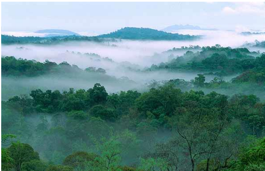
ภาพประกอบที่ 10 อุทยานแห่งชาติน้ำหนาว

8. พระตำหนักเขาค้อ ตั้งอยู่บนเขาป่า เป็นจุดสูงสุดของเขาค้อ สูงกว่าระดับน้ำทะเลประมาณ 1,050 เมตร เมื่อยืนอยู่บริเวณพระตำหนัก จะมองเห็นทัศนียภาพสวยงามมาก เมื่อครั้งที่พระบาทสมเด็จพระเจ้าอยู่หัวรัชกาลที่ 9 ได้เสด็จฯ มาทรงทำการเปิดอนุสรณ์สถานผู้เสียสละเขาค้อ ได้ทรงปรารภว่า บริเวณเขาค้อมีพื้นที่สวยงามน่าจะจัดทำโครงการ อะไรสักอย่างหนึ่งเพื่ออนุรักษ์ป่า ดังนั้นพระตำหนักเขาค้อจึงได้สร้างขึ้นเมื่อเดือน กรกฎาคม 2527 จากความร่วมมือของหลาย ๆ ฝ่ายเพื่อนำขึ้นน้อมเกล้าฯ ถวายแด่องค์พระบาท สมเด็จพระเจ้าอยู่หัว สำหรับใช้ประทับแรมในโอกาสที่พระองค์ท่านเสด็จฯ มาทรงเยี่ยมงานในโครงการพระราชดำริ และทรงเยี่ยมราษฎรในพื้นที่และจังหวัดใกล้เคียง พระบาทสมเด็จพระเจ้าอยู่หัวได้เสด็จฯ มาทรงทำพิธีเปิด พระตำหนักเขาค้อ เมื่อวันที่ 25 กุมภาพันธ์ 2528 ลักษณะตัวอาคารพระตำหนักเขาค้อ เป็นอาคารชั้นเดียวติดต่อกันเป็นรูปครึ่งวงกลม มีอาคารบางส่วน สร้างเป็นสองชั้น ชั้นบนเป็นห้องบรรทมของพระบาทสมเด็จพระเจ้าอยู่หัวและสมเด็จพระนางเจ้าฯ พระบรมราชินีนาถ ชั้นล่างแบ่งเป็นด้านซ้ายและขวาด้านซ้ายเป็นห้องพระราชทานเลี้ยง ห้องเสวย และห้องเข้าเฝ้าฯ ส่วนด้านขวาเป็นห้องบรรทมของพระบรมวงศานุวงศ์ใกล้กับบริเวณรอบพระตำหนักจะปลูกดอกไม้สีสวยงามหลากหลายชนิด