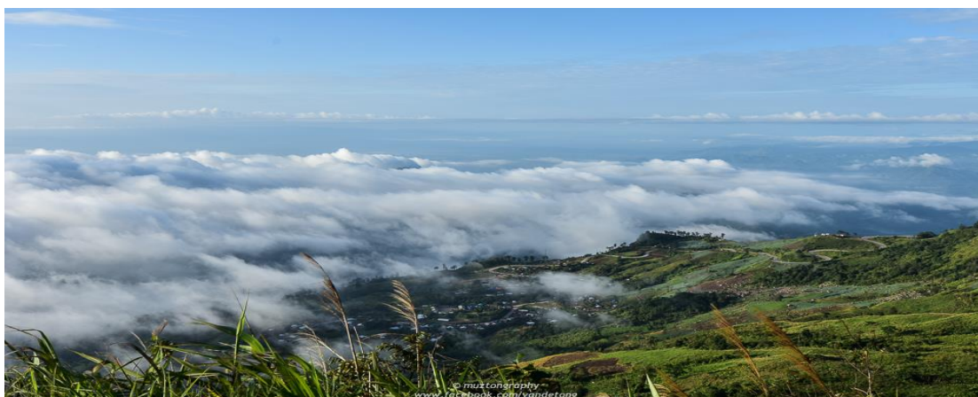
ภาพประกอบที่ 8 ภูทับเบิก

5. ภูทับเบิกตั้งอยู่ที่ตำบลวังบาล จังหวัดเพชรบูรณ์ มีความสูงจากระดับน้ำทะเลประมาณ 1,768 เมตร ทั้งยังเป็นจุดสูงสุดของจังหวัดเพชรบูรณ์ ความสวยงามของภูทับเบิกที่ใครมาเห็นก็ต้องหลงรัก เห็นจะอยู่ที่ภูมิประเทศ มองออกไปเบื้องหน้าเห็นทะเลภูเขา ป่าไมเขียวชอุ่มอุดมสมบูรณ์ โดยรวมแล้วอากาศที่ภูทับเบิกเย็นสบายตลอดทั้งปี ตอนเช้า ๆ จะมองเห็นหมอกและกลุ่มเมฆสีขาวตัดกับยอดภูสีเขียว ช่างสวยงามตา อีกทั้งยังเป็นเส้นทางเชิงท่องเที่ยวแหล่งท่องเที่ยวและประวัติศาสตร์สำคัญอย่าง “อุทยานภูหินร่องกล้า” อีกด้วย