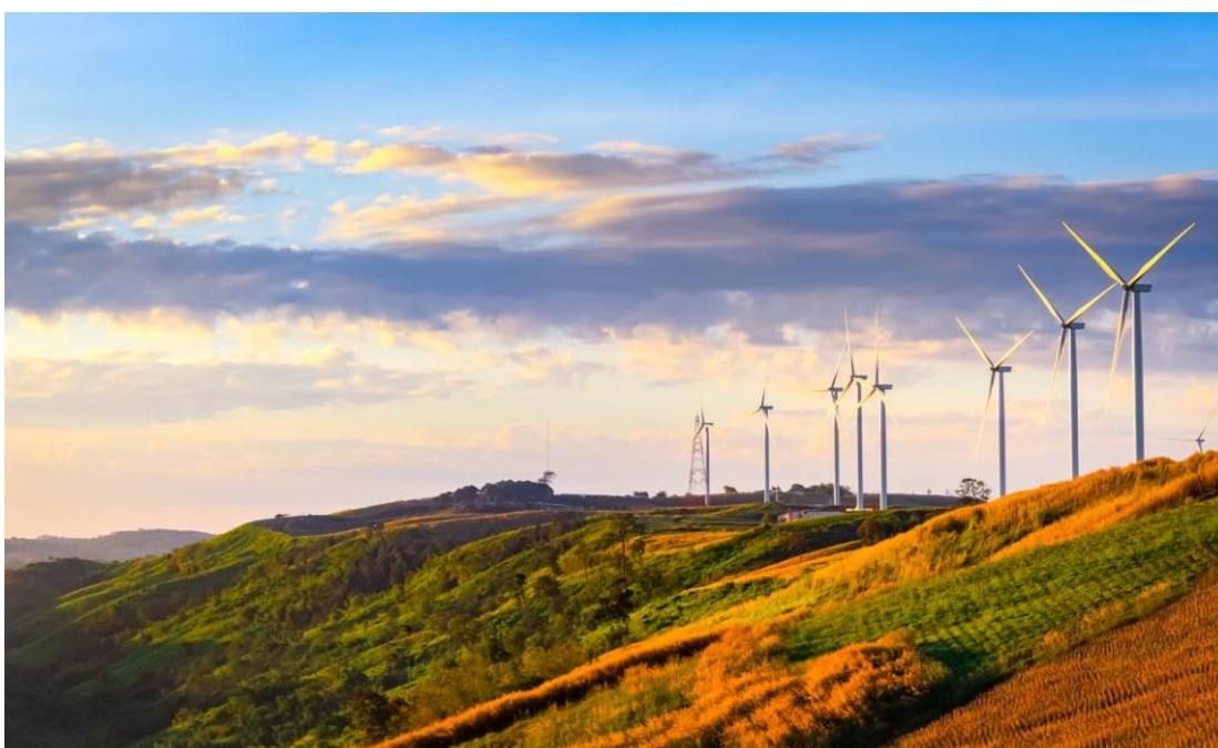
ภาพประกอบที่ 6 ทุงกั้งหันลม

3. ทุงกั้งหันลม ตั้งอยู่ในพื้นที่หมู่บ้านเพชรดำ จังหวัดเพชรบูรณ์ เมื่อเข้ามาในบริเวณแคมป์สน เพื่อไปยังเส้นทางท่องเที่ยวหลักบนเขาค้อ จะสามารถมองเห็นก้าหันลมโดดเด่น เนื่องจากจุดที่ตั้งของโครงการทุงกั้งหันลม อยู่บนเนินเขาสูง บนระดับความสูงกว่าน้ำทะเลประมาณ 1,050 เมตร ตระหง่านบนที่ราบยอดเขาเนื้อที่ 350 ไร่ จึงสามารถมองเห็นวิวทิวทัศน์ได้กว้างไกล