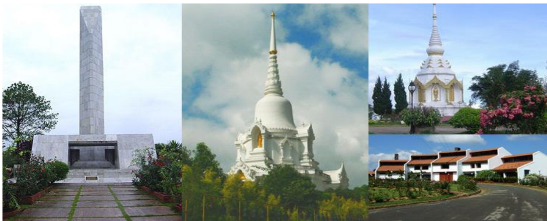
ภาพประกอบที่ 7 พระบรมธาตุเจดีย์กาญจนาภิเษก

4. พระบรมธาตุเจดีย์กาญจนาภิเษก ตั้งอยู่บนยอดเขาค้อ ติดกับสำนักสงฆ์วิชฌมัยบุญญาราม ยอดเจดีย์บรรจุพระบรมสารีริกธาตุที่อัญเชิญมาจากประเทศศรีลังกา เจดีย์แห่งนี้ชาวเพชรบูรณ์สร้างขึ้นเพื่อถวายเป็นพระราชกุศลแก่พระบาทสมเด็จพระเจ้าอยู่หัว เนื่องในวโรกาสทรงครองราชย์ครบ 50 ปี ในวันสำคัญทางศาสนา เช่น วันมาฆบูชาจะมีประชาชนเดินทางมาประกอบพิธีกรรมทางศาสนา ทำพิธีเวียนเทียนเป็นประจำ