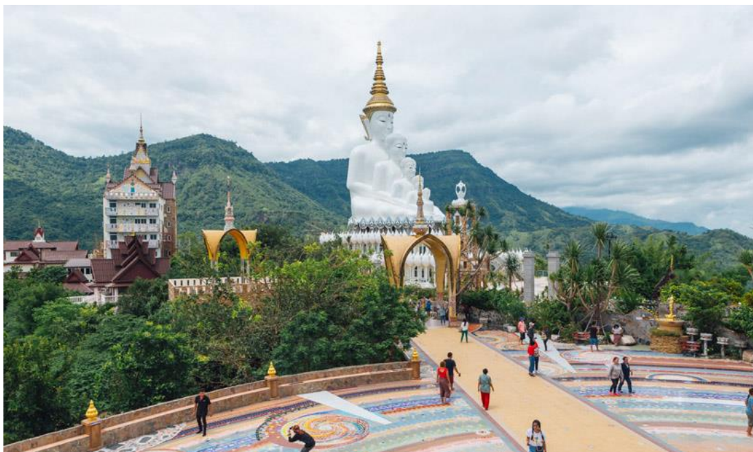
ภาพประกอบที่ 5 วัดผาช่อนแก้ว

3. ทุงกั้งหันลม ตั้งอยู่ในพื้นที่หมู่บ้านเพชรดำ จังหวัดเพชรบูรณ์ เมื่อเข้ามาในบริเวณแคมป์สน เพื่อไปยังเส้นทางท่องเที่ยวหลักบนเขาค้อ จะสามารถมองเห็นก้าหันลมโดดเด่น เนื่องจากจุดที่ตั้งของโครงการทุงกั้งหันลม อยู่บนเนินเขาสูง บนระดับความสูงกว่าน้ำทะเลประมาณ 1,050 เมตร ตระหง่านบนที่ราบยอดเขาเนื้อที่ 350 ไร่ จึงสามารถมองเห็นวิวทิวทัศน์ได้กว้างไกล