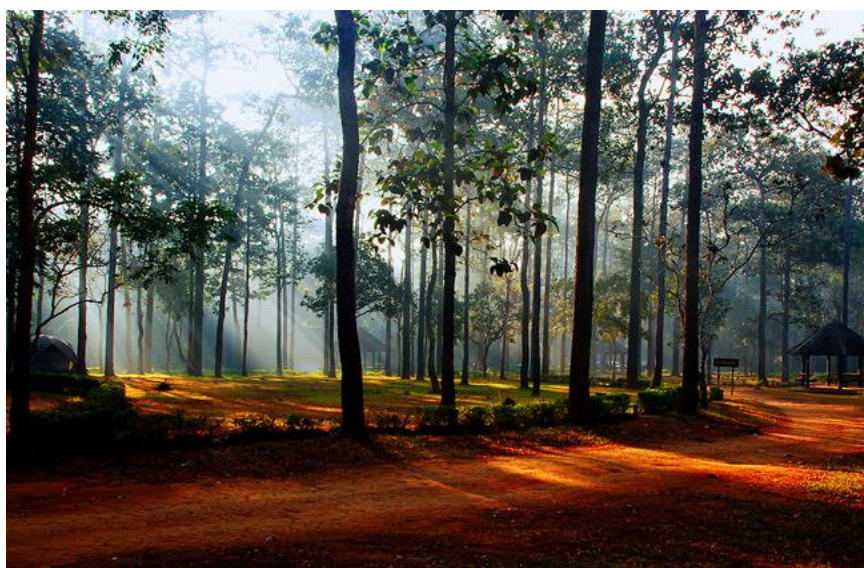
ภาพประกอบที่ 9 ทุ่งแสงหลวง

6. ทุ่งแสงหลวง หรือ “ทุ่งหญ้าสะวันนาแห่งเมืองไทย” เป็นอุทยานแห่งชาติที่มีขนาดใหญ่เป็นอันดับ 3 ของประเทศ ถือเป็นแหล่งผืนป่าสะวันนาแห่งเดียวของภาคเหนือที่ยังคงความอุดมสมบูรณ์ ภายในอุทยานครอบคลุมพื้นที่สองจังหวัด คือเพชรบูรณ์และพิษณุโลก มีพื้นที่เป็นทุ่งหญ้าโล่งกว้าง เนื้อที่ประมาณ 16 ตร.กม. ตามเส้นทางจะตัดผ่านป่าเบญจพรรณ มีพันธุ์ไม้ดอกมากมาย และอาจเจอสัตว์ป่าออกมาหากินตามข้างทาง นอกจากนี้ยังมีทุ่งหญ้าแบบสะวันนาสลับกับป่าสนสองใบ คือทุ่งหญ้าเมืองเลนและทุ่งโนนสน นักท่องเที่ยวนิยมมาเดินป่าและกางเต็นท์พักแรม โดยทางอุทยานจะเปิดให้เข้าไปเที่ยวได้ในเดือนตุลาคม - พฤศจิกายนของทุกปี