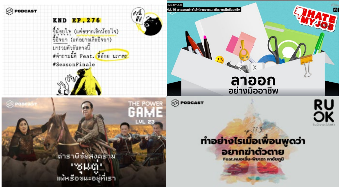
ภาพที่ 1 การออกแบบภาพ ตัวอักษร และชื่อตอนของพอดแคสต์ THE STANDARD (“THE STANDARD PODCAST”, 2019)

3. ความสม่ำเสมอ และต่อเนื่องในการเผยแพร่ ซึ่งนับเป็นปัจจัยสำคัญของผู้ผลิตคอนเทนต์ทุกรูปแบบ เหมือนเช่น รายการ Mission to the Moon ที่ออกอากาศเฉลี่ยทุกวัน หรือช่อง The Standard ก็มีคอนเทนต์ใหม่ จากช่องรายการย่อยหมุนเวียนเผยแพร่อยู่ทุกวันเช่นกัน