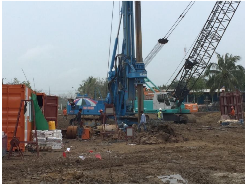
รูปที่ ก.3 ปัญหาสภาพภูมิอากาศ