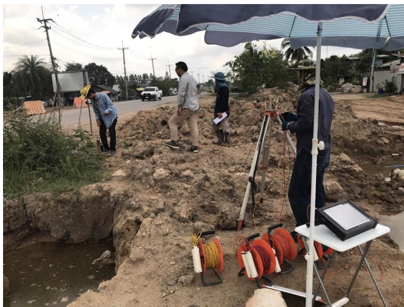
รูปที่ ก.7 ท่อSonic Logging เสียหาย