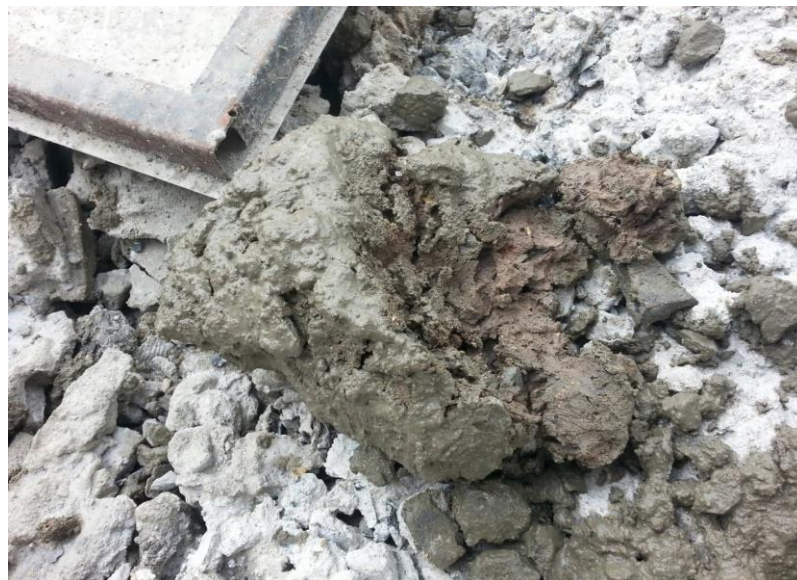
รูปที่ ก.2 ปัญหาคอนกรีตไม่ได้คุณภาพ