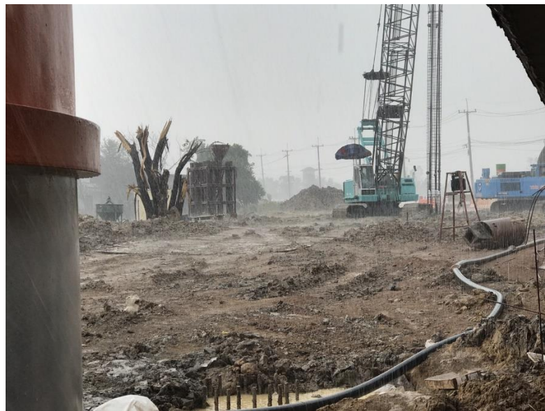
รูปที่ ก.4 ปัญหาสภาพภูมิอากาศ