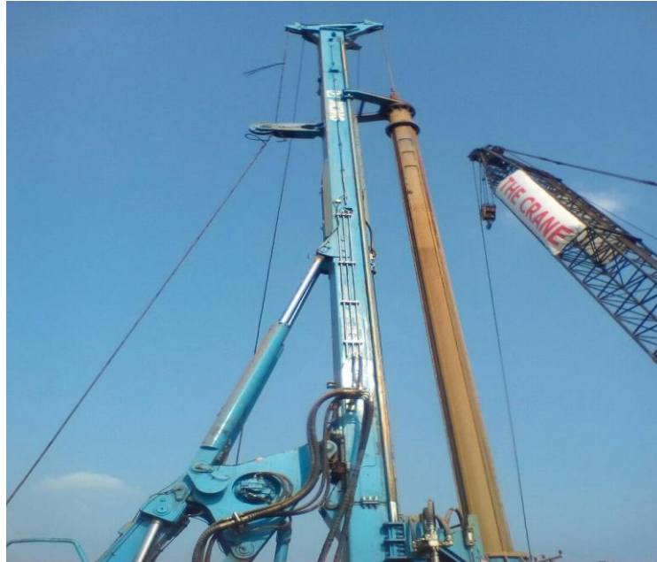
รูปที่ ก.5 ปัญหาเครื่องจักรเสียหาย