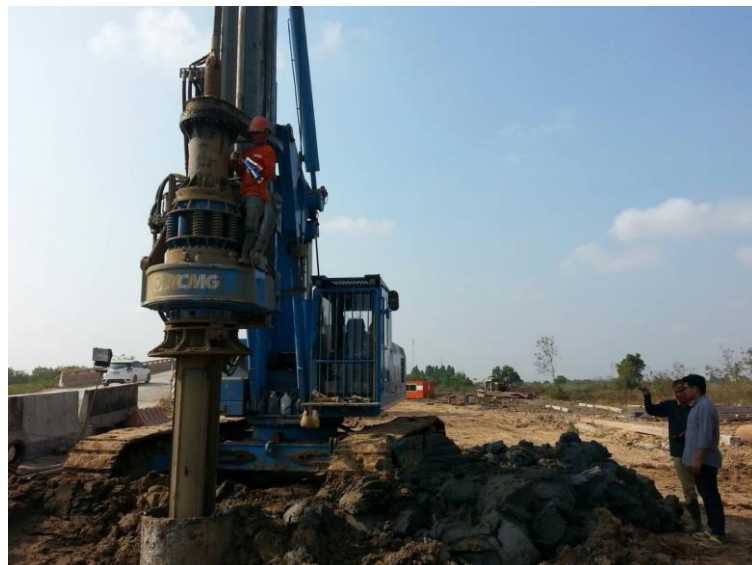
รูปที่ ก.6 ปัญหาเครื่องจักรเสียหาย