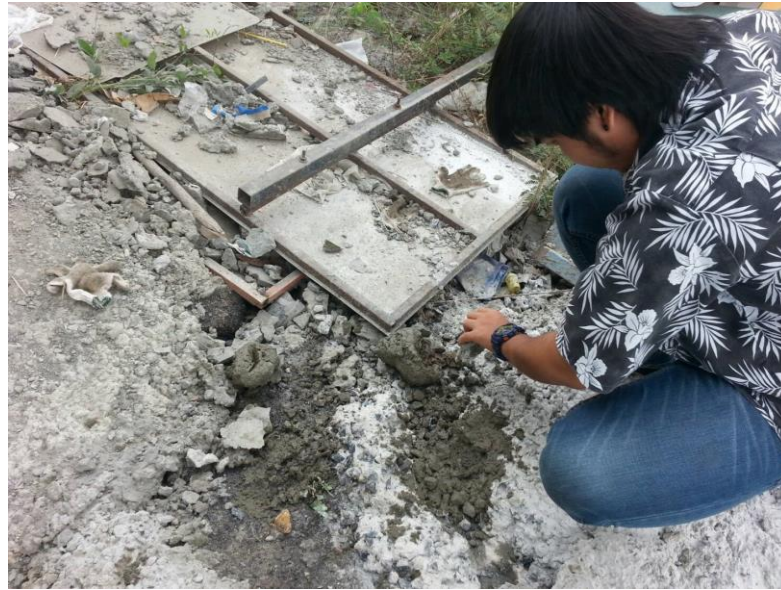
รูปที่ ก.1 ปัญหาคอนกรีตไม่ได้คุณภาพ