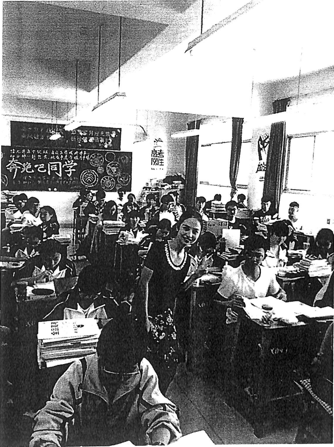
ภาพประกอบที่ 1 เก็บข้อมูลในห้องเรียน