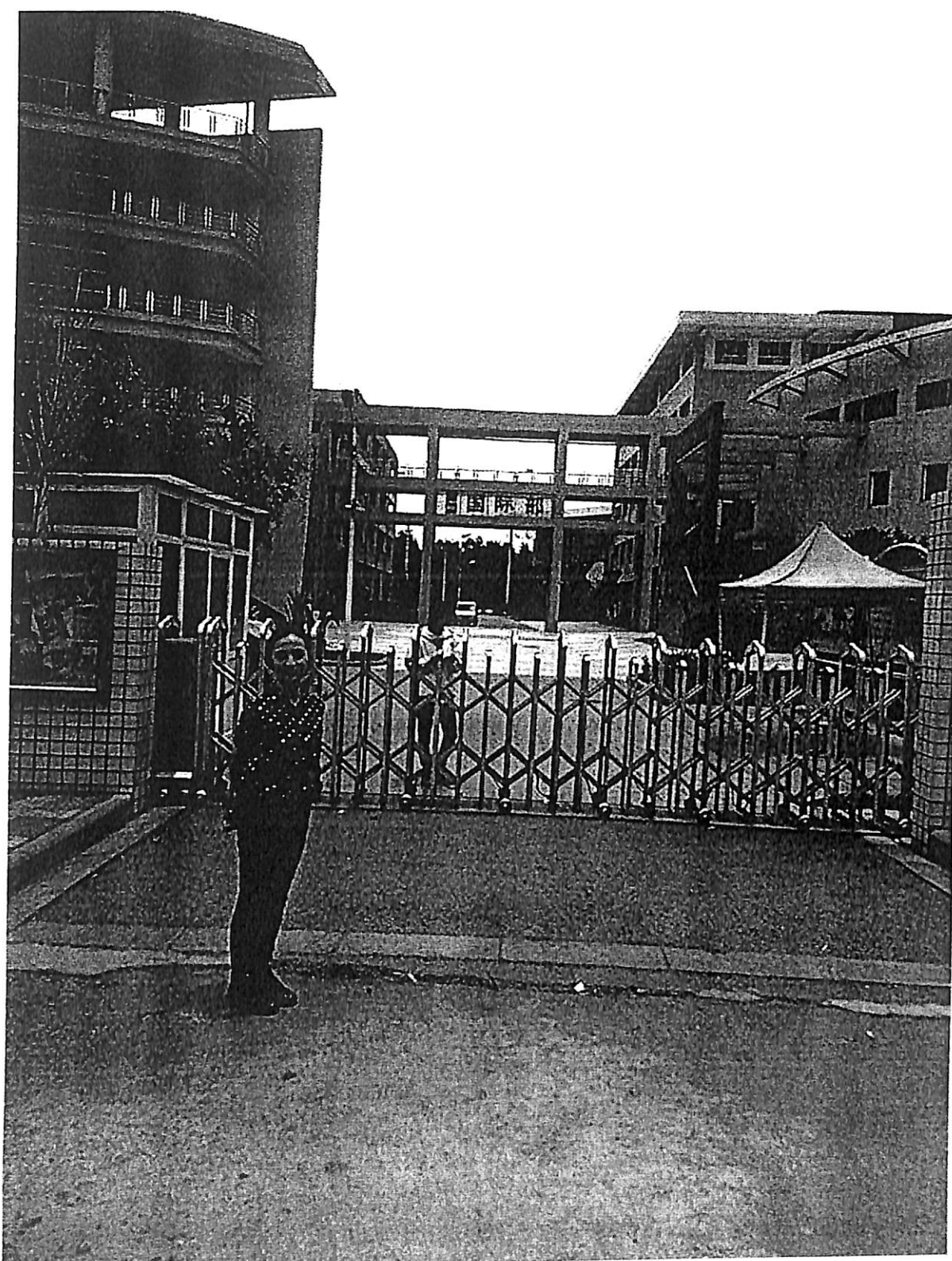
ภาพประกอบที่ 5 บรรยากาศหน้าประตูแผนกนานาชาติของโรงเรียน