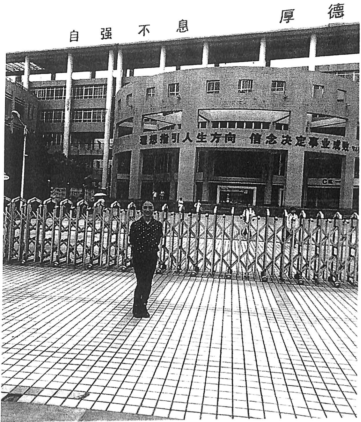
ภาพประกอบที่ 2 บรรยากาศหน้าประตูโรงเรียน