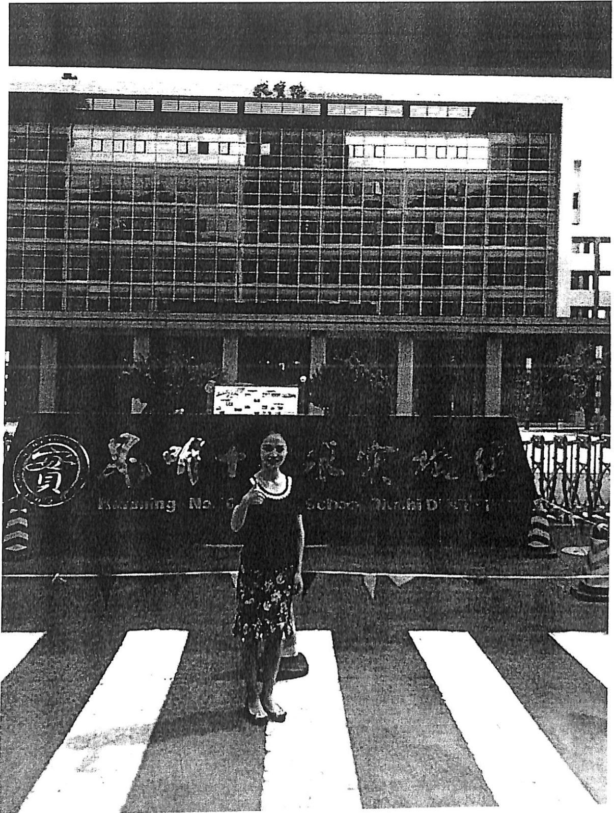
ภาพประกอบที่ 4 บรรยากาศหน้าประตูโรงเรียน