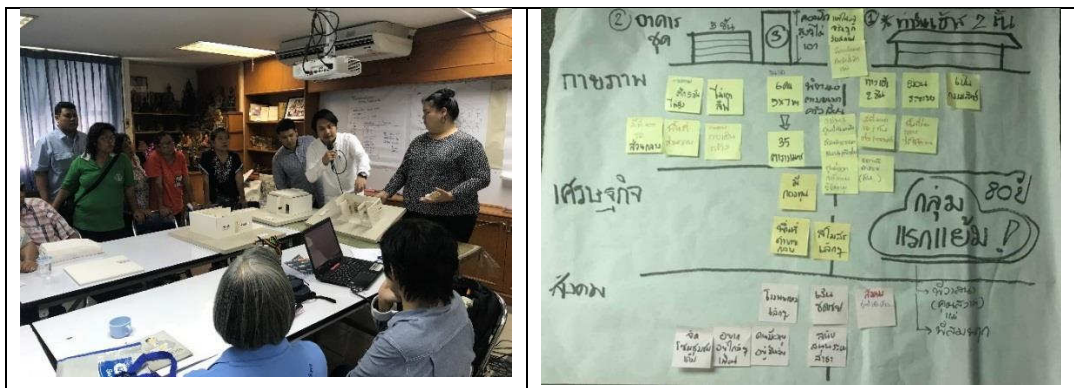
ภาพที่ 2 กิจกรรมการสร้างการออกแบบครอบคลุม (inclusive design) ร่วมกับผู้มีส่วนได้เสียในชุมชน