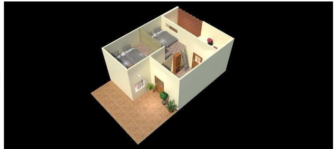
ภาพที่ 3 ผลลัพธ์และข้อเสนอบางส่วนจากกระบวนการออกแบบครอบคลุม