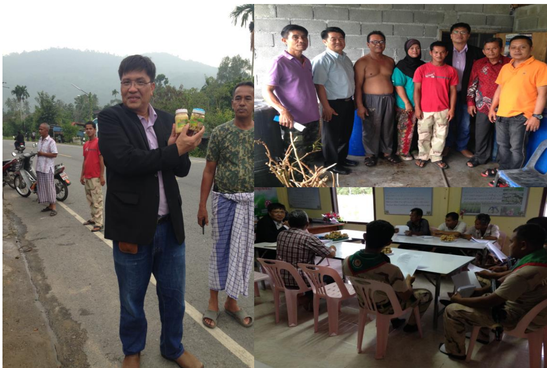
ภาพประกอบที่ 23 การสังเกตและการสนทนากลุ่มผู้รู้ในเขตพื้นที่องค์การบริหารส่วนตำบลกาลอ