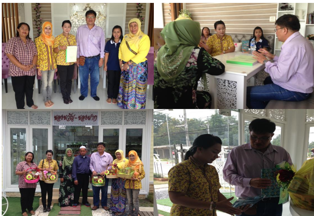
ภาพประกอบที่ 25 การสังเกตและการสนทนากลุ่มผู้รู้ในเขตพื้นที่องค์กรบริหารส่วนตำบลยะตะะ

ผลการวิธีการสังเกตและการสนทนากลุ่ม (15 กันยายน 2558) พบว่า