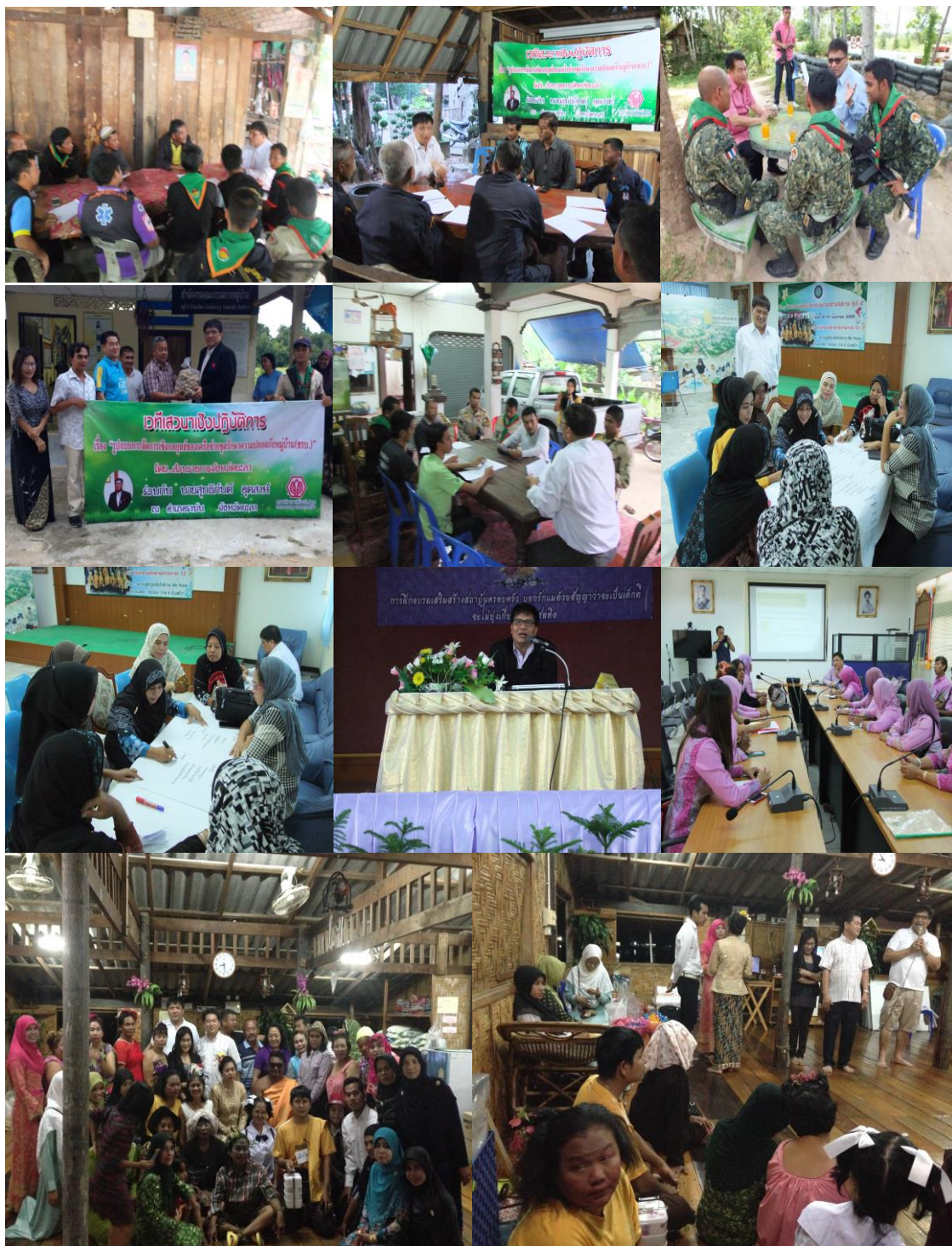
ภาพประกอบที่ 16 ศึกษาสถานการณ์จริงในพื้นที่ทั้งในพื้นที่เขตเมืองและพื้นที่เขตชนบทด้วยการลงพื้นที่ภาคสนาม โดยใช้วิธีการสังเกตและการสนทนากลุ่มเกี่ยวกับสถานการณ์ปัญหาของการจัดการเชิงกลยุทธ์ของเครือข่ายชุดรักษาความปลอดภัยหมู่บ้าน (ชรบ.)