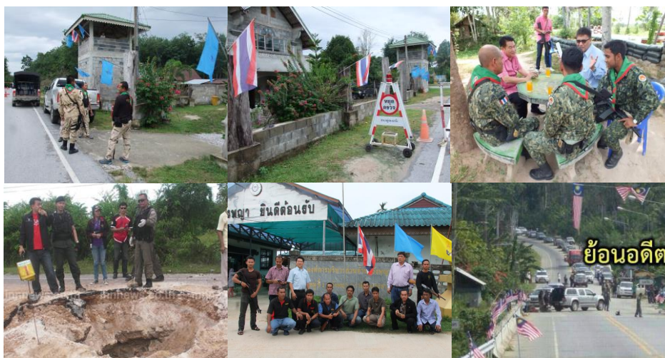
ภาพประกอบที่ 13 การปฏิบัติงานของอาสาสมัครชุดรักษาความปลอดภัยหมู่บ้าน (ชรบ.) ร่วมกับเจ้าหน้าที่ภาครัฐในการออกตรวจในพื้นที่รับผิดชอบ

บริเวณงาน โดยระหว่างการตรวจค้นรถ และบุคคล พบรถจักรยานยนต์ผู้ต้องหาผ่านมายังจุดตรวจ จุดสกัด และอาสาสมัครชุดรักษาความปลอดภัยหมู่บ้าน (ชรบ.) สังเกตเห็นชายที่นั่งซ้อนท้ายมีอาการ เป็นพิรุณจึงได้ร้องบอกให้หยุดตรวจพร้อมกับส่งสัญญาณไฟฉายให้ อาสาสมัครชุดรักษาความปลอดภัยหมู่บ้าน (ชรบ.) คนอื่นเรียกรถคันดังกล่าวให้หยุดเพื่อขอทำการตรวจค้น ชายคนที่ซ้อนท้ายรถจักรยานยนต์คันดังกล่าว ได้กระโดดลงจากรถจักรยานยนต์ เจ้าหน้าที่ตำรวจพร้อมอาสาสมัคร ชุดรักษาความปลอดภัยหมู่บ้าน (ชรบ.) จึงได้เดินเข้าประชิดและได้สั่งให้ยกมือขึ้น ชายดังกล่าวได้พยายามขัดขืน จึงได้ควบคุมตัวและนำส่งพนักงานสอบสวนรามัน ดำเนินคดีตามกฎหมาย