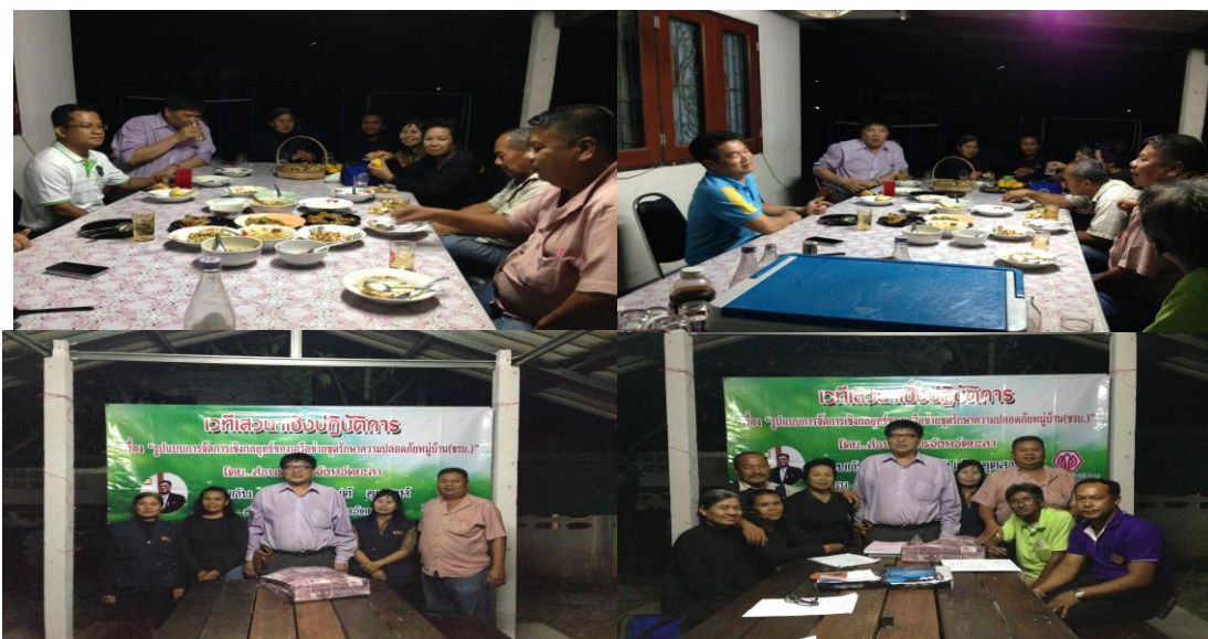
ภาพประกอบที่ 22 การสังเกตและการสนทนากลุ่มผู้รู้ในเขตพื้นที่ องค์การบริหารส่วนตำบลอาซ่อง

ผลการวิธีการสังเกตและการสนทนากลุ่ม (10 กันยายน 2558)พบว่า