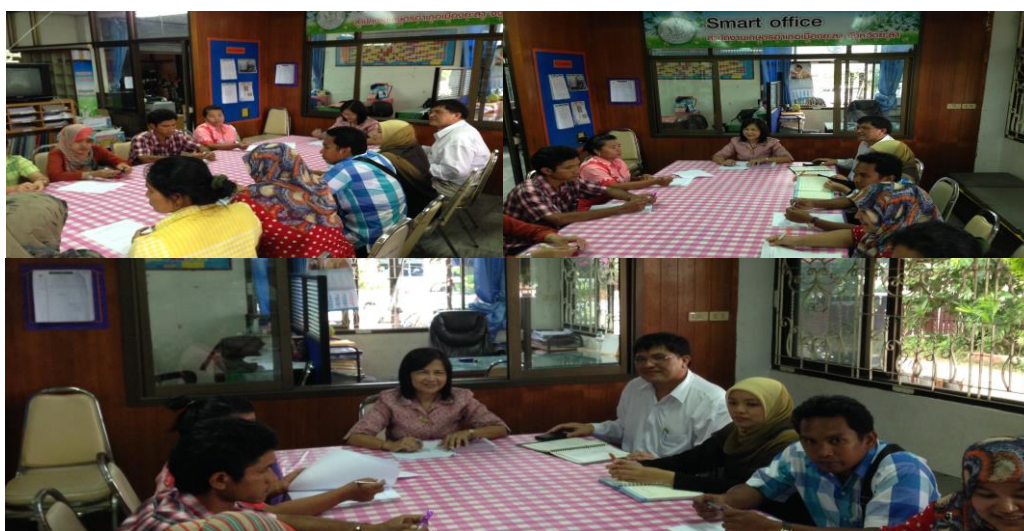
ภาพประกอบที่ 32 การสังเกตและการสนทนากลุ่มผู้รู้ในเขตพื้นที่องค์การบริหารส่วนตำบลกอต้ออีระ