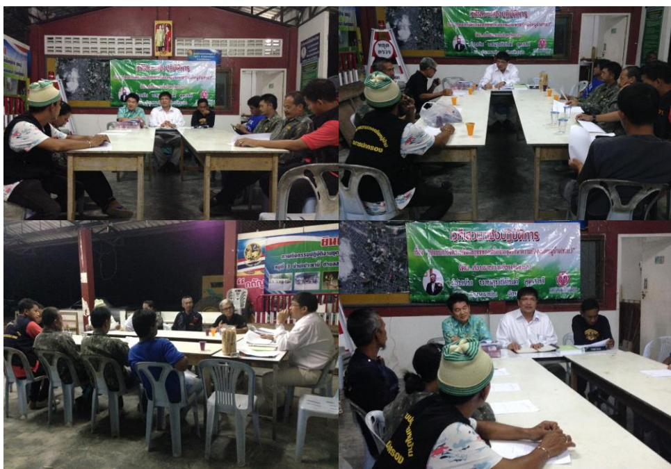
ภาพประกอบที่ 18 การสังเกตและการสนทนากลุ่มผู้รู้ ในเขตพื้นที่ องค์การบริหารส่วนตำบลบางไผ่