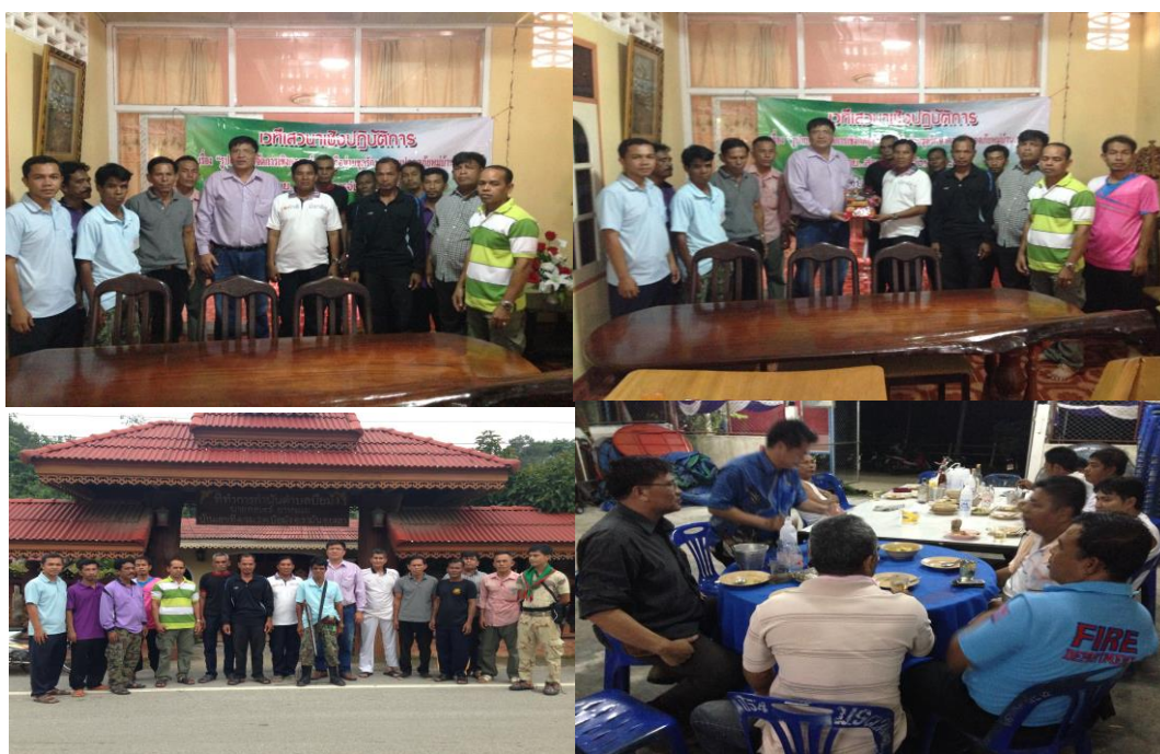
ภาพประกอบที่ 24 การสังเกตและการสนทนากลุ่มผู้รู้ในเขตพื้นที่องค์การบริหารส่วนตำบลป้อมมัง