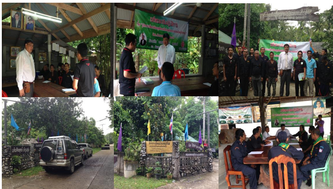
ภาพประกอบที่ 31 การสังเกตและการสนทนากลุ่มผู้รู้ในเขตพื้นที่องค์การบริหารส่วนตำบลตะโละพะลอ