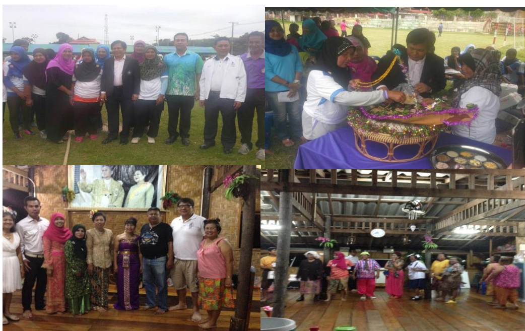
ภาพประกอบที่ 29 การสังเกตและการสนทนากลุ่มผู้รู้ในเขตพื้นที่องค์การบริหารส่วนตำบลกะรอ

ผลการวิธีการสังเกตและการสนทนากลุ่ม (20 กันยายน 2558) พบว่า