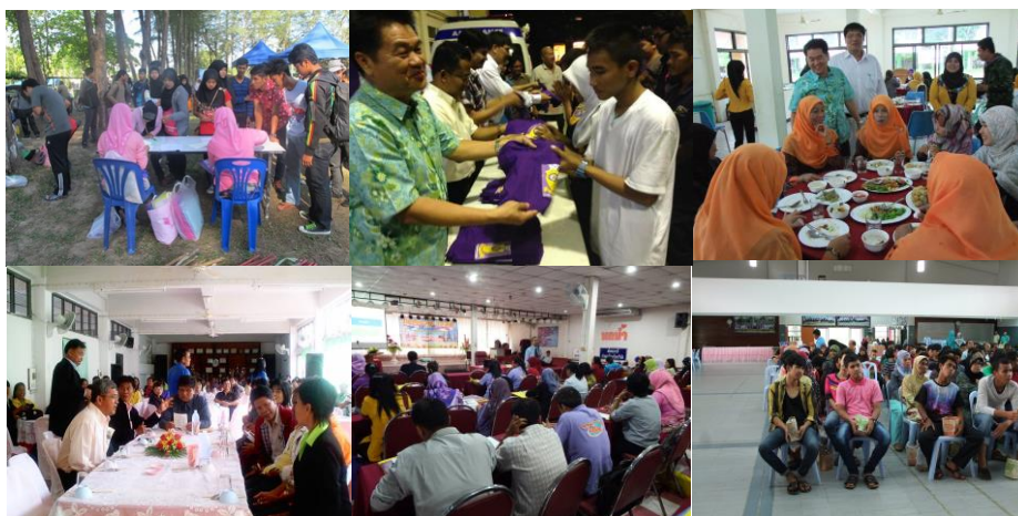
ภาพประกอบที่ 14 การรวมกลุ่มการปฏิบัติต่อกันของคนในสังคม

3. การรวมกลุ่มการปฏิบัติต่อกันของคนในสังคม จัดกิจกรรมร่วมกันในทุกด้านแลกเปลี่ยนความคิดเห็นเพื่อให้เกิดความร่วมมือ มีส่วนร่วมในการปฏิบัติงานของเจ้าหน้าที่รัฐ โดยยึดหลักศรัทธา และหลักปฏิบัติที่ “ต้องทำ” และ “อยากทำ” ทำให้การปฏิบัติงานช่วยสร้างความสงบ ความขัดแย้งลดลง ทุกอย่างสงบ โดยใช้ระยะเวลาที่สั้นที่สุดประโยชน์เกิดกับประชาชนไม่เลือกปฏิบัติ คลายความระแวง นำไปสู่ความไว้วางใจของประชาชน โดยเชิญหัวหน้าหน่วยงานระดับสูงของประเทศเช่น รัฐมนตรีว่าการกระทรวงมหาดไทย กระทรวงศึกษาธิการ ผู้นำเหล่าทัพ ผู้นำศาสนา ผู้ว่าราชการจังหวัด ผู้นำท้องถิ่น นักการเมือง ประชาชนในพื้นที่ และส่วนราชการต่างๆ สนับสนุนทั้งในส่วนกลางและในเขตพื้นที่อำเภอรามัน มาร่วมงานในกิจกรรมต่างๆ เพื่อสร้างความเข้าใจกำหนดรูปแบบการปฏิบัติงานร่วมกัน