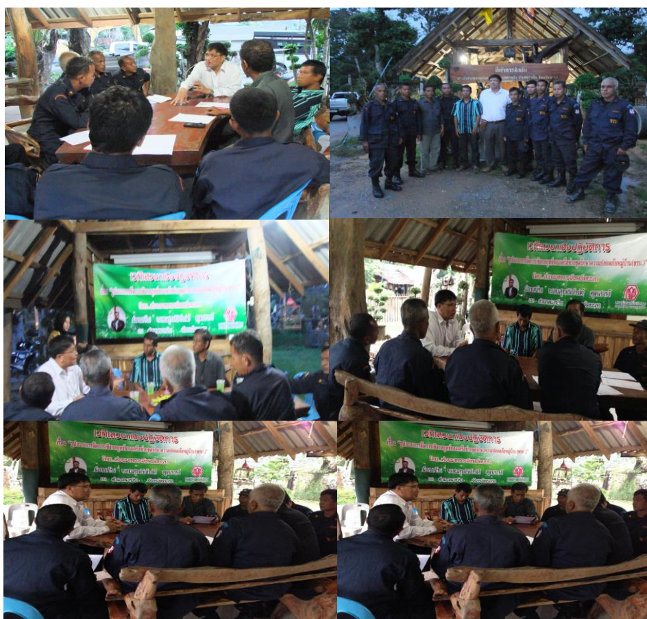
ภาพประกอบที่ 27 การสังเกตและการสนทนากลุ่มผู้รู้ในเขตพื้นที่องค์กรบริหารส่วนตำบลกาตูบั้ง