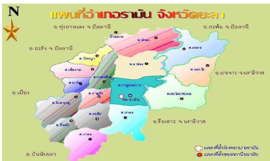
ภาพประกอบที่ 12 แผนที่อำเภอรามัน จังหวัดยะลา

อำเภอรามันตั้งอยู่บนจรูญวิถี ตำบลยุบอเกาะ ห่างจากจังหวัดโดยทางรถยนต์ 26 กิโลเมตร และทางรถไฟ 18 กิโลเมตร ตั้งอยู่ทางทิศตะวันออกของจังหวัดยะลา มีเนื้อที่ประมาณ 516.031 ตารางกิโลเมตร หรือ 322,519.37 ไร่ สภาพพื้นที่โดยทั่วไปเป็นที่ราบลุ่มมีภูเขาและเนินเขาสูงล้อมรอบโดยมีภูเขาที่สำคัญดังนี้ เทือกเขาตะโลละเกาะกั้นเขตกับอำเภอเมืองยะลา เทือกเขาสันกาลาศรีกั้นเขตกับอำเภอบันนังสตา และเทือกเขาบูโดกั้นเขตกับอำเภอบาเจาะ อำเภอเรือเสาะ จังหวัดนราธิวาส มีแม่น้ำสายบุรีไหลผ่านอำเภอ ระยะทางประมาณ 7 กิโลเมตร ลักษณะพื้นที่เป็นที่ราบขนาดใหญ่ล้อมรอบด้วยแนวเขา ทำให้เป็นพื้นที่ที่เหมาะสมในการทำเกษตรกรรม สภาพพื้นที่ป่าต้นน้ำลำธารอยู่ในสภาพที่ค่อนข้างสมบูรณ์มากมีน้ำตกหลายแห่งที่สามารถพัฒนาเป็นแหล่งท่องเที่ยวได้ในอนาคต ระบบการคมนาคมในพื้นที่ได้มาตรฐานเชื่อมต่อทั้งในหมู่บ้าน ตำบลกับอำเภอ หรืออำเภอกับจังหวัด มีประชากรทั้งหมดประมาณ 76,362 คน แยกเป็นชาย 39,052 คน หญิง 40,291 คน จำนวนบ้านเรือน 14,931 หลังคาเรือน ความหนาแน่นของประชากรต่อพื้นที่ 150.68 คนต่อตารางกิโลเมตร