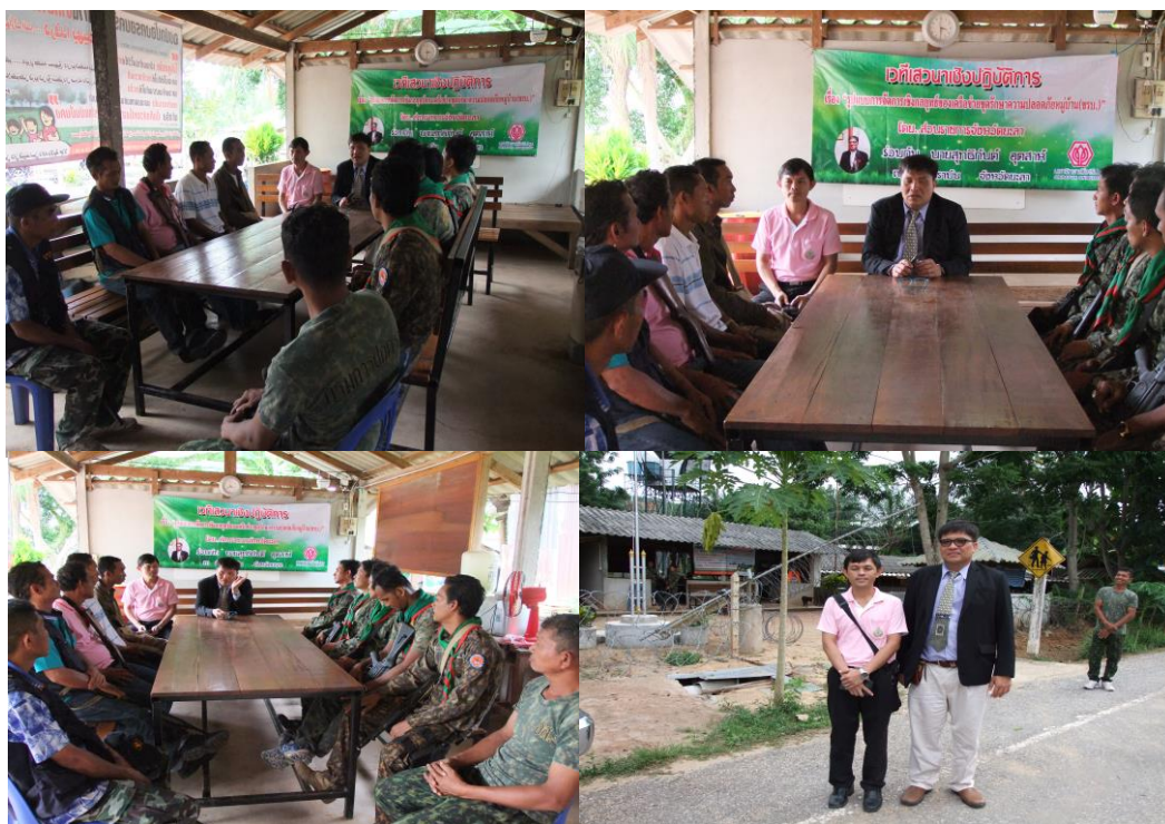
ภาพประกอบที่ 21 การสังเกตและการสนทนากลุ่มผู้รู้ในเขตพื้นที่องค์การบริหารส่วนตำบลท่าธง