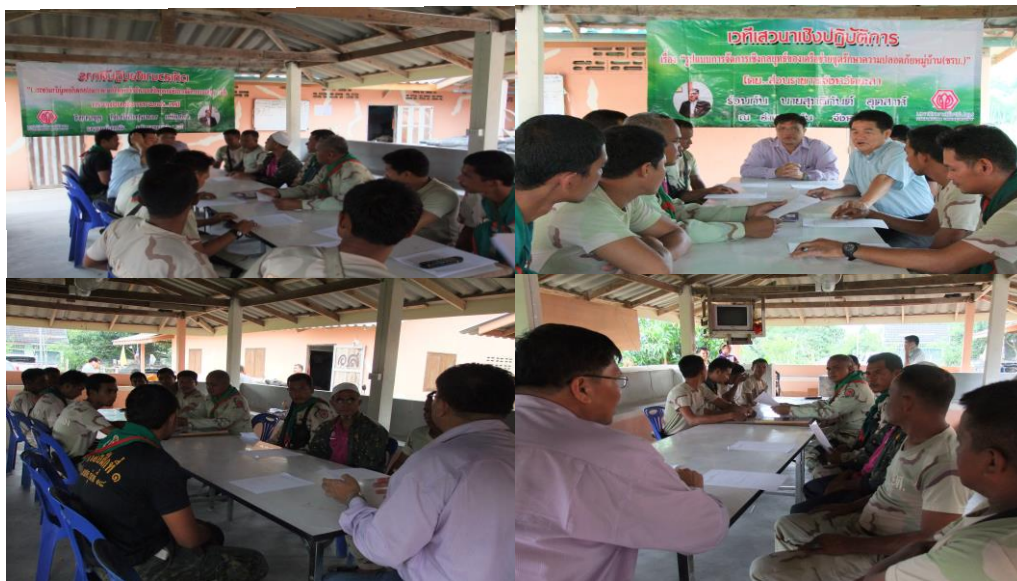
ภาพประกอบที่ 17 การสังเกตและการสนทนากลุ่มผู้รู้ ในเขตพื้นที่ องค์การบริหารส่วนตำบลเนินงาม