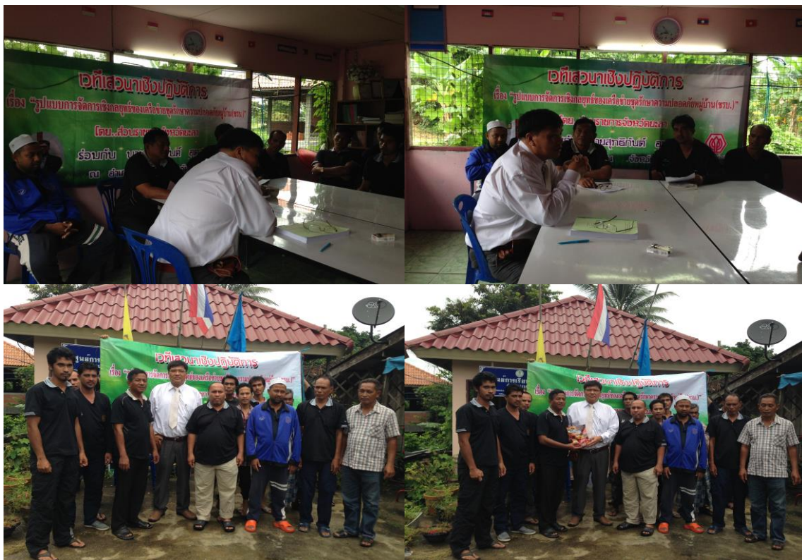
ภาพประกอบที่ 26 การสังเกตและการสนทนากลุ่มผู้รู้ในเขตพื้นที่องค์การบริหารส่วนตำบล