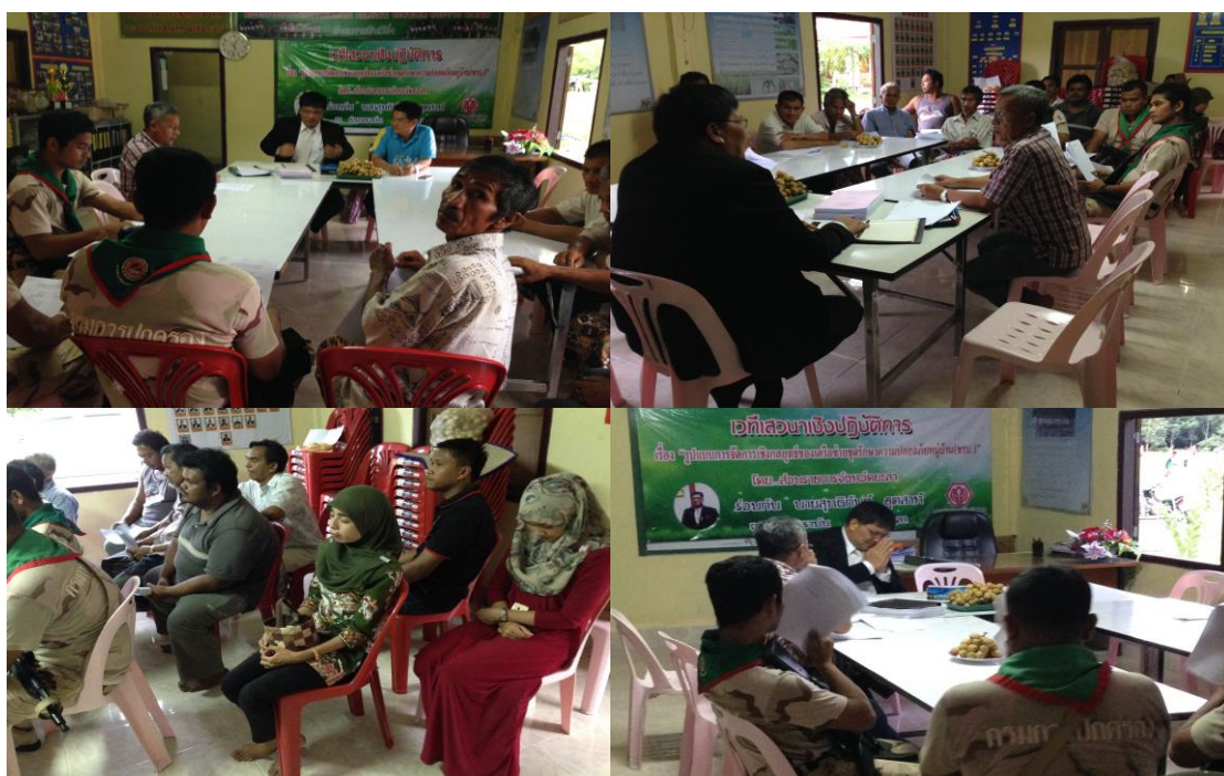
ภาพประกอบที่ 19 การสังเกตและการสนทนากลุ่มผู้รู้ ในเขตพื้นที่เทศบาลตำบลโกตาบารู