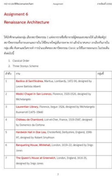
รูปที่ 2 ใบงาน Assignment 6 Renaissance Architecture