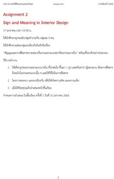
รูปที่ 1 ใบงาน Assignment 2 Sign and Meaning in Interior Design

ตัวอย่างเช่น กิจกรรมในชั้นเรียน Assignment 2 Sign and Meaning in Interior Design (รูปที่ 1) และ Assignment 6 Renaissance Architecture (รูปที่ 2 และ 3) เป็นกิจกรรมที่ให้นักศึกษารวมกลุ่มกันศึกษาค้นคว้าข้อมูล และรวมกลุ่มกันอภิปรายถกเถียง เกี่ยวกับแนวคิดในการออกแบบในประวัติศาสตร์ของสถาปัตยกรรมตะวันตก และวิธีการวิเคราะห์การออกแบบสถาปัตยกรรมตามทฤษฎีการออกแบบที่ใช้ในประวัติศาสตร์ หลังจากนั้นจึงนำเสนอข้อสรุป และความคิดรวบยอดที่ได้จากการศึกษา