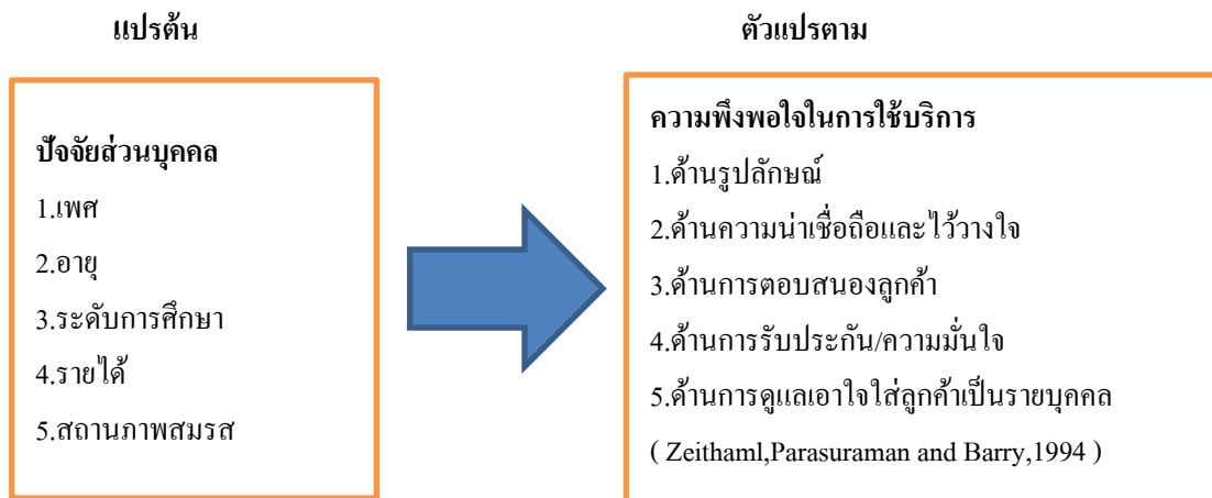
แผนภาพที่ 1 กรอบแนวคิดในการวิจัย