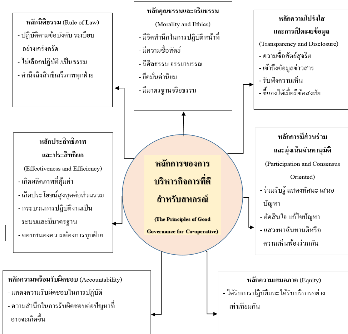
ภาพประกอบที่ 5.5 หลักสหวิบาลเพื่อการบริหารกิจการที่ดีสำหรับสหกรณ์ (Co-operative Good Governance: CGG)