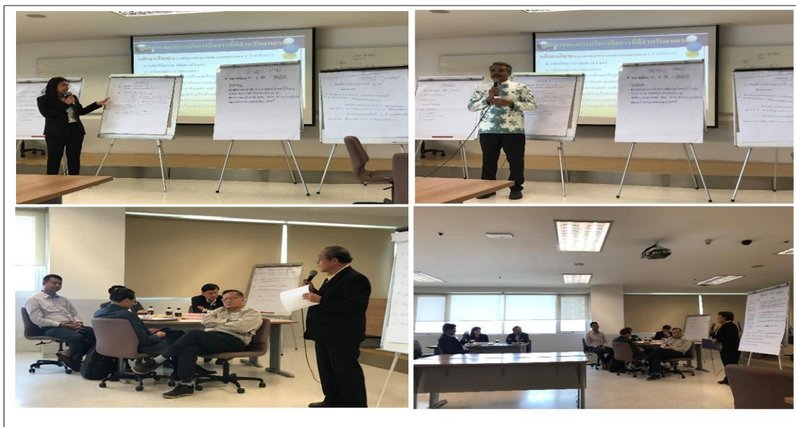
ภาพประกอบที่ 5.3 การนำเสนอมติของแต่ละกลุ่มผสม

ช่วงที่ 2 การจัดทำ Co-Design กลุ่มผสม ใช้เวลาประมาณ 2 ชั่วโมง มีการดำเนินการเช่นเดียวกับกลุ่มเฉพาะ และมีการนำเสนอมติของแต่ละกลุ่มผสม (ดูภาพที่ 5.3 การนำเสนอมติของแต่ละกลุ่มผสม)