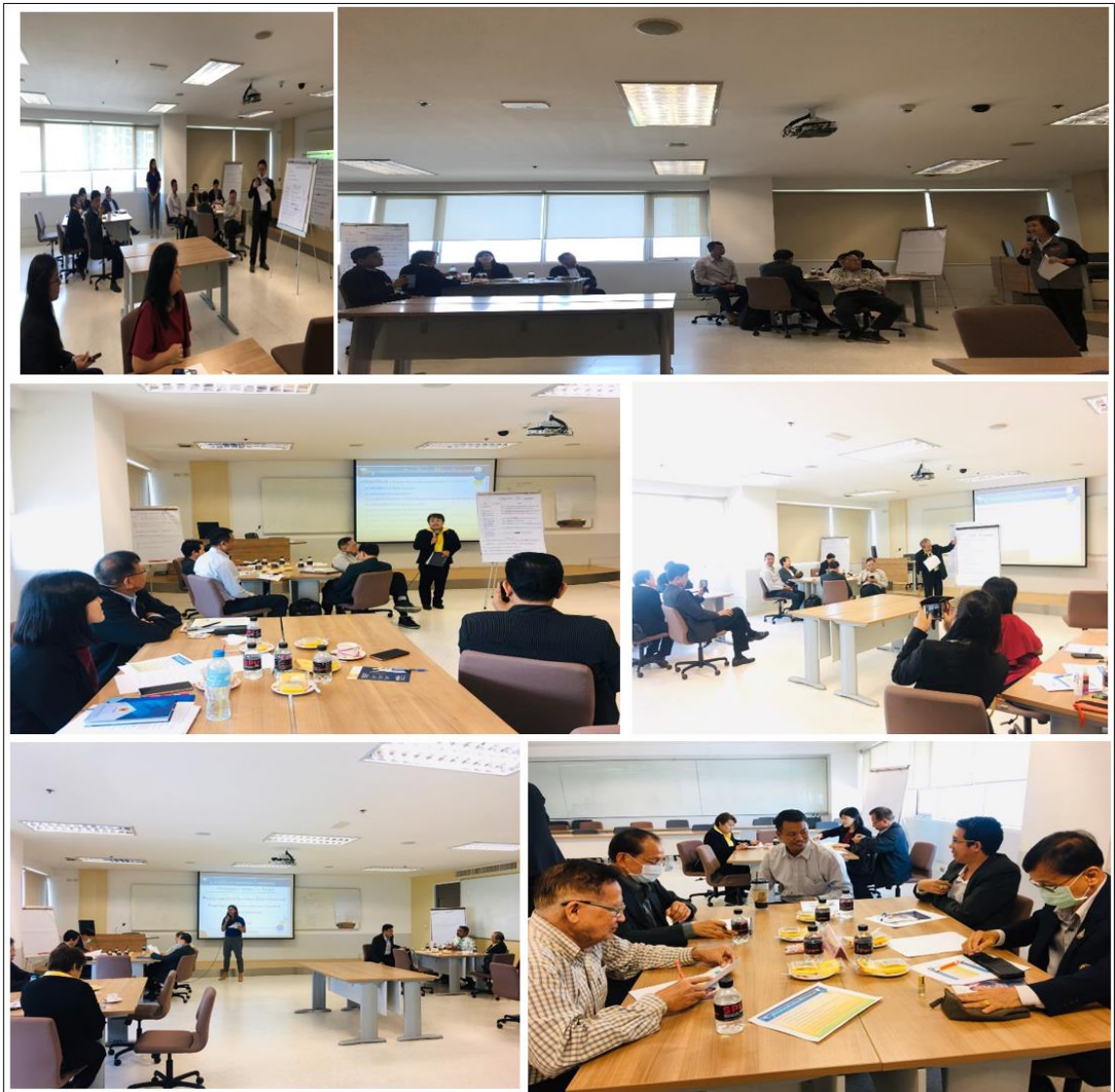
ภาพประกอบที่ 5.1 การจัดสถานที่กลุ่มเฉพาะ 4 กลุ่ม

(3) การจัดเตรียมอุปกรณ์ที่ใช้ในการจัดทำ Co-Design