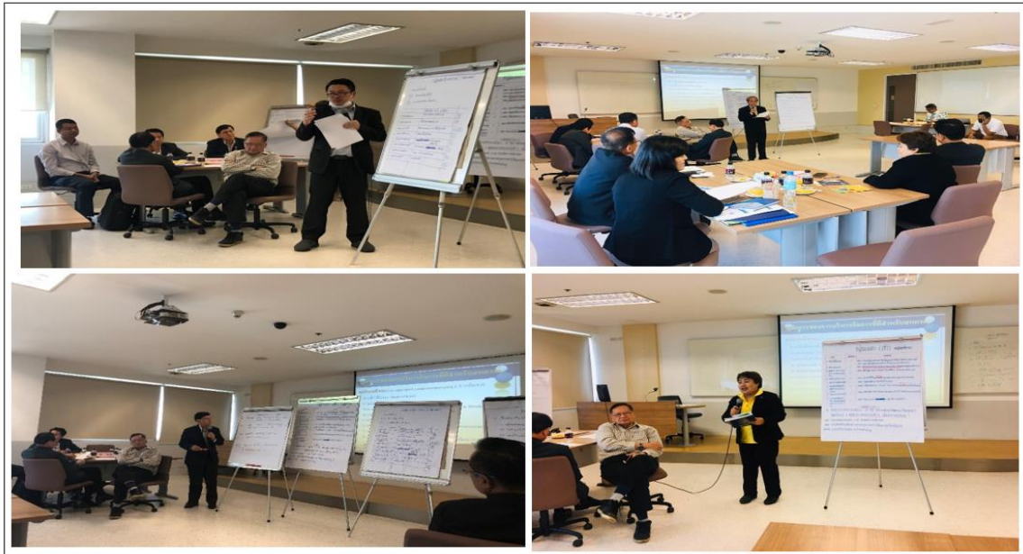
ภาพประกอบที่ 5.2 การนำเสนอของกลุ่มเฉพาะ 4 กลุ่ม

ช่วงที่ 2 การจัดทำ Co-Design กลุ่มผสม ใช้เวลาประมาณ 2 ชั่วโมง มีการดำเนินการเช่นเดียวกับกลุ่มเฉพาะ และมีการนำเสนอมติของแต่ละกลุ่มผสม (ดูภาพที่ 5.3 การนำเสนอมติของแต่ละกลุ่มผสม)