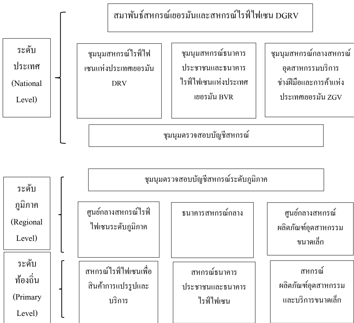
ภาพประกอบที่ 2.2 โครงสร้างการจํอองค์กรของสหกรณ์ในสหพันธ์สาธารณรัฐเยอรมนี

และรับผิดชอบดูแลเรื่องต่าง ๆ ที่เกี่ยวข้องกับองค์กรสหกรณ์ทั้งหมดทั้งด้านเศรษฐกิจ กฎหมายข้อ บังคับสหกรณ์ นโยบายการเงินภาครัฐ รวมถึงการพัฒนาบุคลากร