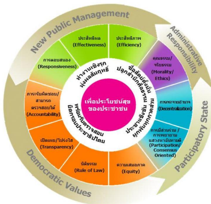
ภาพประกอบที่ 2.3 แบบภาพแสดงหลักธรรมาภิบาลของการบริหารกิจการบ้านเมืองที่ดี (CG Framework)