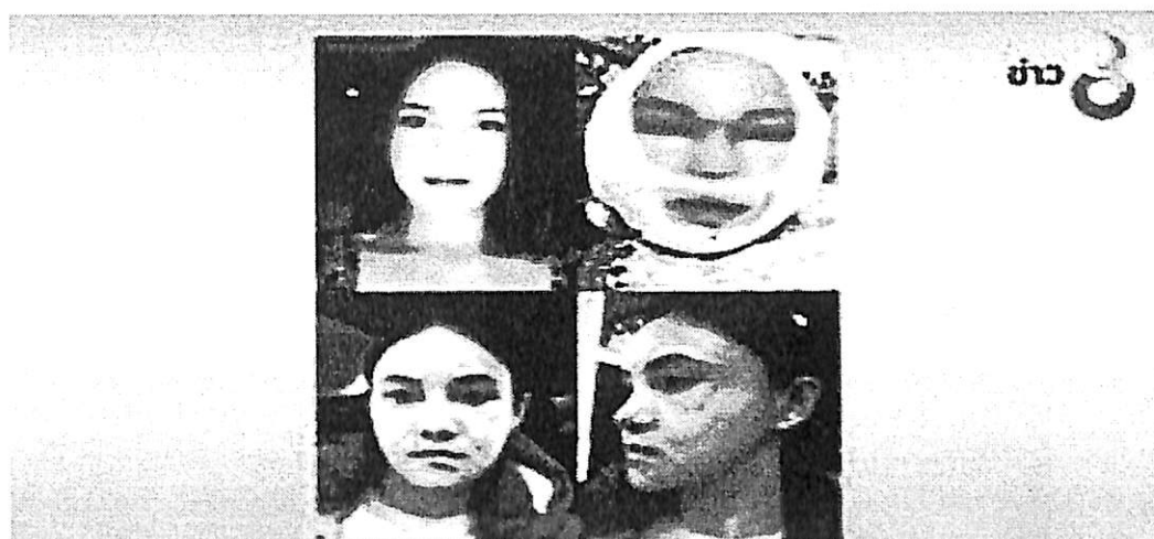
ภาพตัวอย่างการทำศัลยกรรมตกแต่งแล้วเกิดปัญหา 38

ปอดซึ่งจะทำให้เกิดอันตรายถึงชีวิตได้ 37 ในการให้ข้อมูลแก่ผู้รับบริการเรื่องความปลอดภัยจึงเป็นสิ่งสำคัญ เพื่อให้ผู้รับบริการได้รับทราบและปฏิบัติตนได้ถูกต้องก่อนการผ่าตัด นอกจากนี้แพทย์ผู้ให้บริการก็ต้องมีความรู้และประสบการณ์ในการทำหัตถการหรือผ่าตัดนั้นๆ เป็นอย่างดี เพื่อลดการเกิดผลไม่พึงประสงค์ของการผ่าตัด และสุดท้ายสถานที่ผ่าตัดต้องมีความปลอดภัยตามมาตรฐานของราชการหรือองค์กรที่เกี่ยวข้อง รวมถึงอุปกรณ์ที่ใช้ต้องได้มาตรฐาน และบุคลากรที่ช่วยเหลือในขณะผ่าตัดควรได้รับการอบรมมาเป็นอย่างดี ทั้งหมดนี้เพื่อความปลอดภัยของผู้รับบริการซึ่งถือเป็นหัวใจอันสำคัญยิ่งในการให้บริการทางศัลยกรรมความงามในปัจจุบัน