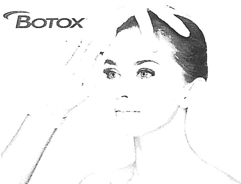
ภาพการฉีดโบท็อกซ์ เพื่อลดริ้วรอยเหี่ยวย่นบนใบหน้า 9