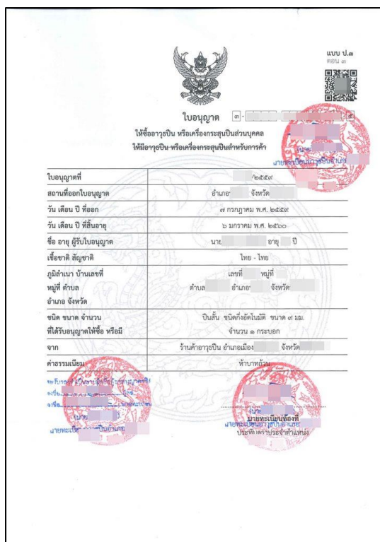
ภาพที่ 3 ตัวอย่างใบอนุญาตให้ชื่ออารุณปืนหรือเครื่องกระสุนส่วนบุคคล (ป.๓)