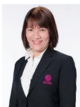
บทความโดย: ผู้ช่วยศาสตราจารย์ วรณี งามขจรกุลกิจ

http://www.saisawankhayanying.com/s-report/technical-communication/