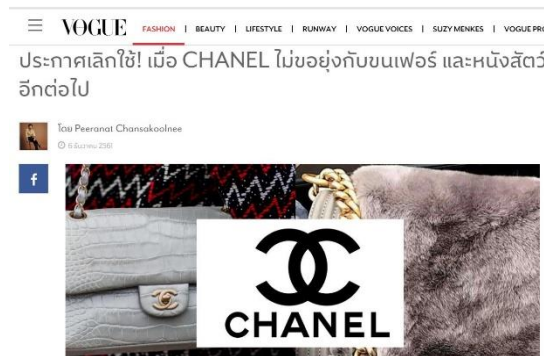
รูปภาพประกอบ 6 : ชาแนลประกาศไม่ขอยุ่งกับขนเฟอร์และหนังสัตว์อีกต่อไป

แต่ถึงอย่างไรก็ตามการต่อต้านและขับเคลื่อนทางสังคมแบบใหม่สามารถลดการสูญพันธุ์ของสัตว์ได้เป็นจำนวนมาก แต่ก็เชื่อว่าจะมีการยุติการผลิตที่ทำมาจากอวัยวะส่วนต่างๆของสัตว์อย่างถาวร ทำให้ตรงกับโมเดลที่กล่าวมาข้างต้นในเรื่องของ การขับเคลื่อนทางสังคมมักจะบรรลุตามวัตถุประสงค์หรือไม่ก็ตาม แต่จะมายุติตรงล้มเลิก หรือขึ้นของ Decline