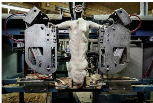
รูปภาพประกอบ 1 : เครื่องจักรกลฆ่าสัตว์

การที่เครื่องจักรกลทำการผลิตอัตโนมัติอย่างต่อเนื่องหมายความว่า การผลิตต้องจัดสรรวัตถุดิบให้ได้เรื่อยๆ โดยเฉพาะในปัจจุบันที่มนุษย์มีค่านิยมและความเชื่อแปลกๆเกี่ยวกับการนำอวัยวะภายนอก โดยเฉพาะหนังสัตว์มาใช้เป็นวัตถุดิบเพื่อยกระดับฐานะ สร้างบุคลิกภาพ และสร้างอำนาจ รวมถึงความสวยความงามให้แก่ตนเอง เช่น กระเป๋าที่ทำจากหนังจระเข้ งามประดับบ้าน พรมปูพื้นหนังหมีขาว พฤติกรรมครานี้ของคนบางกลุ่มบางบริษัท หรือบางอุตสาหกรรมการผลิต เห็นแก่รายได้ ผลประกอบการ เอาตนเองเป็นที่ตั้ง โดยไม่ได้อุทิศถึงผลที่ตามมาจากการกระทำ