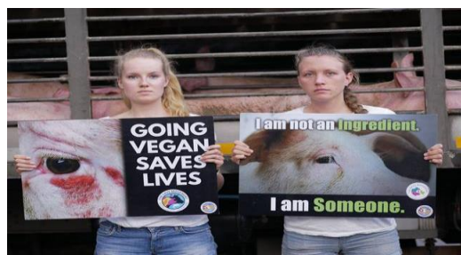
รูปภาพประกอบ 5 :ต่อต้านการฆ่าหมูเพื่อนำมาเป็นวัตถุดิบ