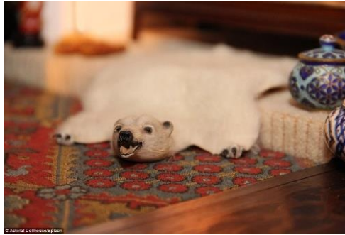
รูปภาพประกอบ 2 : พรมปูพื้นหนังหมีขาว