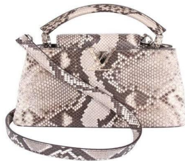
รูปภาพประกอบ 3 : กระเป๋าแบรนด์เนมทำมาจากหนังงูเห่า