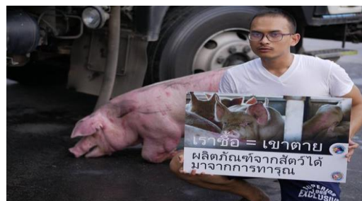
รูปภาพประกอบ 7 : ประโยคที่สะท้อนถึงการกระทำ