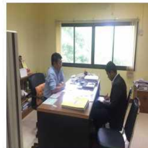
ทต.อัมพวา