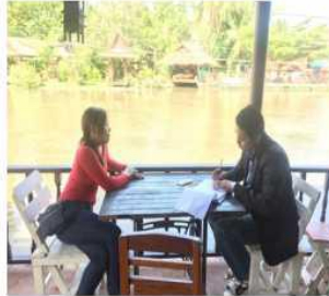
โฮมสเตย์