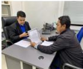
เจ้าของโรงแรม