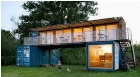
ตู้คอนเทนเนอร์