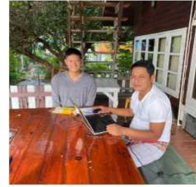
ฟาร์มสเตย์