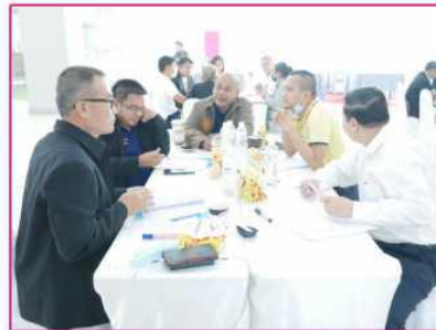
การมีส่วนร่วมออกแบบ-ร่วมออกแบบ