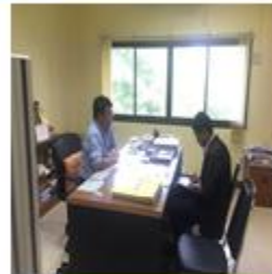
ทศ.อัมพวา