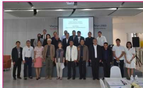
ผู้เข้าร่วมการCo-Design