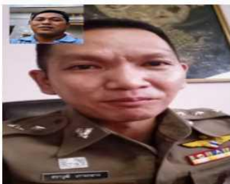
ดร.ท่องเที่ยว จว.เชียงใหม่