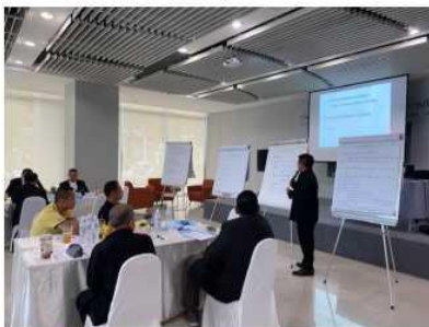
ประชากรกลุ่มนำเสนอ