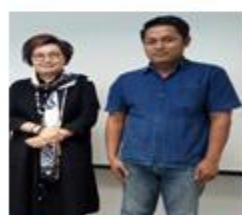
นักวิชาการ

รูปภาพ ภาคผนวก ก. การสัมภาษณ์เชิงลึก (In-Depth Interview)