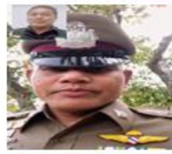
ดร.ปราบปราม อว.พัทลุง