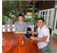
ฟาร์มลเคย์