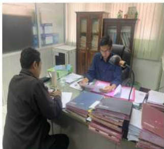
ที่ทำการปกครองอำเภอ