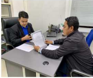
เจ้าของโรงแรม