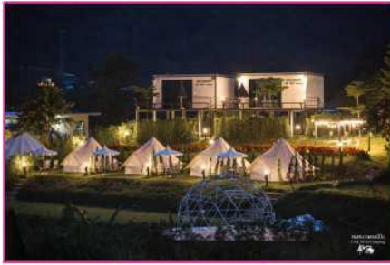
แคมป์-เต็นท์