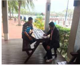
ปช ท่องเที่ยว จว.สมุทรสงคราม