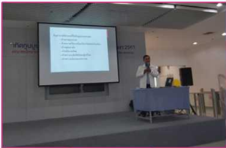
ผู้จ้ยนำเสนอ