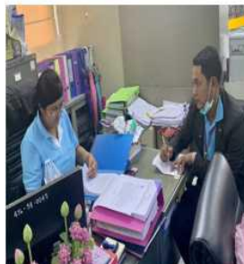
ทต.สามโลก