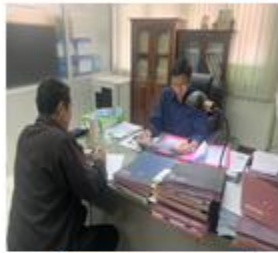
พี่ทำการปกครองอำเภอ