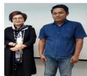
นักวิชาการ