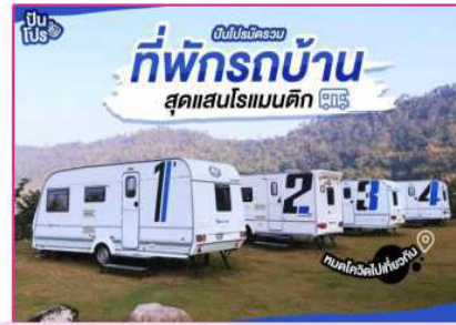
รถนอนให้เช่า