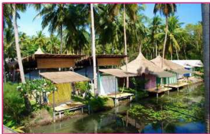
โฮมสเตย์