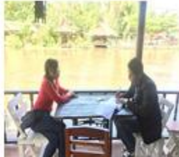
โอมลเคย์