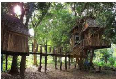
บ้านบนต้นไม้