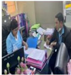
ทศ.สามโลก