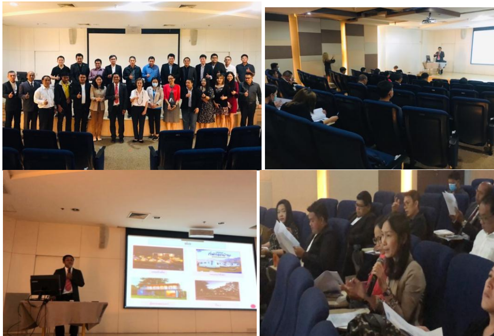
รูปภาพ ภาคผนวก ค. การรับฟังความคิดเห็น (Hearing)