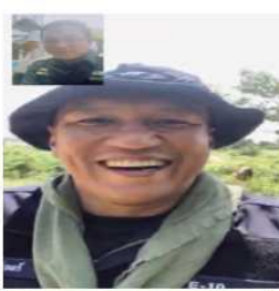
ดร.สืบสวน บข.น.