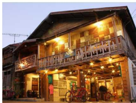
เกสเฮ้าส์

ที่พักแรมที่ไม่อยู่ภายใต้บังคับของกฎหมายว่าด้วยโรงแรมและหอพัก