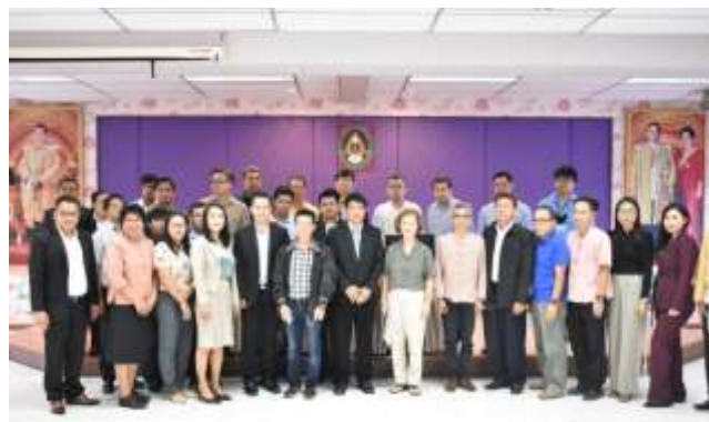
รูป 5.7 การจัดทำ Co- Design