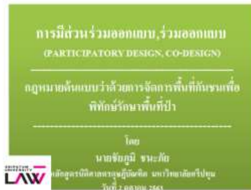
รูป 5.1 การจัดทำ Co- Design