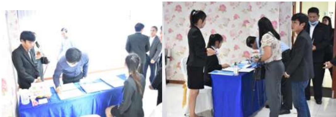
ภาพที่ 5.2 การจัดทำ Co- Design

1) การกำหนดประชากรร่วมออกแบบ เป็นกลุ่มประชากรผู้มีส่วนได้ส่วนเสีย (Stakeholders) ที่เกี่ยวข้องโดยตรงกับพื้นที่กันชน ซึ่งเป็นประชากรกลุ่ม Co-Design รวมทั้งสิ้นจำนวน 16 คน แยกออกเป็น 4 กลุ่ม ประกอบด้วย