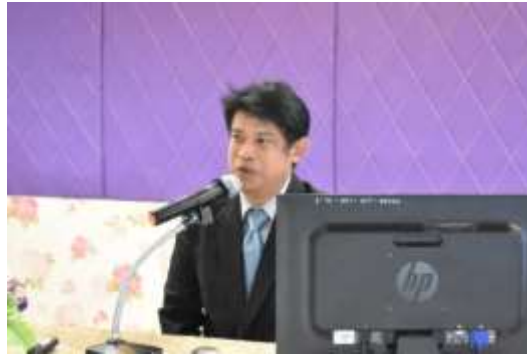
รูป 5.5 การนำเสนอประเด็นในการทำ Co- Design

คำตอบที่ได้มาจากการอภิปรายในกลุ่มเฉพาะแต่ละกลุ่มเมื่อมีการนำเสนอต่อที่ประชุมแล้วถือว่า เป็นการเสร็จสิ้นการดำเนินการมีส่วนร่วมออกแบบของประชากรกลุ่มเฉพาะซึ่งจะเป็นข้อมูลที่การวิจัยได้ นำไปสู่การวิเคราะห์ต่อไป