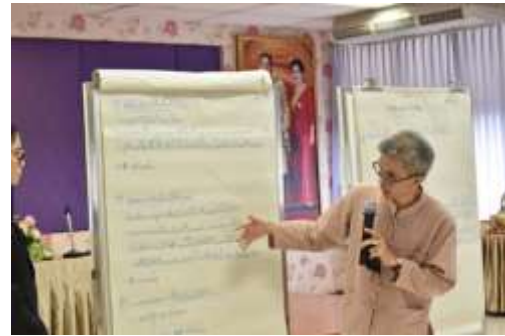
รูป 5.3 การจัดทำ Co- Design

ประชากรกลุ่มผสม คือ ประชากรที่มาจากกลุ่มเฉพาะ แยกมากลุ่มละ 1 คน เพื่อผสมรวม เป็น 4 คน ต่อ 1 กลุ่ม ดังนั้นแต่ละกลุ่มผสม จึงประกอบด้วย เจ้าหน้าที่ท้องถิ่นและเจ้าหน้าที่ท้องถิ่น เจ้าหน้าที่ที่เกี่ยวข้องกับพื้นที่กันชน นักวิชาการและนักกฎหมาย ประชาชนในพื้นที่กันชน