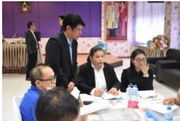
รูป 5.6 การจัดทำ Co- Design

ช่วงบ่าย เป็นการจัดทำ Co-Design กลุ่มผสม การวิจัยใช้เวลาดำเนินการประมาณ 2 ชั่วโมง มี การ ดำเนินการเช่นเดียวกับกลุ่มเฉพาะ