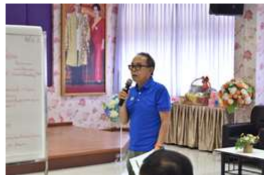
รูป 5.4 การจัดทำ Co- Design