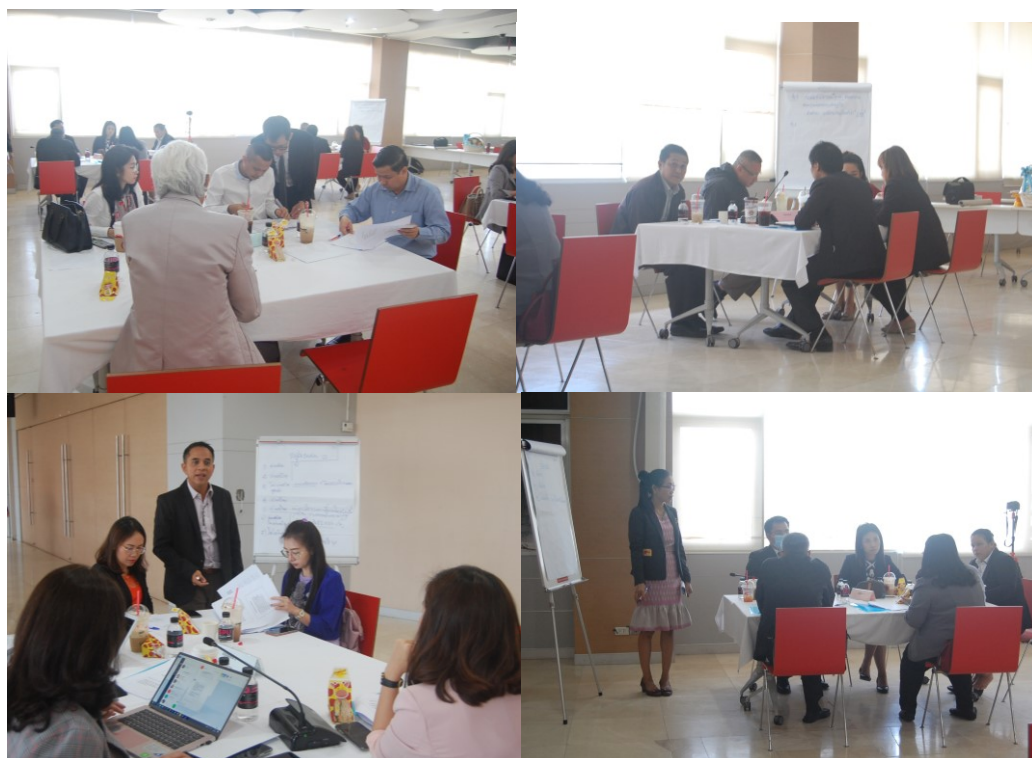
ภาพที่ 5.3 ประชากรกลุ่มผสม

ประชากรกลุ่มผสม หมายถึง ประชากรที่มาจากกลุ่มเฉพาะ แยกมากลุ่มละ 1 คน เพื่อผสมรวมเป็น 4 คน ต่อ 1 กลุ่ม ดังนั้น แต่ละกลุ่มผสม จึงประกอบด้วย หน่วยงานในกระบวนการยุติธรรม หน่วยงานเฉพาะที่เกี่ยวข้องกับการฟอกเงิน เจ้าหน้าที่ของรัฐ นักกฎหมายและนักวิชาการ (ดูภาพที่ 5.3)