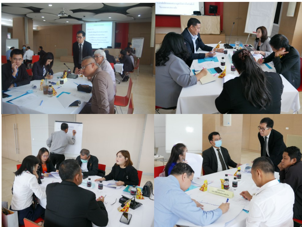
ภาพที่ 5.2 ประชากรกลุ่มเฉพาะ

กลุ่มเฉพาะ 4 กลุ่มนักกฎหมายและนักวิชาการ