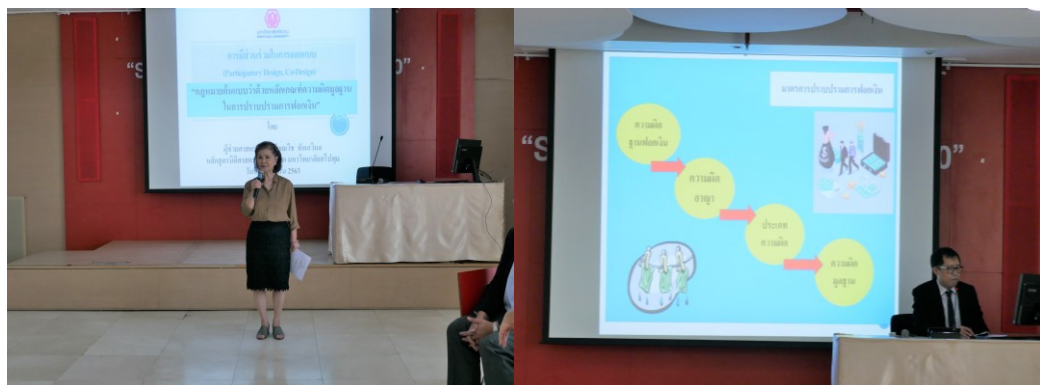
ภาพที่ 5.1 การจัดทำ Co-Design

ประชากรทั้ง 4 กลุ่มนี้ แยกออกเป็นกลุ่มเฉพาะ และกลุ่มผสม