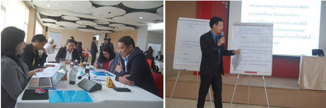
ภาพที่ 5.5 การอภิปรายและการนำเสนอต่อที่ประชุม

ช่วงบ่าย เป็นการจัดทำ Co-Design แบบกลุ่มผสม การวิจัยใช้เวลาดำเนินการประมาณ 2 ชั่วโมง มีการดำเนินการเช่นเดียวกับกลุ่มเฉพาะ