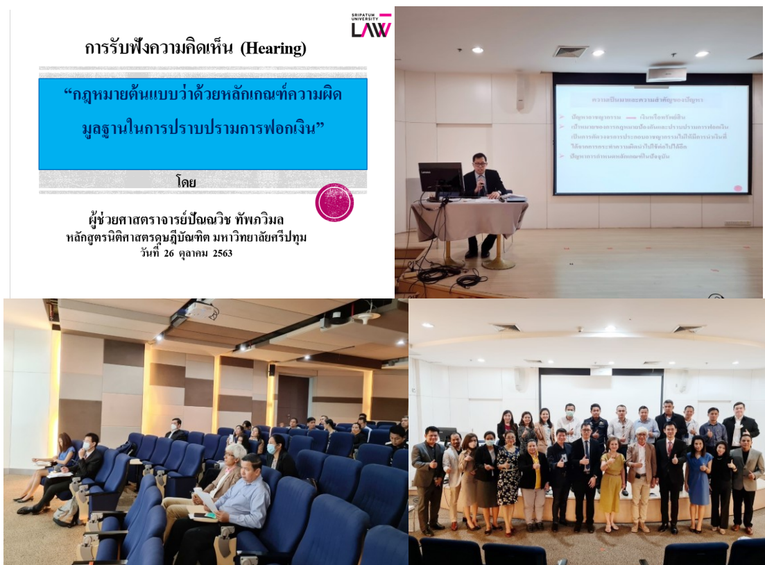
ภาพที่ 5.6 การสัมมนารับฟังความคิดเห็น (Hearing)

การวิจัยนี้ได้จัดทำการสัมมนารับฟังความคิดเห็นเมื่อวันที่ 26 สิงหาคม พ.ศ. 2563 ณ ห้องเธียเตอร์ ชั้น 3 อาคาร 40 ปีศรีปทุม กรุงเทพมหานคร ระหว่างเวลา 09.00 น.- 12.00 น. มีผู้เข้าร่วม Hearing จำนวน 30 คน (ดูภาพที่ 5.6)