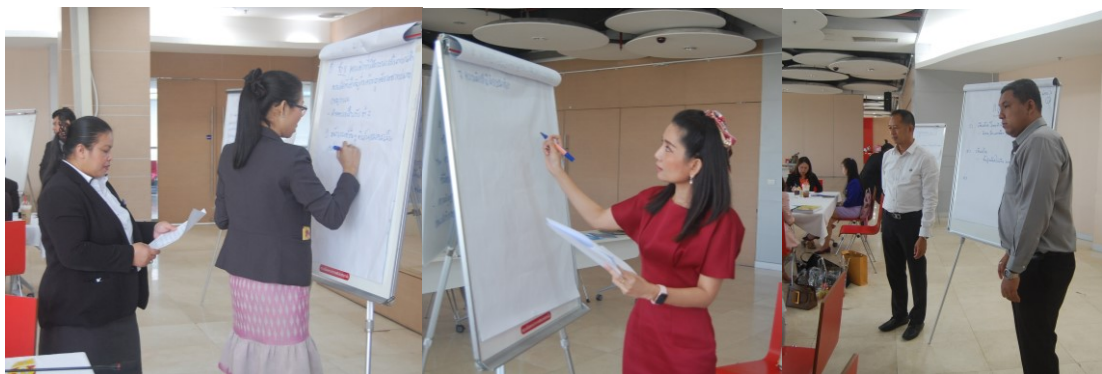
ภาพที่ 5.4 เลขานุการกลุ่มประชากรเฉพาะและประชากรผสม