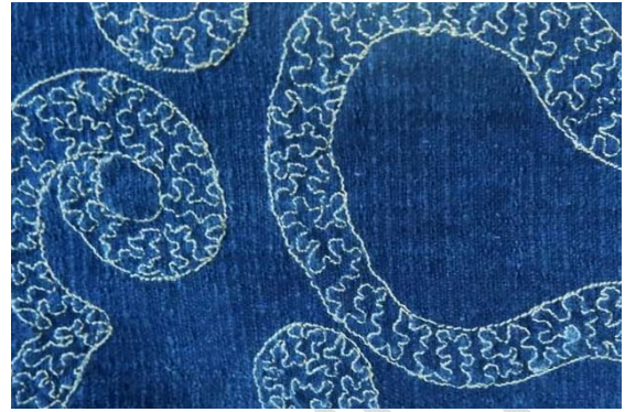
ภาพที่ 2 ลวดลายแบบนามธรรม (Abstract)