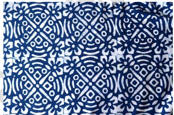
ภาพที่ 4 ลวดลายแบบไทยประยุกต์