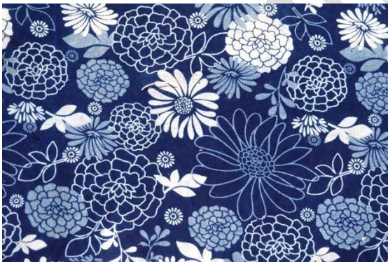
ภาพที่ 5 ลวดลายที่เกิดจากเส้นที่ให้ความรู้สึกต่าง ๆ