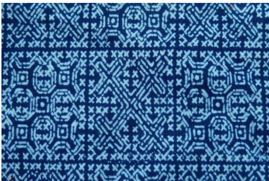
ภาพที่ 3 ลวดลายแบบไทยประยุกต์