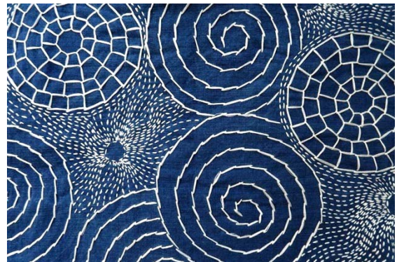
ภาพที่ 6 ลวดลายที่เกิดจากเส้นที่ให้ความรู้สึกต่าง ๆ