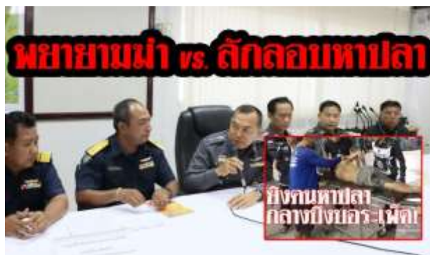
ภาพที่ 4.5 เจ้าหน้าที่หน่วยป้องกันและปราบปรามประมงน้ำจืดบึงบอระเพ็ดนครสวรรค์ ได้จับกุมผู้ ลักลอบใช้กระแสไฟฟ้าทำการประมงและลักลอบสูบน้ำ ในเขตบึงบอระเพ็ด https://www4.fisheries.go.th , (วันที่ 25 สิงหาคม 2563)