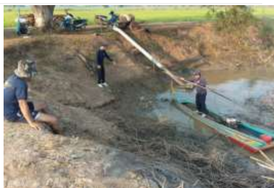
ภาพที่ 4.6 การบุกรุกที่ทำกินในเขตบึงบอระเพ็ด จ.นครสวรรค์ ชาวบ้านที่บุกรุกกว่า 50,000 ไร่ ไทยพีบีเอส, https://news.thaipbs.or.th/content/272746 , (25 สิงหาคม 2563)