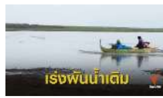
ภาพที่ 4.4 การลักลอบสูบน้ำในบึงบอระเพ็ดเพื่อทำการเกษตร, https://news.thaipbs.or.th/content/280052 , (วันที่ 25 สิงหาคม 2563)