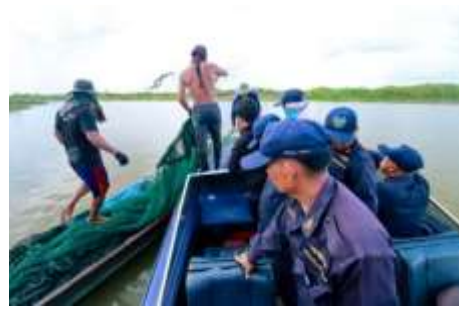
ภาพที่ 4.3 การปราบปรามการใช้เครื่องมือจับสัตว์น้ำที่ไม่ถูกต้อง, http://www.tnnthailand.com/player.php , (วันที่ 22 สิงหาคม 2563)