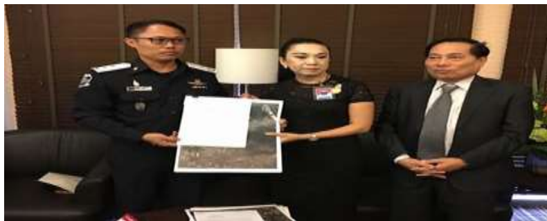
ภาพที่ 4.7 ชาวบ้านร้องดีเอสไอ เจ้าคณะจังหวัดนครสวรรค์สร้างอุทยานบุกรุกคลอง สาธารณประโยชน์บนเนื้อที่บึงบอระเพ็ด - ถมคลองสาหร่าย 300 ไร่

,https://mgronline.com/crime/detail/9600000025530 , (25 สิงหาคม 2563)