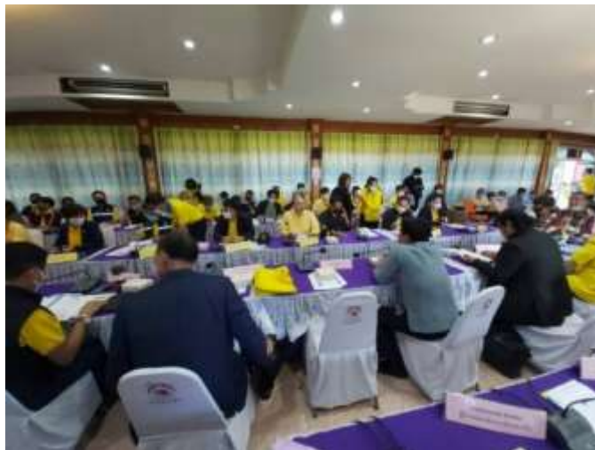
ภาพที่ 4.2 การประชุมโครงการตรวจสอบการใช้ประโยชน์ที่ดินบึงบอระเพ็ด เมื่อวันที่ 19 - 20 กรกฎาคม พ.ศ. 2563, เว็บไซต์สำนักงานธนารักษ์จังหวัดนครสวรรค์, วันที่ 19 สิงหาคม 2563)

ปัจจุบันปัญหาการบุกรุกพื้นที่บึงบอระเพ็ดยังคงมีอยู่ เนื่องจากปรากฏว่าสำนักงานธนารักษ์จังหวัดนครสวรรค์ดำเนินการตรวจสอบสิทธิของผู้ใช้พื้นที่บึงบอระเพ็ดเพื่อทำการเกษตร แต่ไม่มีการดำเนินคดีตามกฎหมาย (เอกสารรายงานธนารักษ์จังหวัดนครสวรรค์, 2563) เพื่อใช้ทำการเกษตร เช่น ทำนาข้าว ทำนาบัว และขุดบ่อเลี้ยงปลา โดยธนารักษ์พื้นที่นครสวรรค์มีการแก้ไขปัญหาการบุกรุกโครงการตรวจสอบการใช้ประโยชน์ที่ดินบึงบอระเพ็ด และการแก้ไขปัญหาการบุกรุกที่ดินของราษฎร ซึ่งพนักงานอัยการจังหวัดนครสวรรค์ ได้มีคำสั่งสั่งฟ้อง ปรากฏในสำนวนคดีหมายเลขแดง 3564/ 2557 และอีกหลายคดียังอยู่ในชั้นการพิจารณาคดีของศาลชั้นต้น ถึงแม้หน่วยงานภาครัฐจะดำเนินการแก้ไขปัญหาการบุกรุกโครงการตรวจสอบการใช้ประโยชน์ที่ดินบึงบอระเพ็ด และการแก้ไขปัญหาการบุกรุกที่ดินของราษฎร ปรากฏว่าประชาชนที่ไม่ได้สิทธิการขึ้นทะเบียนของกรมธนารักษ์ยังคงใช้พื้นที่บึงบอระเพ็ดทำการเกษตร ซึ่งหน่วยงานภาครัฐใช้วิธีการประชาสัมพันธ์ เรียกประชุมขอความร่วมมือจากประชาชนที่ใช้พื้นที่บึงบอระเพ็ด แต่ประชาชนที่ได้รับผลกระทบจากการประกาศของกรมธนารักษ์ไม่ให้ความร่วมมือ เนื่องจากไม่ได้อยู่ในหลักเกณฑ์การตรวจสอบสิทธิดังกล่าว แต่ไม่ได้มีการจับกุมดำเนินคดีตามกฎหมายแต่อย่างใด เพียงแต่ใช้การมีส่วนร่วมของประชาชนให้ความร่วมมือกับเจ้าหน้าที่รัฐ