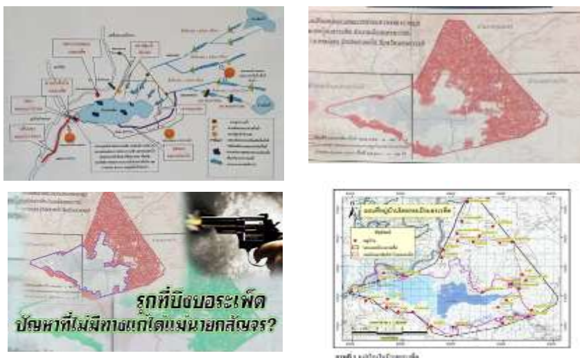
ภาพที่ 4.8 การบุกรุกบึงบอระเพ็ด

,https://mgronline.com/crime/detail/9600000025530 , (25 สิงหาคม 2563)