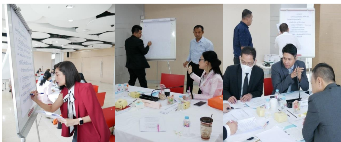
ภาพประกอบที่ 5.4 เลขานุการกลุ่มประชากรเฉพาะและกลุ่มประชากรผสม

4) การจัดเตรียมเลขานุการกลุ่ม เพื่อทำหน้าที่ในการบันทึกมติของที่ประชุมกลุ่ม (รูปภาพประกอบที่ 5.4)