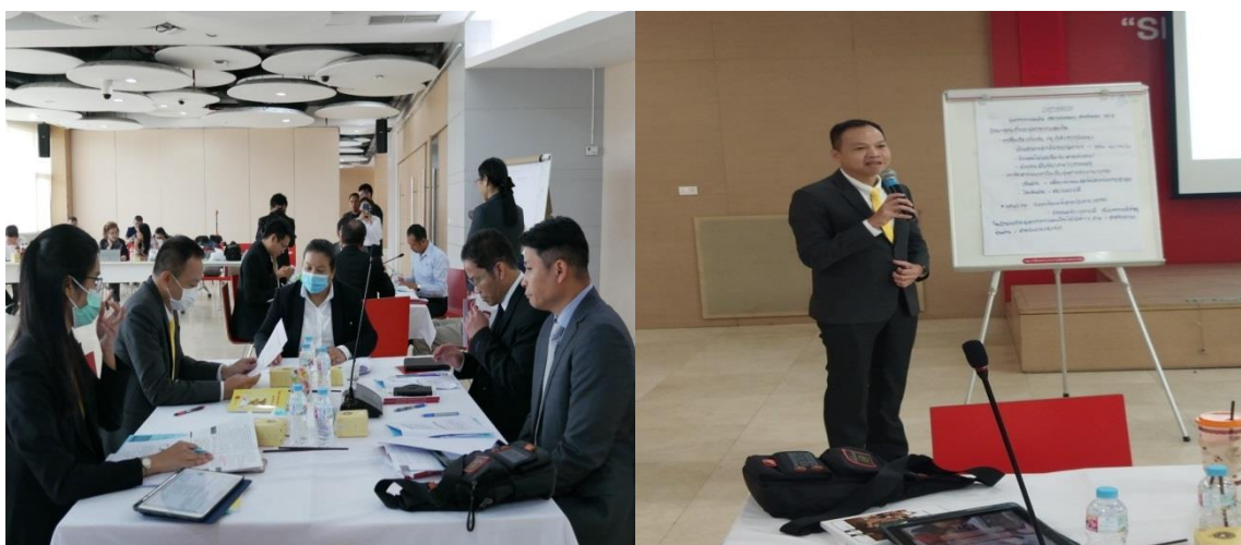
ภาพประกอบที่ 5.5 การอภิปรายและการนำเสนอต่อที่ประชุม

คำตอบที่ได้มาจากการอภิปรายในกลุ่มเฉพาะแต่ละกลุ่มเมื่อมีการนำเสนอต่อที่ประชุมแล้วถือว่าการเสร็จสิ้นการดำเนินการมีส่วนร่วมออกแบบของประชากรกลุ่มเฉพาะซึ่งจะเป็นข้อมูลเพื่อการวิจัยได้นำไปสู่การวิเคราะห์ต่อไป (ดูภาพประกอบที่ 5.5)