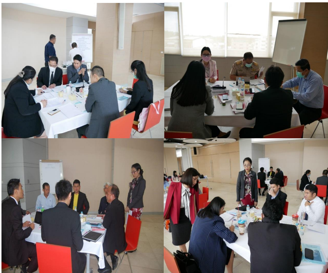
ภาพประกอบที่ 5.2 การอภิปรายและการนำเสนอ ตามประเด็น Co-Design ของประชากรกลุ่มเฉพาะ

ประชากรกลุ่มผสม หมายถึง ประชากรที่มาจากกลุ่มเฉพาะ แยกมากลุ่มละ 1 คน เพื่อผสมรวมเป็น 4 คน ต่อ 1 กลุ่ม ดังนั้น แต่ละกลุ่ม จึงประกอบด้วย ผู้ตรวจการแผ่นดิน ศาลรัฐธรรมนูญ ศาลปกครอง คณะกรรมการป้องกันและปราบปรามการทุจริตแห่งชาติ (ป.ป.ช.) หน่วยงานของรัฐ เจ้าหน้าที่รัฐ นักกฎหมายหรือนักวิชาการ (ดูภาพประกอบที่ 5.3)