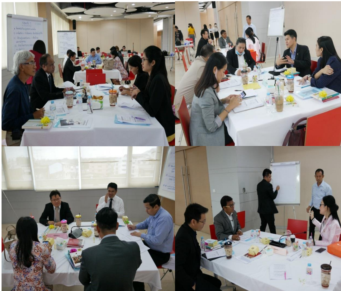
ภาพประกอบที่ 5.3 อภิปรายและการนำเสนอตามประเด็น Co-Design ของประชากรกลุ่มผสม

การจัดให้มีประชากรกลุ่มเฉพาะทำให้การอภิปรายร่วมกันในแต่ละกลุ่มเฉพาะที่ต่างก็มีประสบการณ์ อำนาจหน้าที่ของแต่ละคนที่เกี่ยวข้องกับอำนาจหน้าที่ของผู้ตรวจการแผ่นดินมาร่วมกันแลกเปลี่ยนความคิดเห็นเกี่ยวกับอำนาจหน้าที่ของผู้ตรวจการแผ่นดิน