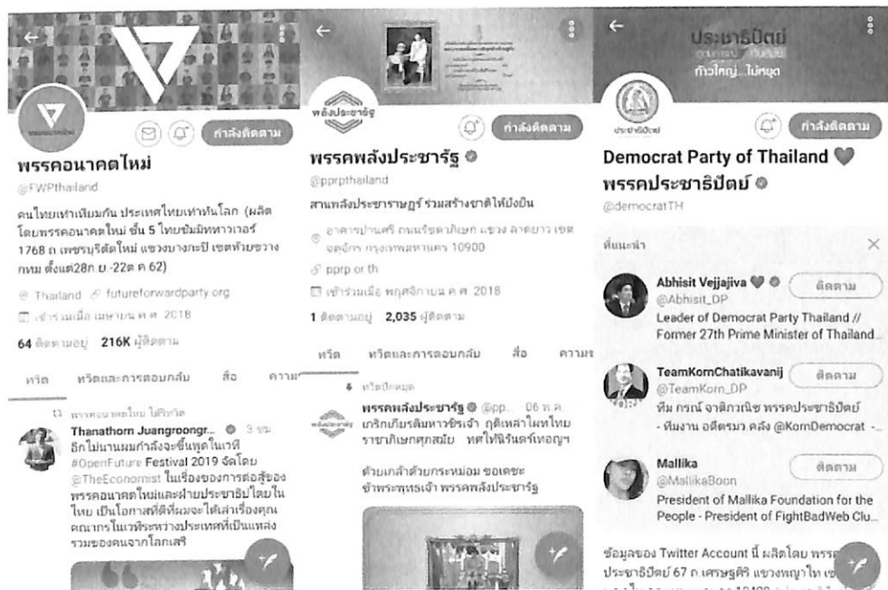
ตัวอย่างทวีตเตอร์พรรคการเมือง