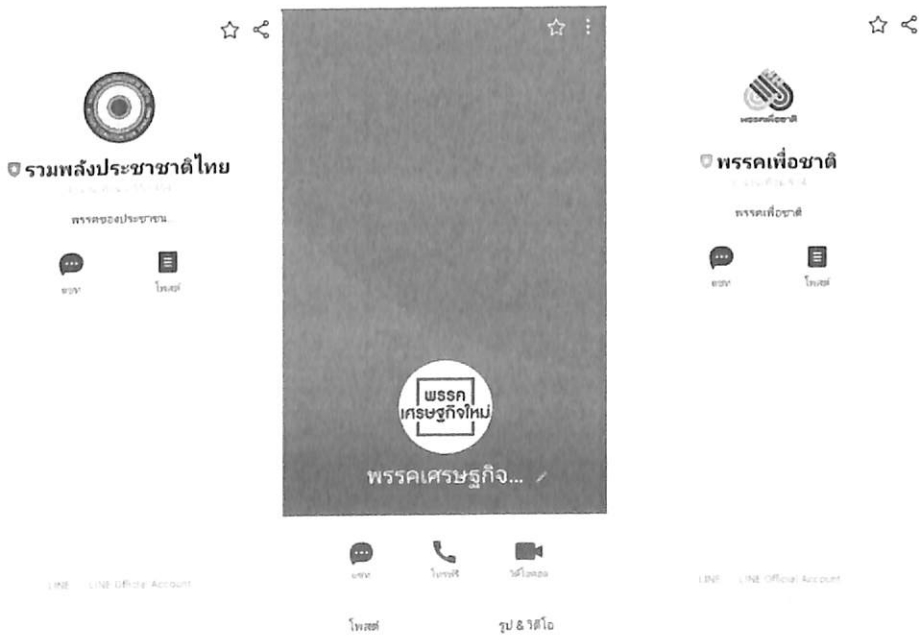
ตัวอย่างไลน์พรรคการเมือง