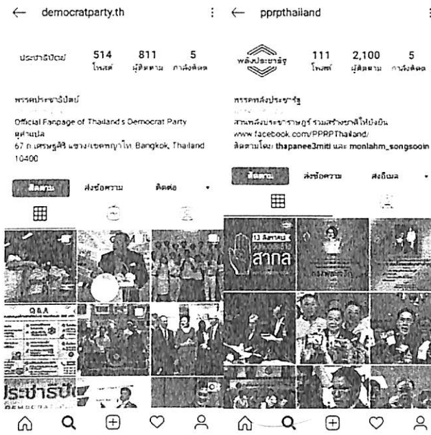
ตัวอย่างอินสตาแกรมพรรคการเมือง