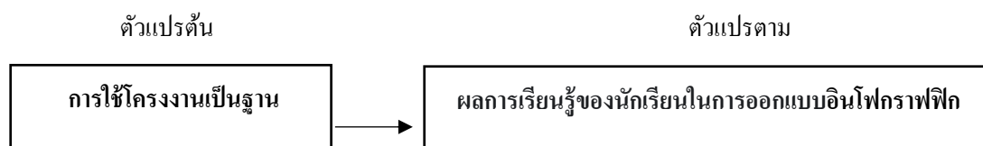
รูปที่ 1 กรอบแนวคิดในการวิจัย