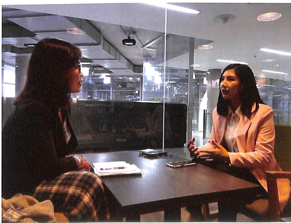
สัมภาษณ์ คุณปอเป็ยะ กาลเวลา เสาเรื่อน ผู้สื่อข่าวของช่องเวิร์คพอยท์