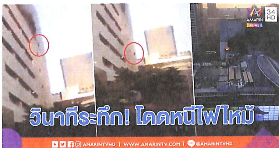
ภาพประกอบที่ 1.1 : ภาพวินาทีหนีตายไฟไหม้ห้างดังเซ็นทรัลเวิร์ล

ความถูกต้องของข้อมูลที่ได้รับก่อนรายงานข้อมูลไปสู่ประชาชน รวมถึงระมัดระวังการนำเสนอภาพเหตุการณ์ต่างๆ เพราะเป็นการตอกย้ำให้ถึงผลกระทบด้านความสูญเสียกับบุคคลที่ตกเป็นข่าว เช่น กรณีการนำเสนอข่าวเหตุการณ์เพลิงไหม้ห้างสรรพสินค้าเซ็นทรัลเวิร์ล เมื่อวันที่ 12 เมษายน 2562 ที่ผ่านมา ปรากฏภาพคลิปสดขณะพนักงานของห้างตกลงมาจากบริเวณชั้น 8 ของอาคาร และมีการบันทึกคลิปเหตุการณ์เอาไว้ได้ มีการเผยแพร่จนเป็นกระแส Viral และสื่อทุกสำนักเลือกที่จะนำคลิปสดดังกล่าวเผยแพร่สู่สาธารณชน โดยเผยแพร่ตั้งแต่พนักงานชายคนดังกล่าว ปีนช่องหน้าต่าง และร่วงลงมากระแทกหลังคาได้รับบาดเจ็บสาหัสและเสียชีวิตลง โดยคลิปดังกล่าวถูกนำเสนอผ่านหน้าจอโทรทัศน์เข้าหลายๆ รอบ ซึ่งตามหลักจรรยาบรรณสื่อมวลชน ควรเลือกนำเสนอในลักษณะของภาพนิ่ง ไม่ควรปล่อยภาพเหตุการณ์ทั้งหมด ทั้งนี้ทั้งนั้นการปล่อยคลิปเหตุการณ์นั้น ควรคำนึงถึงครอบครัวผู้สูญเสียมาเป็นอันดับแรก เพราะอาจส่งผลกระทบต่อสภาพจิตใจครอบครัว เพื่อนร่วมงาน หรือคนใกล้ชิดกับบุคคลที่ตกเป็นข่าวได้