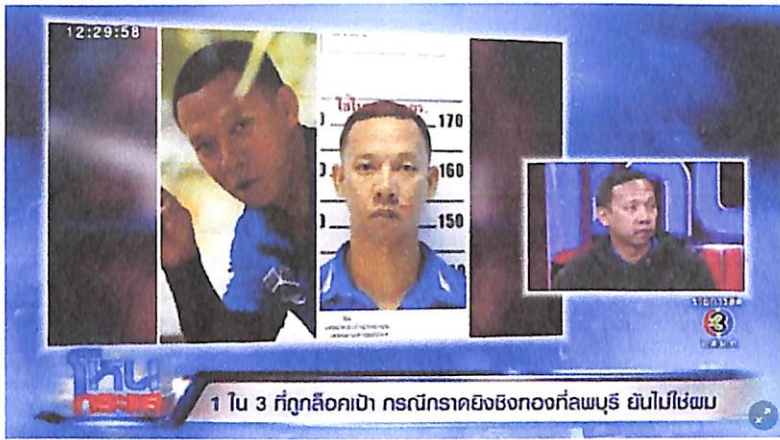
ภาพประกอบที่ 1.3 : ภาพผู้ถูกกล่าวหาคดีกราดยิงชิงทองออโรซ่า จังหวัดลพบุรี ที่มา : ช่อง 3HD (สืบค้นเมื่อ 15 มกราคม 2563)

ส่วนผลสำเร็จในการนำเสนอข่าว ประกอบด้วยปัจจัยหลายๆ ด้าน ทั้งเนื้อหาข่าวที่เป็นข้อเท็จจริง ผู้ส่งสารมีเทคนิคในการนำเสนอข่าวให้เป็นที่น่าสนใจ มีการเตรียมความพร้อมทั้งด้านร่างกาย และจิตใจ โดยศึกษาวิธีการอ่านข่าว ส่งไปถึงยังผู้รับสาร เช่น การใช้น้ำเสียง (Voice) การรายงานข่าวประเภทอาชญากรรม ถือเป็นสิ่งสำคัญอย่างหนึ่ง ไม่ว่าจะในระดับเสียง ความดัง การออกเสียง ฉะฉาน หนักแน่น สื่อสารเข้าใจง่าย และมีความน่าเชื่อถือ รวมไปถึงการใช้ภาษากาย (Body Language) ก็มีส่วนสำคัญต่อการนำเสนอข่าวไม่แพ้กัน เนื่องจากการแสดงท่าทางหรือท่วงท่าระหว่างการรายงานข่าว สามารถทำให้ผู้รับสารมีอารมณ์ร่วมกับเหตุการณ์ หรือสถานการณ์ที่ผู้สื่อข่าว หรือผู้ประกาศกำลังถ่ายทอดผ่านหน้าจอโทรทัศน์ได้ ซึ่งต้องดูเป็นธรรมชาติ ไม่เกร็ง ใช้คำถามกับแหล่งข่าวด้วยความสุภาพ และเหมาะสม เพื่อช่วยให้การนำเสนอข่าวนั้นประสบความสำเร็จ ทำให้ผู้รับสารอยากติดตามข่าวนั้นไปจนจบสิ้นการรายงาน หรือกระทั่งสิ้นสุดคดีดังนั้นเมื่อบริบททางสังคมที่เปลี่ยนแปลงอย่างรวดเร็ว วิถีการดำเนินชีวิตที่ทวีปริมาณเกิดขึ้นมากมาย และสร้างความสูญเสียแต่ละด้านอย่างคาดไม่ถึง ผู้ที่มีส่วนเกี่ยวข้องกับการนำเสนอข่าวจึงจำเป็นต้องทำให้ข่าวที่ถูกนำเสนอออกไป มีคุณค่าของข่าวเกิดขึ้นด้วย