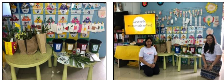
ภาพที่ 3-4 สื่อการสอน เรื่อง การแยกประเภทขยะสำหรับผู้เรียนใน โรงเรียนวัดสีลัง

ผู้วิจัยได้พัฒนาสื่อการสอนเรื่อง การแยกประเภทขยะ โดยใช้สื่อจำลองประเภทถังขยะจำลอง 4 ประเภท ที่มีลักษณะเสมือนของจริงมีภาพบรรยายลักษณะของประเภทของถังขยะเพื่อให้นักเรียนได้เรียนรู้และแยกประเภทขยะได้ถูกต้อง