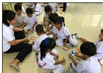
ภาพที่ 1-2 การจัดการเรียนการสอนโดยใช้สื่อการสอนเรื่อง การแยกประเภทขยะ สำหรับผู้เรียนใน โรงเรียนวัดศีลิ่ง สำหรับนักเรียนอนุบาล 2 และ 3