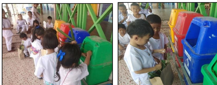
ภาพที่ 5-6 ทักษะการแยกขยะจากการปฏิบัติจริง

ตอนที่ 3 การประเมินทักษะการใช้สื่อการสอนเรื่อง การแยกประเภทขยะ โดยการสังเกตสำหรับนักเรียนระดับชั้นอนุบาล 2 และ 3 โรงเรียนวัดสี่ลี้