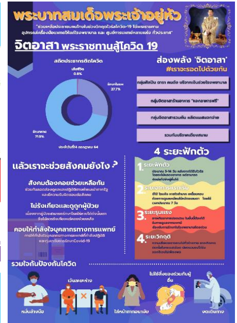
รางวัลรองชนะเลิศอันดับที่ 2 7016 จิตอาสาพระราชทานจากในหลวงร.10 เด็กหญิง ลักษิกา เผือกผล