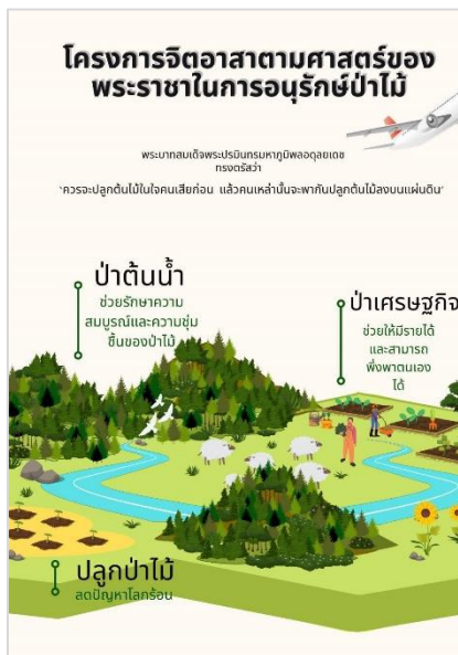
รางวัลชมเชย 7006 โครงการจิตอาสาตามศาสตร์ของพระราชาในการอนุรักษ์ป่าไม้ เด็กหญิงบรรจिता หนูเล็ก