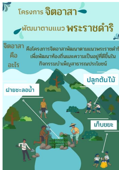
รางวัลชมเชย 7007 โครงการจิตอาสาพัฒนาตามแนวพระราชดำริ เด็กหญิงสุชาวดี พันธุ์ดวง