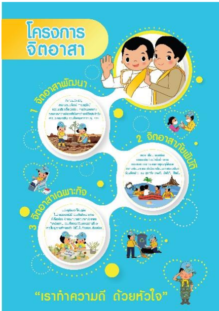
รางวัลชนะเลิศ 7009 “โครงการจิตอาสา” เด็กหญิง พิมพ์มาดา ช่างทุ่งใหญ่