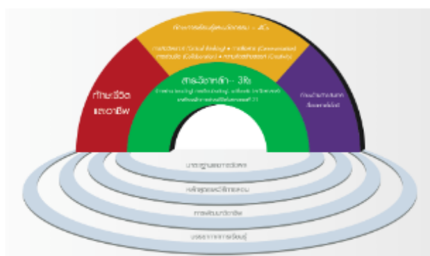
ภาพที่ 1 ทักษะสำคัญที่จำเป็นในโลกศตวรรษที่ 21

นอกจากนี้ จากการสำรวจของสำนักงานสถิติแห่งชาติ ในปี 2558 – 2561 พบว่าอัตราการใช้ อินเทอร์เน็ตของคนไทยเพิ่มสูงขึ้นอย่างต่อเนื่อง แต่ส่วนใหญ่ไม่ได้ใช้อ่านเพื่อหาความรู้ และอัตราการอ่านเฉลี่ยของคนไทยยังอยู่ในระดับต่ำ แหล่งการเรียนรู้ส่วนใหญ่ที่มีอยู่ยังไม่ส่งเสริมให้เกิดการแลกเปลี่ยนเรียนรู้เป็นเพียงแหล่งให้ความรู้ อย่างไรก็ตาม ความก้าวหน้าทางเทคโนโลยีด้านการสื่อสารอย่างรวดเร็วจะนำสังคมไทยไปสู่สังคมดิจิทัลมากขึ้น ถือเป็นความท้าทายต่อระบบการศึกษา การจัดการเรียนการสอนและกระบวนการเรียนรู้ตลอดชีวิตที่ต้องปรับให้อยู่บนฐานของนวัตกรรมและเทคโนโลยีดิจิทัล รวมทั้งเอื้อต่อคนทุกกลุ่มให้สามารถเข้าถึงสื่อการเรียนรู้ที่หลากหลาย โดยไม่จำกัดเวลาและสถานที่ ซึ่งสอดคล้องกับการขับเคลื่อนยุทธศาสตร์ที่ 3 ของแผนการศึกษาแห่งชาติฉบับปัจจุบัน ว่าด้วยการพัฒนาศักยภาพคนทุกช่วงวัย และการสร้างสังคมแห่งการเรียนรู้ ซึ่งมีจุดมุ่งหมายเพื่อพัฒนาศักยภาพคนทุกช่วงวัย ด้วยรูปแบบและช่องทางการเรียนรู้ที่หลากหลาย เหมาะสมสอดคล้องกับพัฒนาการของแต่ละช่วงวัย สื่อการเรียนรู้ที่ไม่จำกัดรูปแบบ เวลาและสถานที่ ซึ่งทั้งหมดนี้มีส่วนต่อการพัฒนาศักยภาพของคนทุกกลุ่มเป้าหมาย