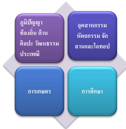
ภาพที่ 1 ภูมิปัญญาผู้สูงวัย ในจังหวัดปทุมธานี