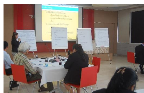
ภาพที่ 5.2 การอภิปรายและการนำเสนอตามประเด็น Co-Design ของประชากรกลุ่มเฉพาะ