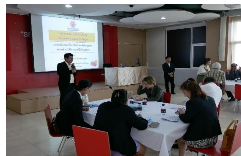
ภาพที่ 5.3 อภิปรายและการนำเสนอตามประเด็น Co-design ของประชากรกลุ่มผสม

การจัดให้มีประชากรกลุ่มเฉพาะทำให้การอภิปรายร่วมกันภายในแต่ละกลุ่มเฉพาะที่ต่างก็มีประสบการณ์คล้ายกันมาร่วมแลกเปลี่ยนความคิดเห็นเกี่ยวกับการจัดทำกฎหมายการตั้งศาลสิทธิมนุษยชนแห่งชาติและวิธีพิจารณาคดีสิทธิมนุษยชนอยากจะได้รับที่ไม่แตกต่างกันมากนัก