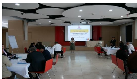
ภาพที่ 5.1 การนำเสนอประเด็น Co-Design

ในการจัดกิจกรรม Co-Design มีจำนวนทั้งสิ้น 16 คน แยกออกเป็น 4 กลุ่ม ประกอบด้วย