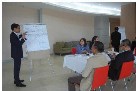
ภาพที่ 5.5 การอภิปรายและการนำเสนอต่อที่ประชุม

2) ช่วงบ่าย เป็นการจัดทำ Co-Design กลุ่มผสม การวิจัยใช้เวลาดำเนินการประมาณ 3 ชั่วโมง มีการดำเนินการเช่นเดียวกับกลุ่มเฉพาะ