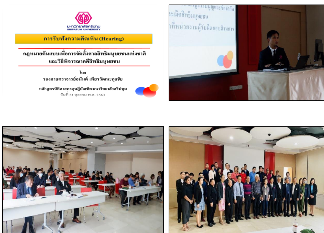
ภาพที่ 5.6 การรับฟังความคิดเห็น

การรับฟังความคิดเห็นนี้เป็นการนำเสนอผลการวิจัยและร่างพระราชบัญญัติจัดตั้งศาลสิทธิมนุษยชนแห่งชาติและวิธีพิจารณาคดีสิทธิมนุษยชน พ.ศ. .... เพื่อให้ผู้เข้าร่วมรับฟังความคิดเห็นจากประชากรที่เป็นกลุ่มเจ้าหน้าที่รัฐ กลุ่มนักวิชาการ กลุ่มกระบวนการยุติธรรมทางอาญา กลุ่มประชาชนและนักสิทธิมนุษยชน รวมทั้งสิ้น 70 คน โดยจัดให้มีการรับฟังความคิดเห็นที่ห้องประชุมคอนเวนชัน ชั้น 4 อาคาร 40 ปี มหาวิทยาลัยศรีปทุม บางเขน ในวันที่ 31 ตุลาคม พ.ศ. 2563 ปรากฏผล (ดูภาพที่ 5.6)