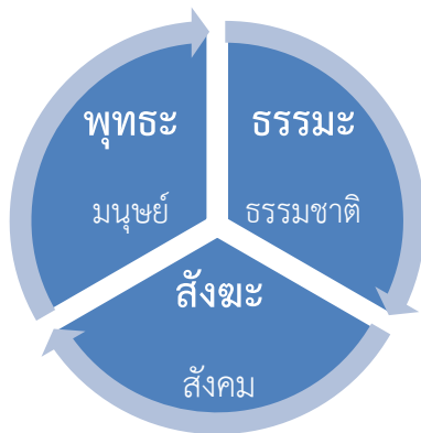
แผนภาพ 2 องค์ประกอบแห่งการดำรงอยู่ของสรรพสิ่ง

ทั้งนี้ ท่านมีความเชื่อว่า ถ้ามนุษย์มีความสัมพันธ์และทำที่ที่ต่อสรรพสิ่งอย่างถูกต้องแล้ว ก็จะทำให้เกิดดุลยภาพแห่งความสัมพันธ์ระหว่างมนุษย์กับธรรมชาติ และจะส่งผลให้องค์ประกอบแห่งการดำรงอยู่ของสรรพสิ่ง 3 ประการ คือ มนุษย์ ธรรมชาติ และสังคม เป็นไปอย่างประสานกลมกลืนสอดคล้องกัน ซึ่งท่านได้อธิบายและตีความจากหลักพระรัตนตรัยนั่นเองว่า พระพุทธ ก็คือตัวแทนของมนุษย์ พระธรรม ก็คือ ธรรมชาติ และพระสงฆ์นั้นก็คือ ตัวแทนของสังคม ดังแสดงในแผนภาพที่ 2