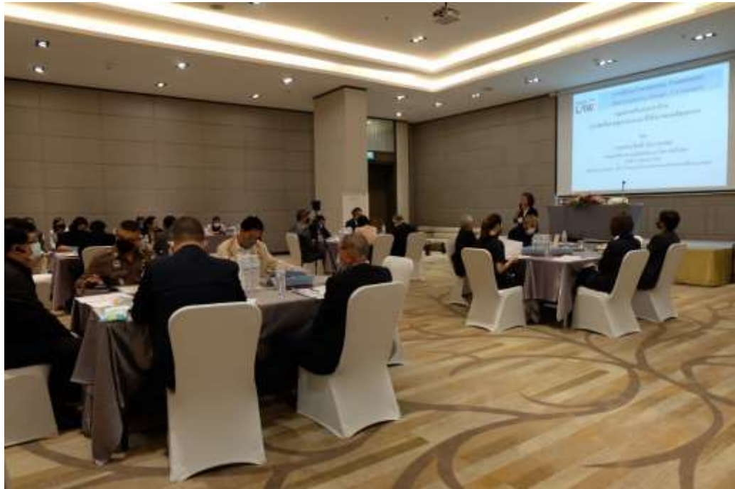
ภาพกิจกรรมที่ 1