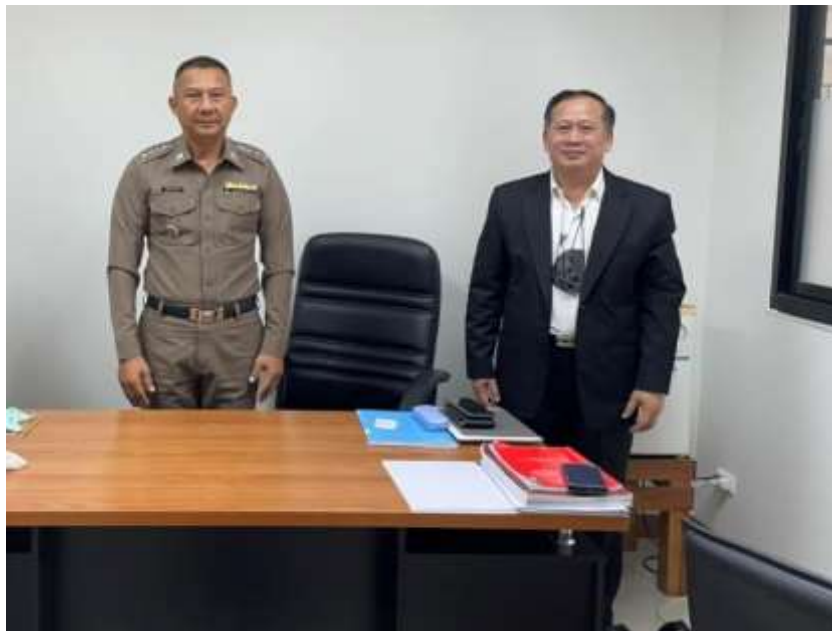
สัมภาษณ์ พ.ต.อ. สัมฤทธิ์ เกตุแก้ว พนักงานสอบสวน และรองผู้บังคับการสอบสวน