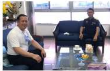
ผู้เชี่ยวชาญการศุลกากร