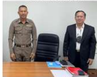
พนักงานสอบสวน