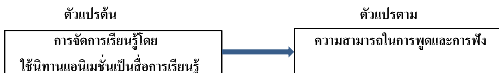
แผนภาพที่ 1 กรอบแนวคิดในการวิจัย