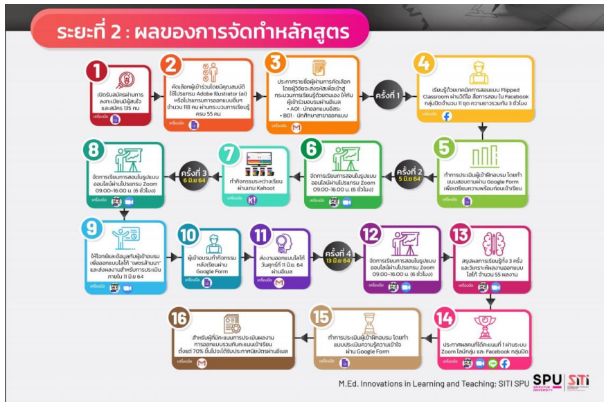
แผนภาพที่ 2 ผลของการจัดทำหลักสูตร