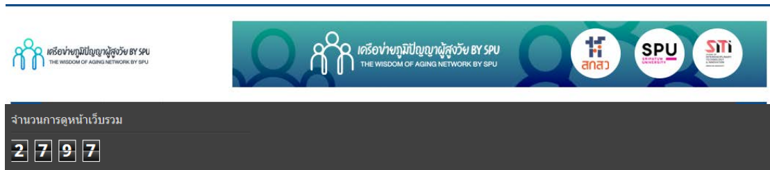
ภาพที่ 2 สถิติการเข้าชม Web Blog เครือข่ายภูมิปัญญาผู้สูงอายุ By SPU

1. การเผยแพร่ผ่าน Web Blog เครือข่ายภูมิปัญญาผู้สูงอายุ By SPU https://agingbyspu.blogspot.com ด้านอาหารและขนมไทย ด้านตำหรับยาไทย ด้านศิลปะวัฒนธรรม ด้านหัตถกรรม ด้านเกษตร เป็นต้น มีผู้เข้าชม ณ ปัจจุบัน 2,797 Views ดังภาพที่ 2