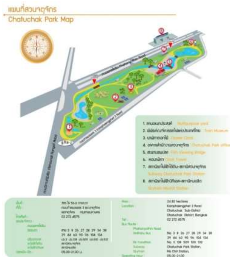
ภาพประกอบที่ 2 อุทยานสวนจตุจักร