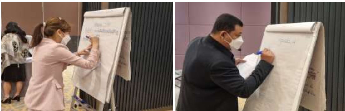
ภาพประกอบที่ 5.3 การจัดเตรียมให้มีเลขานุการกลุ่ม เพื่อให้มีหน้าที่จดบันทึกสรุปมติที่ประชุมกลุ่ม

ผู้วิจัย ได้จัดเตรียมให้มีเลขานุการกลุ่ม เพื่อให้มีหน้าที่ในการจดบันทึกข้อมูลสรุป ตามมติที่ประชุมกลุ่ม เพื่อที่จะนำเสนอต่อที่ประชุมกลุ่มรวม ที่จะใช้ในการเปรียบเทียบข้อมูลระหว่างกลุ่มต่อไป