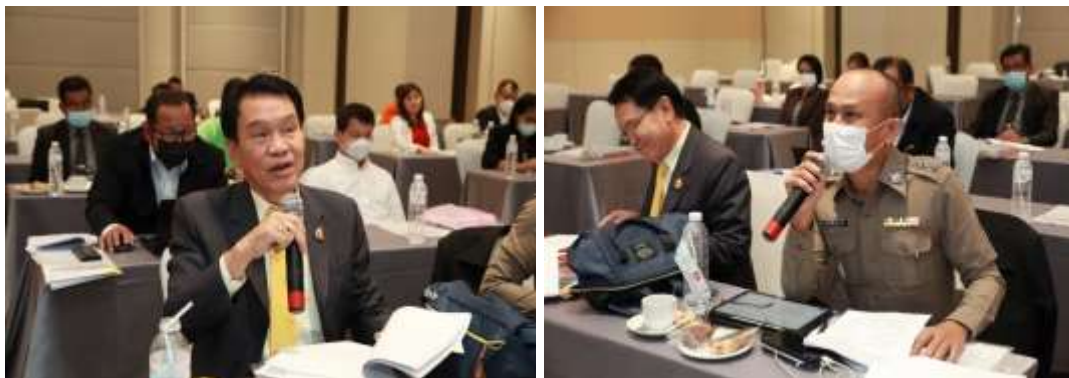
ภาพประกอบ 5.7 ภาพการแสดงความคิดเห็น (Hearing)

จากการรับฟังความคิดเห็น Hearing ผู้เข้าร่วมได้แสดงความคิดเห็น ดังนี้