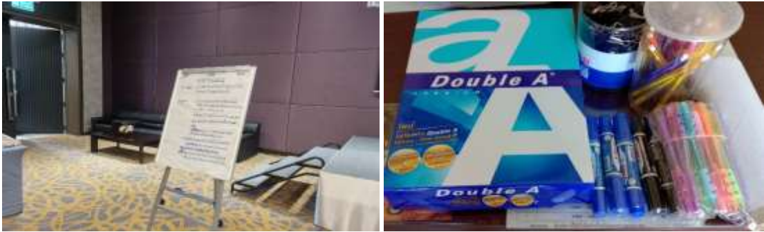
ภาพประกอบที่ 5.2 การจัดเตรียมอุปกรณ์ที่ใช้ในการจัดทำ (Co-design)

ผู้วิจัยได้ดำเนินการจัดเตรียมวัสดุอุปกรณ์ที่จะใช้ในการจัดทำ (Co-design) ประกอบด้วย กระดาษแผ่นใหญ่ และเครื่องเขียนสำหรับบันทึกคำตอบจากมติของแต่ละกลุ่ม โดยมีแท่นตั้งรับกระดาษเพื่อใช้ในการบันทึกประเด็นคำตอบของแต่ละกลุ่ม เพื่อนำเสนอต่อที่ประชุมกลุ่มรวมทั้ง 4 กลุ่ม