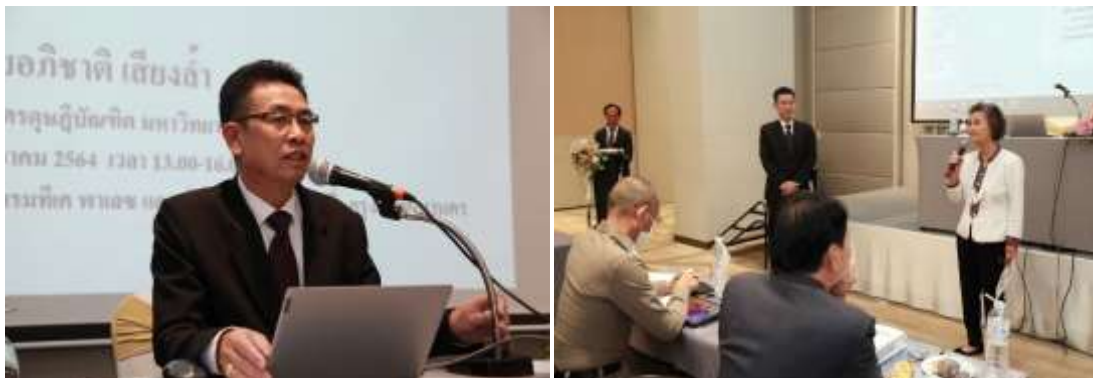
ภาพประกอบที่ 5.6 ภาพผู้วิจัยนำเสนอร่างกฎหมายก่อนการแสดงความคิดเห็น (Hearing)

กระบวนการจัดทำ Hearing คือ ผู้วิจัยได้นำเสนอผลการวิจัยตาม Power Point โดยมีสาระสำคัญคือ ความเป็นมาของปัญหาที่นำไปสู่การทำวิจัย วัตถุประสงค์การวิจัย วัตถุประสงค์การทำ Hearing วิธีวิทยาการวิจัยที่ใช้ในการเก็บข้อมูล และวิเคราะห์ข้อมูล เนื้อหาที่วิจัยประกอบด้วยกฎหมายต่างประเทศที่เกี่ยวกับความร่วมมือของท้องถิ่น ในรูปแบบมีสถานะเป็นนิติบุคคล Code general des collectivites Territoriale of 1996 (พ.ศ. 2539) (E'tablissements de Cooperation Intercommunale) ของสาธารณรัฐฝรั่งเศส Special District : Solid Waste Disposal District Act of 1965 (พ.ศ. 2508) ของสหรัฐอเมริกา Local Autonomous Law 1947 (พ.ศ. 2490) Municipal Cooperative: Partial Cooperative ของประเทศญี่ปุ่น และกฎหมายไทยที่เกี่ยวกับความร่วมมือขององค์กรปกครองส่วนท้องถิ่น ได้แก่ รัฐธรรมนูญแห่งราชอาณาจักรไทยเกี่ยวกับความร่วมมือขององค์กรปกครองส่วนท้องถิ่น ได้แก่ รัฐธรรมนูญแห่งราชอาณาจักรไทย พุทธศักราช 2560 พระราชบัญญัติระเบียบบริหารราชการแผ่นดิน พ.ศ. 2534 พระราชบัญญัติเทศบาล พ.ศ. 2496 พระราชบัญญัติองค์การบริหารส่วนจังหวัด พ.ศ. 2540 พระราชบัญญัติสภาตำบลและองค์การบริหารส่วนตำบล พ.ศ. 2537 พระราชบัญญัติระเบียบบริหารราชการกรุงเทพมหานคร พ.ศ. 2528 พระราชบัญญัติระเบียบบริหารราชการเมืองพัทยา พ.ศ. 2542 พระราชบัญญัติกำหนดแผนและขั้นตอนการกระจายอำนาจให้แก่องค์กรปกครองส่วนท้องถิ่น พ.ศ. 2542