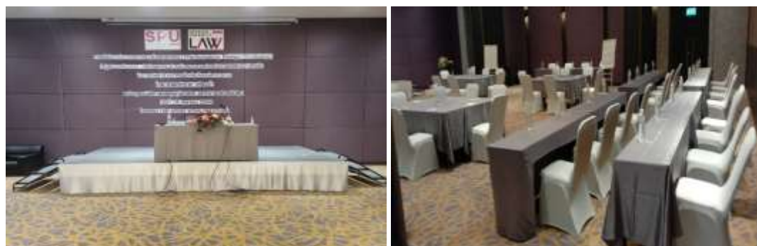
ภาพประกอบที่ 5.1 การจัดเตรียมสถานที่จัดทำ (Co-design)

ประชากรถูกกำหนดไว้เป็น 4 กลุ่ม จึงจัดสถานที่โดยแยกเป็น 4 โต๊ะ ในห้องเดียวกัน ซึ่งให้มีระยะห่างจากกันพอประมาณ เพื่อไม่ให้เกิดการร่วมแสดงความคิดเห็นของแต่ละกลุ่มรบกวนกัน จึงจำเป็นต้องใช้ห้องขนาดใหญ่ ซึ่งการวิจัยนี้ได้ใช้ห้องประชุมแมกโนเลีย 1 ชั้น 4 โรงแรม ทีเค พาเลซ แอนด์ คอนเวนชัน หลักสี่ กรุงเทพมหานคร เนื่องจากกลุ่มประชากรทั้งสี่กลุ่ม รวมถึงองค์กรปกครองส่วนท้องถิ่นหลายระดับ สะดวกในการเดินทาง อีกทั้งประชากรดังกล่าวมีความสนใจในหลักการความร่วมมือขององค์กรปกครองส่วนท้องถิ่น นับแต่วันที่ประสานงานโดยได้อธิบายถึงวัตถุประสงค์ในการดำเนินการวิจัย จึงทำให้ประชากรมีความประสงค์ที่จะมาเป็นประชากรผู้มีส่วนได้เสีย ในการทำการมีส่วนร่วมออกแบบ, ร่วมออกแบบ นี้