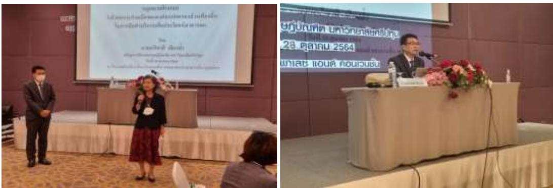
ภาพประกอบที่ 5.5 ผู้วิจัยนำเสนอวัตถุประสงค์การทำ Co-Design และประเด็น Co-Design

2) ผู้วิจัยนำเสนอวัตถุประสงค์ของการวิจัย และวัตถุประสงค์ของการจัดทำ (Co-design) ประเด็นในการอภิปรายของประชากร (Co-design) ที่เป็นประเด็นจากการวิเคราะห์ในบทที่ 4 เพื่อเป็นแนวทางการอภิปราย โดยไม่จำกัดว่าการอภิปรายจะต้องยืนยันตามประเด็นดังกล่าว ซึ่งประชากรกลุ่มเฉพาะสามารถที่จะนำประเด็นอื่น ๆ ที่คิดว่าเหมาะสมมาอภิปรายได้โดยอิสระ ปราศจากการชี้นำหรือแทรกแซงใด ๆ