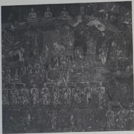
พินิจ มิชาเรี “จารึกวัดมหาธาตุ สุโขทัย หมายเลข 2” วาดเส้นด้วยปากกาน้ำเงิน 250 x 260 ซม.

Pinit Micharee “Inscription of Wat Mahathat Sukhothai No.2” Pen drawing on canvas 250 x 260 cm