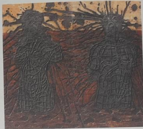
ภานุวัฒน์ สิทธิโชค “พันธจองจำจิต หมายเลข 9” แกะสลักบนไม้และหมึกพิมพ์ 218 x 245 ซม.

Pinit Micharee “Inscription of Wat Mahathat Sukhothai No.2” Pen drawing on canvas 250 x 260 cm