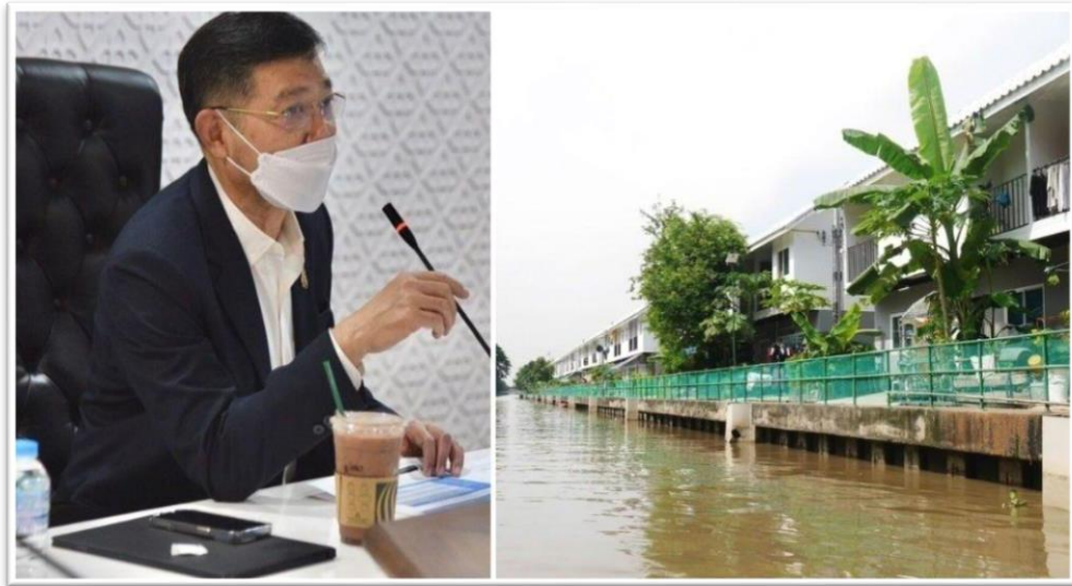
ภาพประกอบที่ 4.2 ปลัดกรุงเทพมหานคร เป็นประธานการประชุมติดตามความคืบหน้า แนวทางการพัฒนาคลองแสน

https://www.khaosod.co.th/around-thailand/news_6880145 (วันที่ 8 กุมภาพันธ์ 2565)