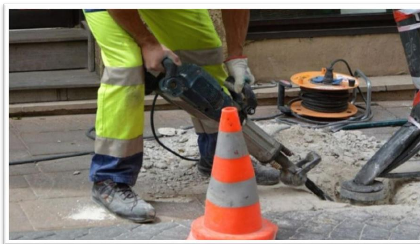
ภาพประกอบที่ 4.4 ภาพการขูดเจาะถนนที่ทำให้เกิดความสั่นสะเทือน

https://www.bangkokbiznews.com/social/839501 (2 กรกฎาคม 2562)