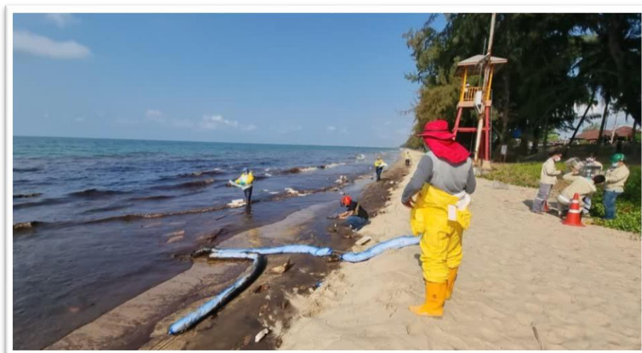
ภาพประกอบที่ 4.5 เจ้าหน้าที่เก็บกู้คราบน้ำมัน

https://prachatai.com/journal/2022/01/97031 (วันที่ 29 มกราคม 2565)