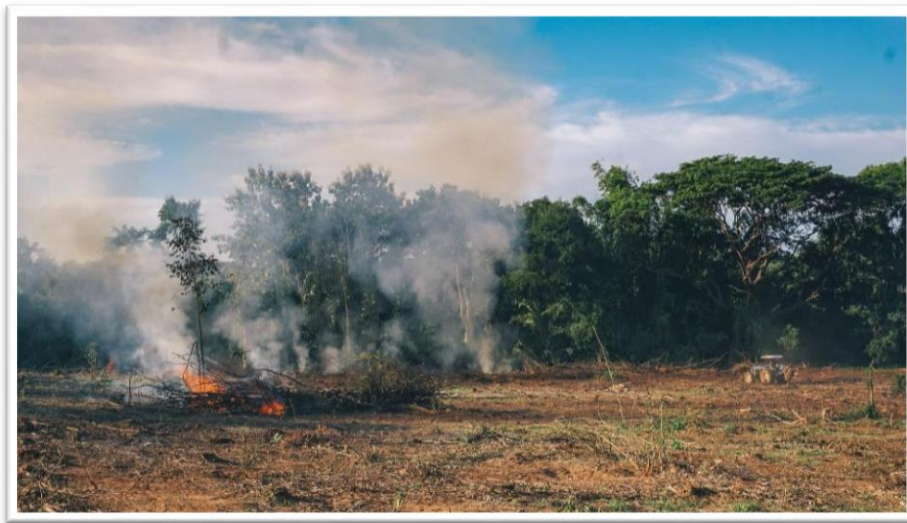
ภาพประกอบที่ 4.1 การเผาวัสดุเกษตรในที่โล่งในพื้นที่ จ.เชียงใหม่

ให้เกิดความร้อนตามมา โดยเหตุรำคาญจากความร้อน (Thermal Pollution) ซึ่งนอกจากจะมาจาก การเผาป่าหรือขยะแล้วยังมาจากกรรมวิธีการผลิตในโรงงานได้อีกด้วย เช่น การปฏิบัติงานใน โรงงานถลุงเหล็ก โรงงานตีเหล็ก โรงงานทำแก้ว เป็นต้น ซึ่งผลกระทบจากการที่ได้รับความร้อน มากเกินไปจะทำให้เกิดอาการต่าง ๆ เช่น เกิดอาการเป็นตะคริว รู้สึกอ่อนเพลีย ผดผื่นคันตามบริเวณ ผิวหนัง รู้สึกกระหายจากการขาดน้ำหรือ เกิดการติดเชื้อในระบบทางเดินหายใจกับผู้ที่ได้รับ ผลกระทบนี้ (ดูภาพประกอบที่ 4.1)