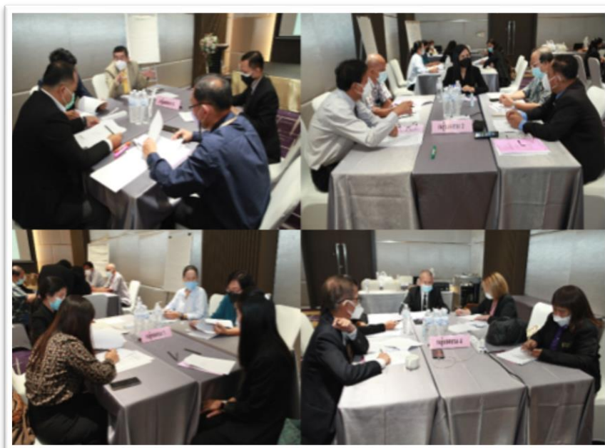
ภาพประกอบที่ 5.2 ประชากรกลุ่มผสม

ประชากรกลุ่มผสม หมายถึง ประชากรที่มาจากกลุ่มเฉพาะ แยกมากลุ่มละ 1 คน เพื่อผสมรวมเป็น 4 คนต่อ 1 กลุ่ม ดังนั้น แต่ละกลุ่มผสม จึงประกอบด้วย กลุ่มที่ 1 กลุ่มเจ้าหน้าที่รัฐ และองค์กรปกครองส่วนท้องถิ่น กลุ่มที่ 2 กลุ่มเจ้าหน้าที่รัฐและองค์กรปกครองส่วนท้องถิ่นและ นักกฎหมายกลุ่มที่ 3 กลุ่มภาคธุรกิจเอกชน กลุ่มที่ 4 กลุ่มประชาชน