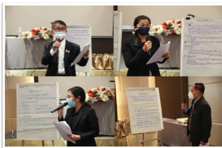
ภาพประกอบที่ 5.7 การนำเสนอผลของกลุ่มผสมทั้ง 4 กลุ่ม

เนื่องจากการร่วมออกแบบ Co-Design ประชากรกลุ่มผสม มีประเด็นในการร่วมออกแบบเป็นประเด็นเดียวกันกับการร่วมออกแบบในช่วงเช้าของกลุ่มเฉพาะ ผลของคำตอบที่ได้จากการร่วมออกแบบ Co-Design ประชากรกลุ่มเฉพาะ จึงมีความเห็นที่คล้ายคลึงกับการร่วมออกแบบในช่วงเช้าของกลุ่มเฉพาะแต่ก็มีส่วนที่แตกต่างเล็กน้อย ดังนี้