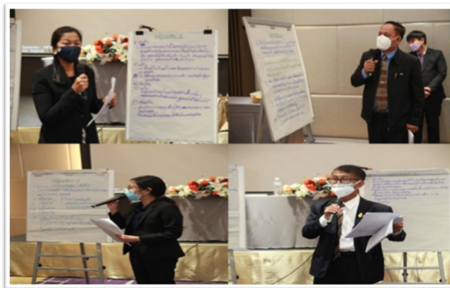
ภาพประกอบที่ 5.5 การนำเสนอของกลุ่มผสม