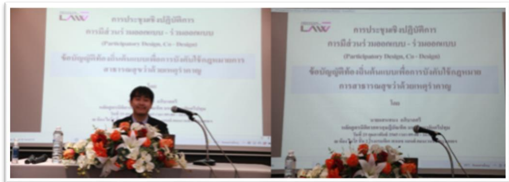
ภาพประกอบที่ 5.3 การนำเสนอประเด็น Co-Design

รวมทั้งเป็นแนวทางในอภิปรายในแต่ละประเด็น และการร่วมออกแบบ Co - Design ของกลุ่มเฉพาะที่มีวิชาชีพหรือประสบการณ์คล้ายคลึงกัน