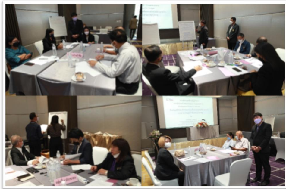
ภาพประกอบที่ 5.1 ประชากรกลุ่มเฉพาะ

ประชากรกลุ่มผสม หมายถึง ประชากรที่มาจากกลุ่มเฉพาะ แยกมากลุ่มละ 1 คน เพื่อผสมรวมเป็น 4 คนต่อ 1 กลุ่ม ดังนั้น แต่ละกลุ่มผสม จึงประกอบด้วย กลุ่มที่ 1 กลุ่มเจ้าหน้าที่รัฐ และองค์กรปกครองส่วนท้องถิ่น กลุ่มที่ 2 กลุ่มเจ้าหน้าที่รัฐและองค์กรปกครองส่วนท้องถิ่นและ นักกฎหมายกลุ่มที่ 3 กลุ่มภาคธุรกิจเอกชน กลุ่มที่ 4 กลุ่มประชาชน