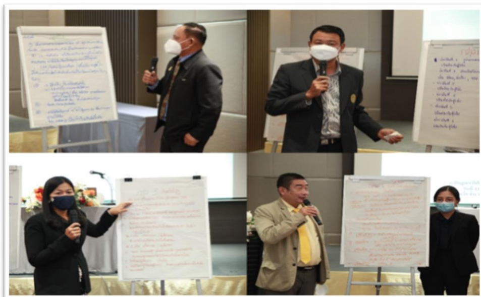
ภาพประกอบที่ 5.4 การนำเสนอผลของกลุ่มเฉพาะ

- ช่วงบ่าย เป็นช่วงที่สอง เป็นการจัดทำ Co - Design กลุ่มผสมใช้เวลาประมาณ 2 ชั่วโมง มีการดำเนินการเช่นเดียวกับกลุ่มเฉพาะ