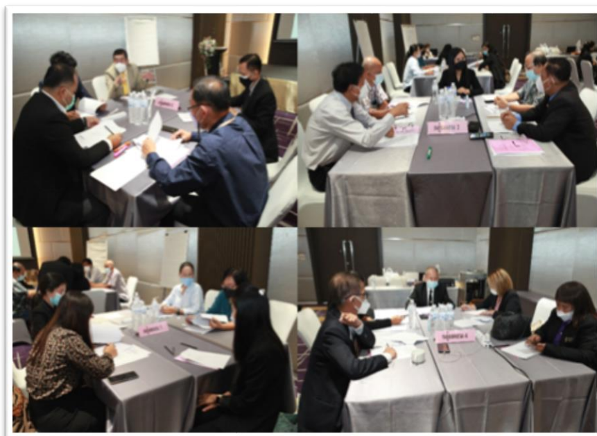
ภาพประกอบที่ 5.6 กลุ่มผสมร่วมปรึกษาหารือ และอภิปราย

ประชากรกลุ่มผสมที่มาจากการนำเอาประชากรกลุ่มเฉพาะกลุ่มละ 1 คน มารวมกันเป็น 4 กลุ่ม จะทำให้เกิดความหลากหลาย ซึ่งหากนำเอาประเด็นในการทำ Co-Design เดียวกับประชากรกลุ่มเฉพาะจะทำให้เกิดการแลกเปลี่ยนตามประสบการณ์การทำงานที่แตกต่างกัน ซึ่งอาจจะมีความคิดเห็นที่คล้ายตามกันหรือขัดแย้งกันก็ได้ แต่ก็ต้องมีคำตอบที่เป็นมติร่วมกันของกลุ่ม (ดังภาพประกอบที่ 5.6 กลุ่มผสมร่วมปรึกษาหารือ และอภิปราย)