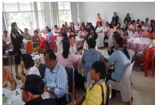
ภาพประกอบที่ 1.2 ผู้วิจัยลงสำรวจบริการวิชาการกับกลุ่มผู้ประกอบการวิสาหกิจชุมชนในจังหวัดสุพรรณบุรี (2558)

ผู้วิจัยได้พบปัญหาในกลุ่มผู้ประกอบการวิสาหกิจชุมชนโดยจำแนกเป็นประเด็นต่างๆ อาทิ เช่น ขาดองค์ความรู้ การตลาด การผลิต การเงิน มาตรฐานที่รองรับ เศรษฐกิจ สภาพแวดล้อม และคู่แข่งจากชุมชนอื่นๆ อีกทั้งยังพบว่าผู้ประกอบการวิสาหกิจชุมชนยังมีจำนวนมากที่ไม่ได้เรียนรู้การ