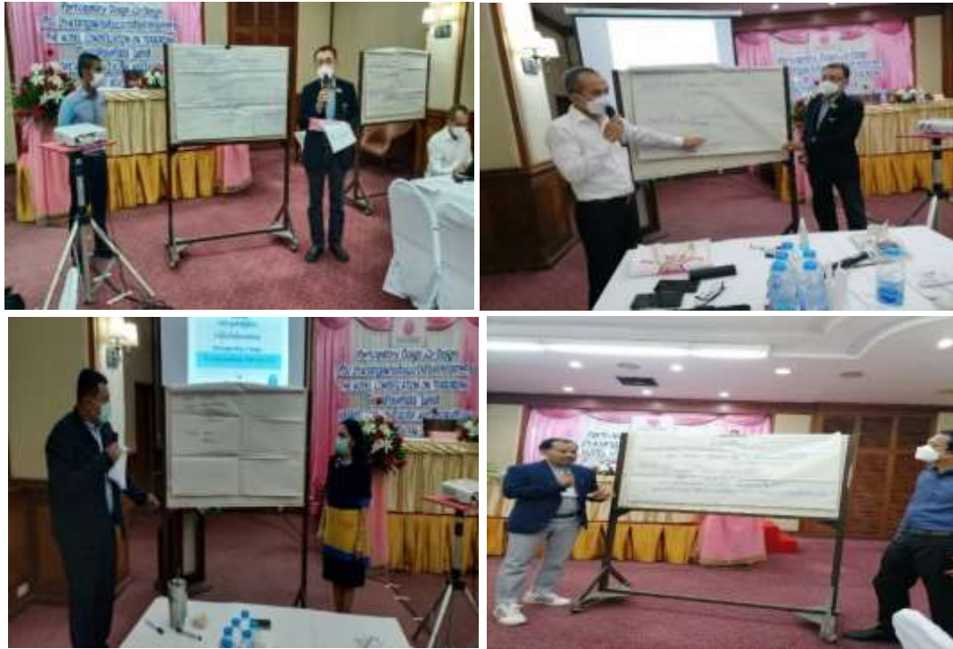
ภาพที่ 2 ประชากรกลุ่มเฉพาะ ร่วมกันระดมความคิดเห็น ในการมีส่วนร่วมออกแบบ, ร่วมออกแบบ (Participatory Design, Co-Design) และนำเสนอผลการสัมมนา