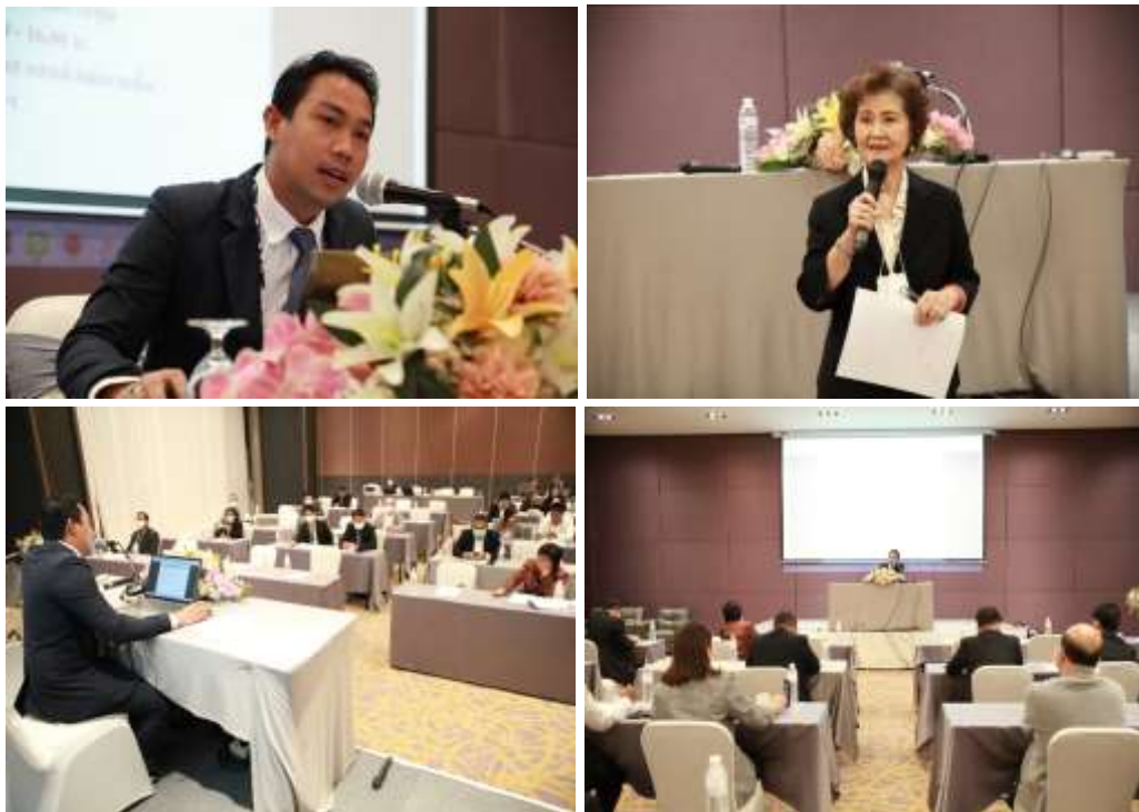
ภาพที่ 2 การนำเสนอร่างกฎหมายของผู้วิจัย