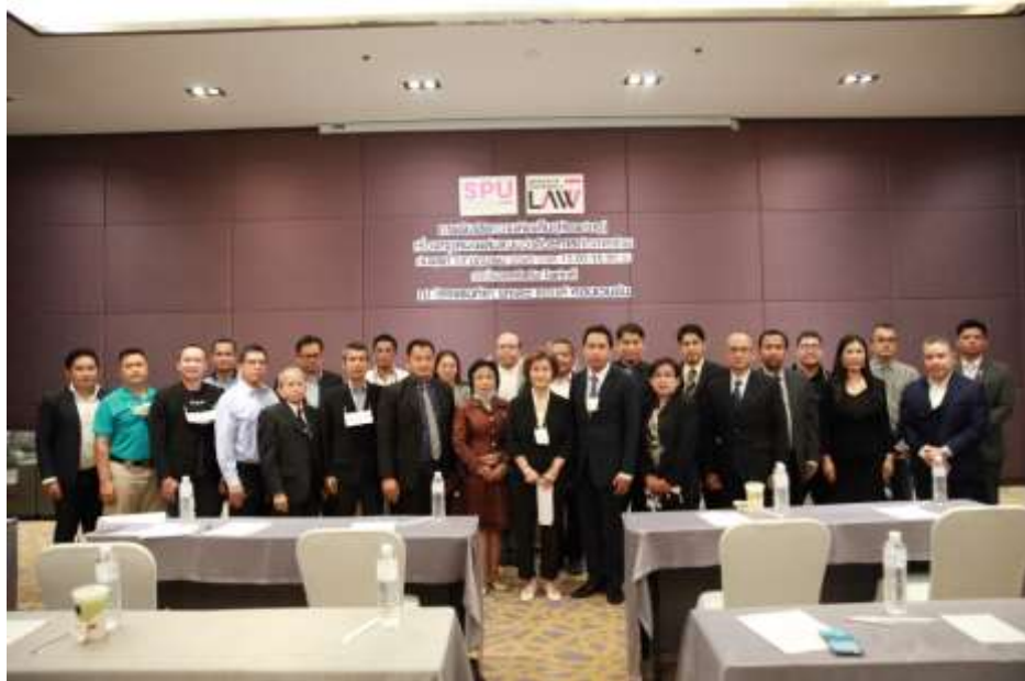
ภาพที่ 1 ประชากรที่เข้าร่วมสัมมนารับฟังความคิดเห็น