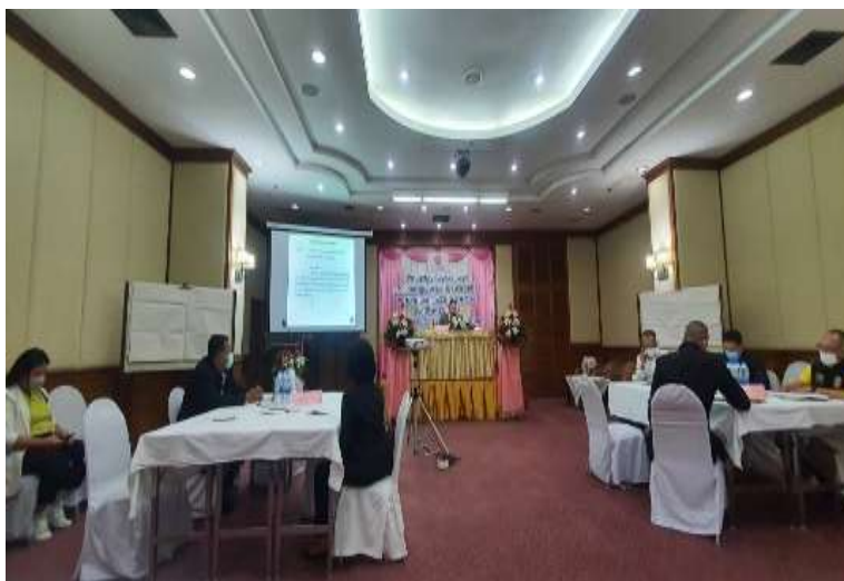
ภาพที่ 1 การมีส่วนร่วมออกแบบ-ร่วมออกแบบ (Participatory Design, Co-Design)