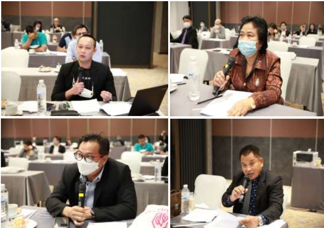
ภาพที่ 3 ประชากรผู้ร่วมสัมมนา แสดงความฟังความคิดเห็นต่องานวิจัย