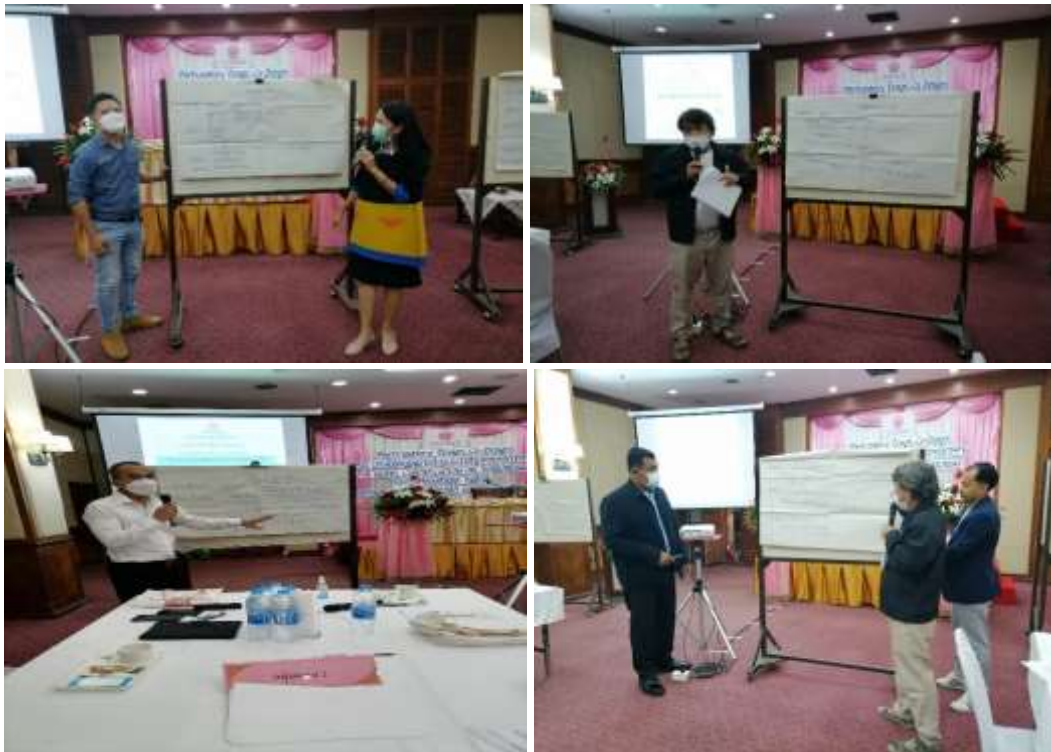
ภาพที่ 3 ประชากรกลุ่มผสม ร่วมกันสัมมนาระดมความคิดเห็น ในการมีส่วนร่วมออกแบบ, ร่วมออกแบบ (Participatory Design, Co-Design) และนำเสนอผลการสัมมนา