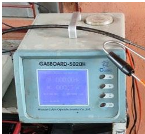
รูปที่ 2 เครื่องวิเคราะห์ก๊าซ CUBIC GASBOARD-5020H