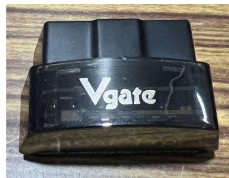
รูปที่ 1 Vgate iCar Pro BlueTooth 4.0 elm 327