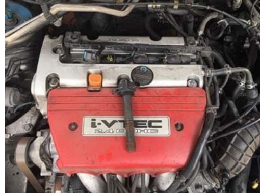
รูปที่ 4 การจำลองให้เครื่องยนต์ทำงานไม่ครบสูบ