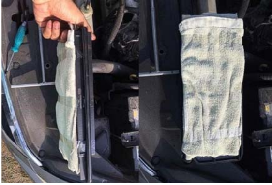
รูปที่ 3 การจำลองให้กรองอากาศเกิดการอุดตัน