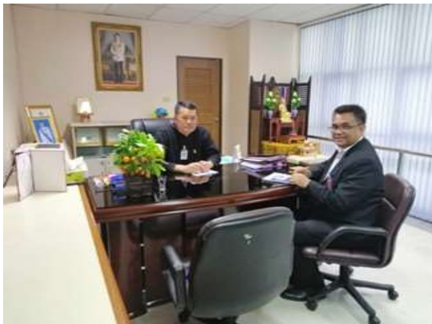
ภาพประกอบที่ 6 สัมภาษณ์เชิงลึก (In-depth Interview) ผู้ว่าการตรวจเงินแผ่นดิน (ผู้แทน)