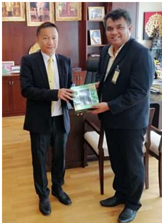
ภาพประกอบที่ 4 สัมภาษณ์เชิงลึก (In-depth Interview) เลขาธิการคณะกรรมการป้องกันและปราบปรามการทุจริตแห่งชาติ (ผู้แทน)