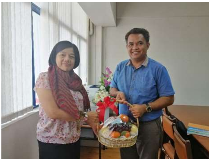
ภาพประกอบที่ 8 สัมภาษณ์เชิงลึก (In-depth Interview) อธิบดีกรมเจ้าท่า (ผู้แทน)