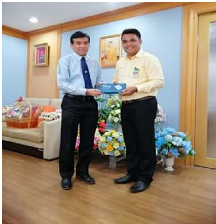
ภาพประกอบที่ 10 สัมภาษณ์เชิงลึก (In-depth Interview) ผู้ว่ากรุงเทพมหานคร (ผู้แทน)