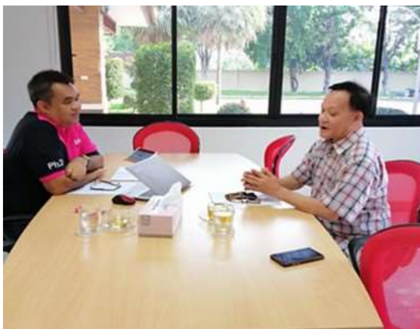
ภาพประกอบที่ 12 สัมภาษณ์เชิงลึก (In-depth Interview) นายกสามคมองค์การบริหารส่วนจังหวัด แห่งประเทศไทย (ผู้แทน)