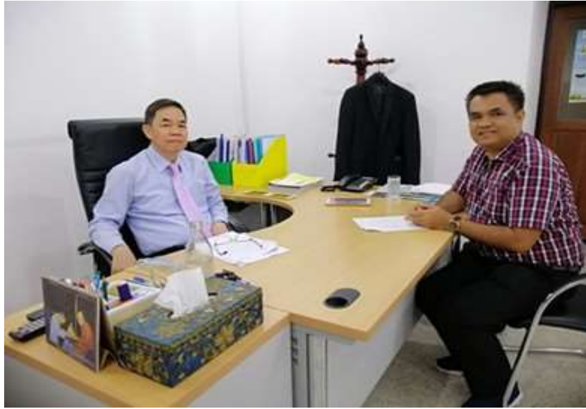
ภาพประกอบที่ 13 สัมภาษณ์เชิงลึก (In-depth Interview) นายกสามคมสันนิบาตเทศบาลแห่งประเทศไทย (ผู้แทน)