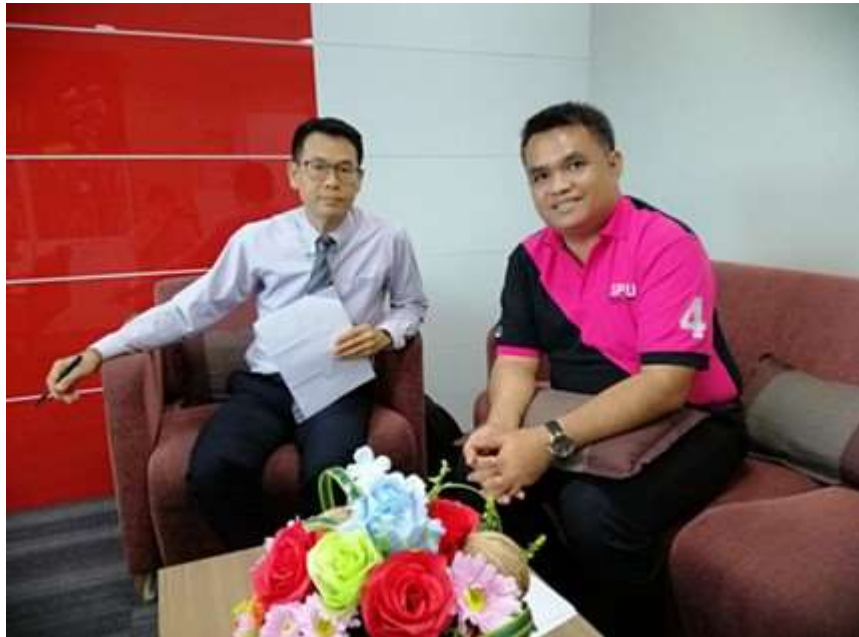
ภาพประกอบที่ 5 สัมภาษณ์เชิงลึก (In-depth Interview) ผู้ตรวจการแผ่นดิน (ผู้แทน)