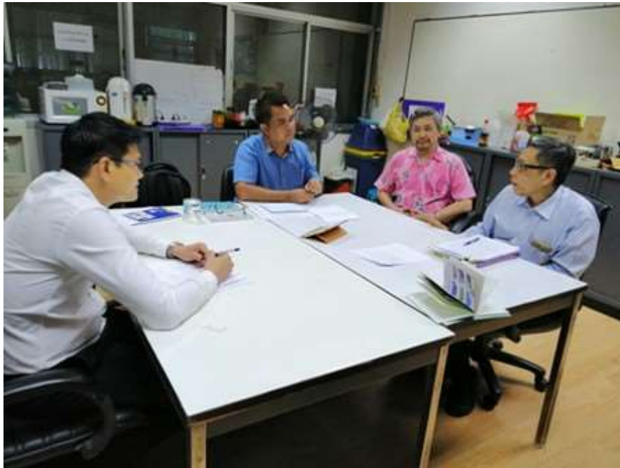
ภาพประกอบที่ 3 สัมภาษณ์เชิงลึก (In-depth Interview) ผู้แทนกระทรวงมหาดไทย (กรมส่งเสริมการปกครองท้องถิ่น)