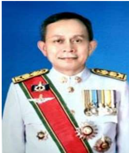
ภาพประกอบที่ 2 สัมภาษณ์เชิงลึก (In-depth Interview) นายอำเภอเมืองสกลนคร