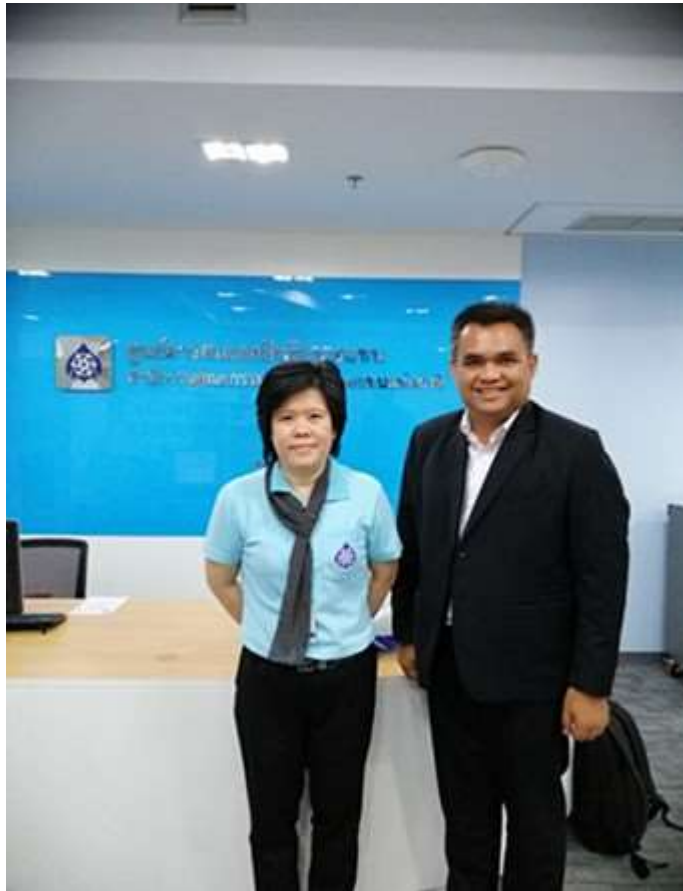
ภาพประกอบที่ 7 สัมภาษณ์เชิงลึก (In-depth Interview) กรรมการสิทธิมนุษยชน (ผู้แทน)