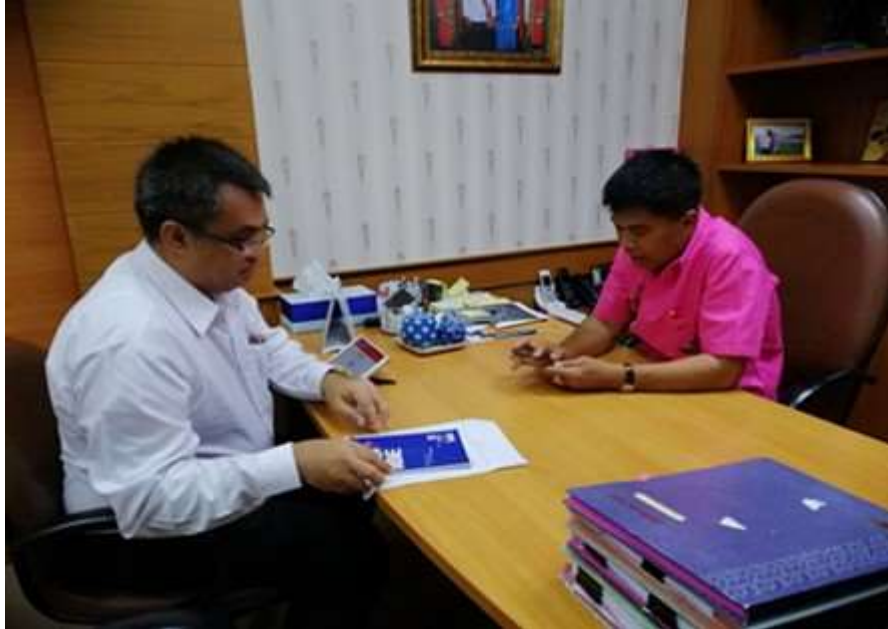
ภาพประกอบที่ 1 สัมภาษณ์เชิงลึก (In-depth Interview) รองผู้ว่าราชการจังหวัดชลบุรี