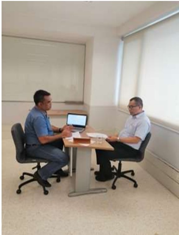
ภาพประกอบที่ 9 สัมภาษณ์เชิงลึก (In-depth Interview) อธิบดีกรมโยธาธิการและผังเมือง (ผู้แทน)