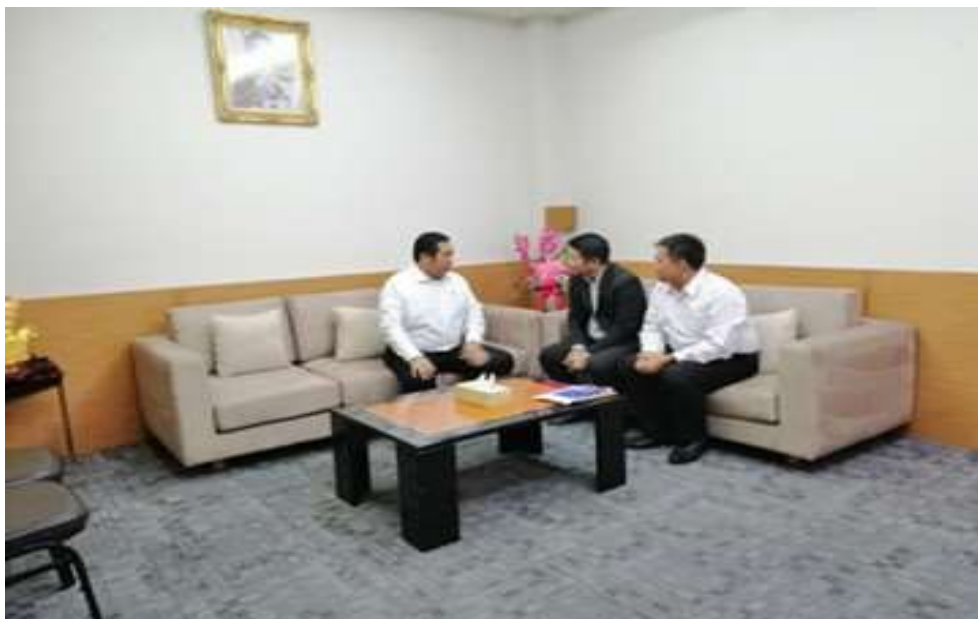
ภาพประกอบที่ 11 สัมภาษณ์เชิงลึก (In-depth Interview) นายกเมืองพัทยา (ผู้แทน)